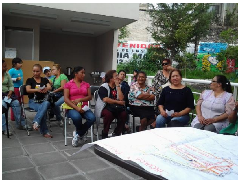
Figura 3: Taller en la “Casa de las mujeres Ifigenia Martínez” en el parque del Copete.

El diseño del equipamiento se desarrolló a partir de cuatro conceptos: el equipamiento como representación de la casa-pública, el equipamiento como espacio de recursos formativos y sociales, un espacio contrario al estereotipo de la mujer como víctima y el equipamiento como un espacio de relación con su entorno. Parte del trabajo de colaboración con los grupos organizados del barrio fue la socialización del proyecto de “la casa” a través de unas jornadas de activismo creativo y una exposición fotográfica de la participación de las mujeres en la construcción del barrio y las expectativas que tenían del proyecto.