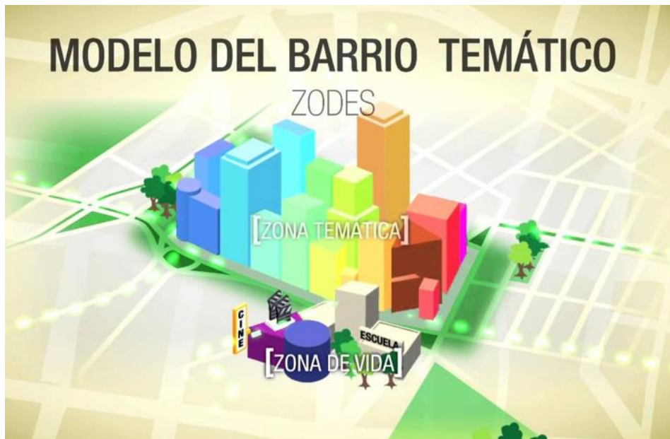
Figura 4: Representación del modelo de barrio temático.

El proyecto fue promocionado por el gobierno de la ciudad, encabezado en ese momento por Marcelo Ebrard. Para iniciarlo cambiaron la Ley de Desarrollo Urbano del Distrito Federal, con el objetivo de que las modificaciones del uso del suelo recayeran únicamente en un comité técnico sin pasar por consulta pública, y dejando la planificación urbana en manos de una agencia de inversiones, con lo que la participación ciudadana fue completamente eliminada (Figura 4).