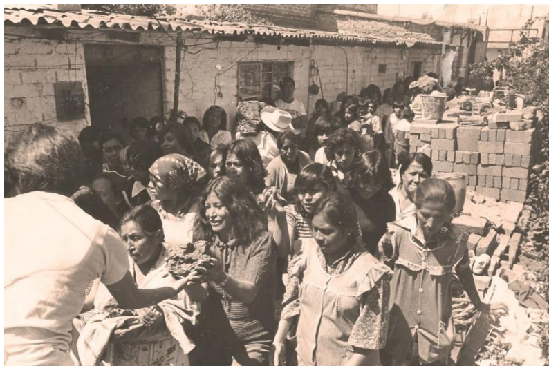
Figura 1: Mujeres en la fundación de la colonia.

Los pequeños relatos son el testimonio vivo que muestra a sus protagonistas la historia de la construcción social del espacio y el papel central de las mujeres en la lucha por ganar un lugar propio. El espacio urbano es mostrado como un paisaje vivo y no terminado, una colonia que se construye en el día a día.