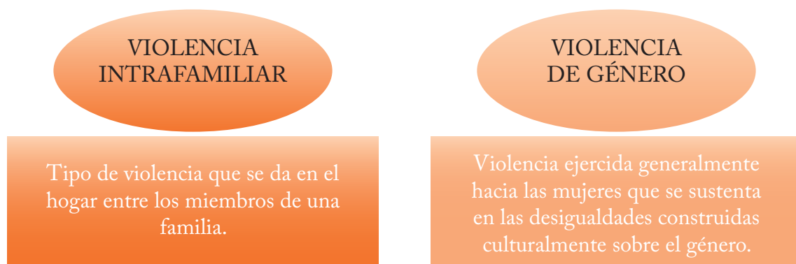
Gráfico 1. Diferencia entre violencia intrafamiliar y violencia de género