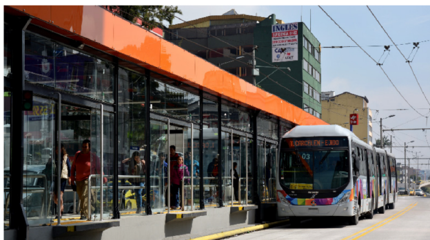
Fig. 2. Sistema trolebús. Primera etapa

Los viajes en transporte público están siendo atendidos por 3.131 unidades (buses “tipo”, articulados, trolebuses y minibuses), distribuidos en 60 operadoras (59 privadas y 1 municipal), de los cuales el 90 % son buses convencionales y el restante 10 % son buses articulados y trolebuses que operan en las troncales de los corredores troncales integrados (BRT). La oferta de transporte público en número absoluto de unidades de buses no ha tenido variaciones significativas en últimos 10 años, tiempo en el cual se ha verificado una disminución de 257 unidades que se asocia a una parte del retiro de buses convencionales en sustitución de los buses articulados incorporados al Corredor Central Norte; mientras que en ese mismo período se incrementó flota solo en casos específicos: 80 buses articulados adquiridos por el Municipio del Distrito Metropolitano de Quito (MDMQ) en el 2011 para los Corredores Nororiental (Ecovía) y Sur Oriental; una ruta interparroquial con 16 minibuses (Floresta-Cumbayá); y, 4 rutas Intraparroquiales (2 en Calderón y 2 en Cumbayá-Tumbaco) con 36 minibuses, Movilidad (2014).