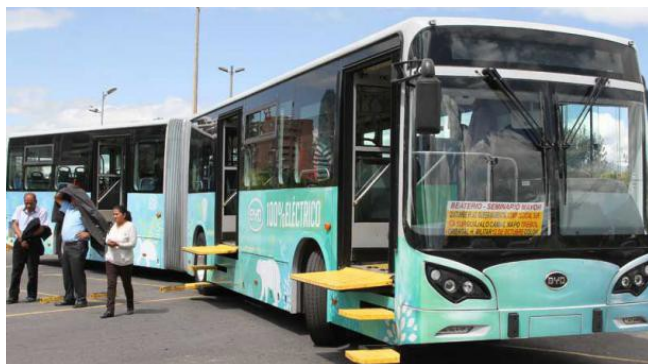
Fig. 4. Autobuses eléctricos para servicio en Quito

En el Ecuador, y en particular en las ciudades de Quito y Guayaquil, actualmente se están introduciendo soluciones de movilidad urbana bajo el esquema de autobuses 100 % eléctricos. Estos autobuses miden 18 metros, tienen capacidad para 160 pasajeros, no permiten que el conductor sobrepase los 60 kilómetros por hora (la legislación establece un límite de velocidad de 50 km/h dentro de las ciudades) y no emite gases contaminantes, fabricante BYD, (fig.4). Para que este bus funcione requiere ser cargado durante tres horas y con ello logra una autonomía de 300 kilómetros. En cuanto al valor es casi el doble que su equivalente a diesel. Al no tener motor, ni funcionar con combustible, le ahorra al operador hasta el 50 % del costo de mantenimiento. Con la primera carga podremos conocer cuánto se debe pagar, pero vale mencionar que en promedio hay un 70 % de ahorro en relación a lo que se gasta en combustible.