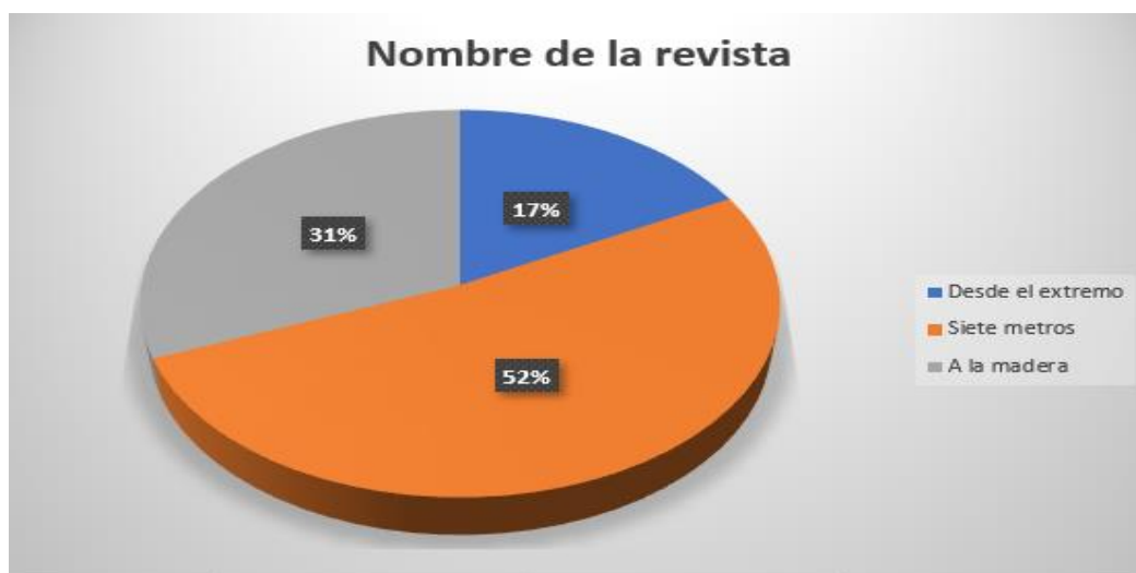
Gráfico 2. Nombre de la revista

La encuesta la realizaron un total de 29 personas, de las cuales el 52% se decidieron por el nombre de Siete Metros (15), el 31% eligieron A la madera (9) y solo el 17% se inclinó por Desde el extremo (5).