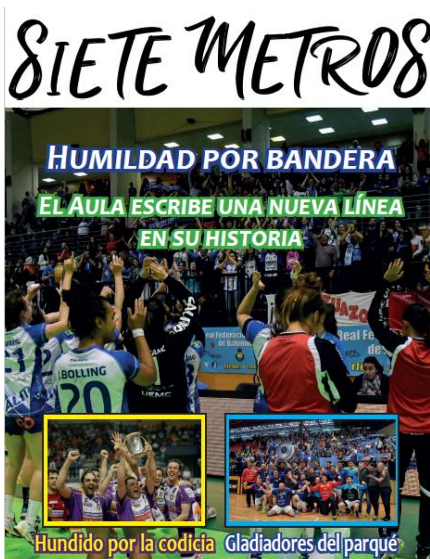
Imagen 3. Portada interactiva de la revista 2