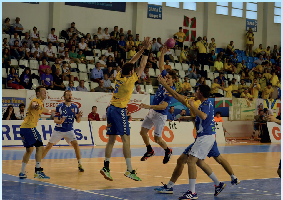
Encuentro de playoff ante Bidasoa que ganó el Atlético.

En la Copa del Rey, el Atlético Valladolid llegó hasta la ronda de octavos de final al ganar al Bidasoa Irún por 31-27 en la primera ronda