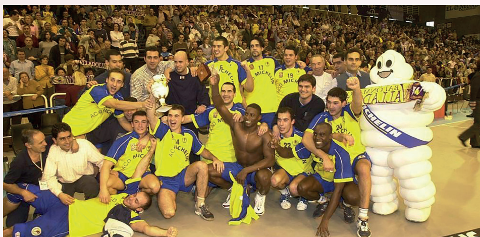
La plantilla celebra la victoria

A la espera de que llegue el 14 de diciembre, la ciudad del Pisuerga se prepara para recibir a los aficionados del balonmano y vivir con la intensidad de siempre una nueva edición de la Copa Asobal. El precio del abono general será de 30€ para los tres partidos.