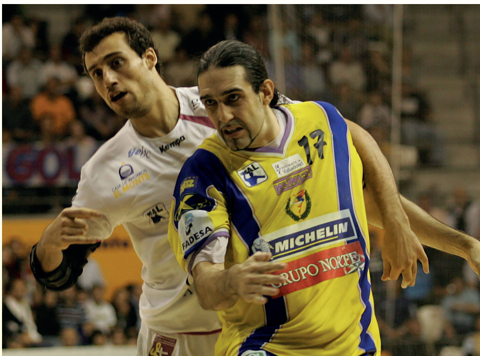
Garabaya llegó en la campaña 01/02

Terminados los años noventa, la mejoría económica del BM Valladolid hizo que los morados comenzaran a vivir una época gloriosa. El equipo inauguró la temporada 00/01 con el encuentro de la Supercopa de España frente al Barcelona. Los vallisoletanos se volvían a ver las caras con Fernando Hernández, aunque fue el exjugador quien se llevó el gato al agua, al ganar 34-32 en la prórroga. El equipo no se clasificó para ninguna competición europea ese año, aunque en liga consiguieron ganar al Barcelona en Huerta del Rey por primera vez. Además, los vallisoletanos debutaron en la Recopa de Europa llegando hasta semifinales, donde se midieron al Ademar de León. Contra los leoneses perdieron en los dos encuentros, tanto en León (36-24) como en Valladolid (22-33).