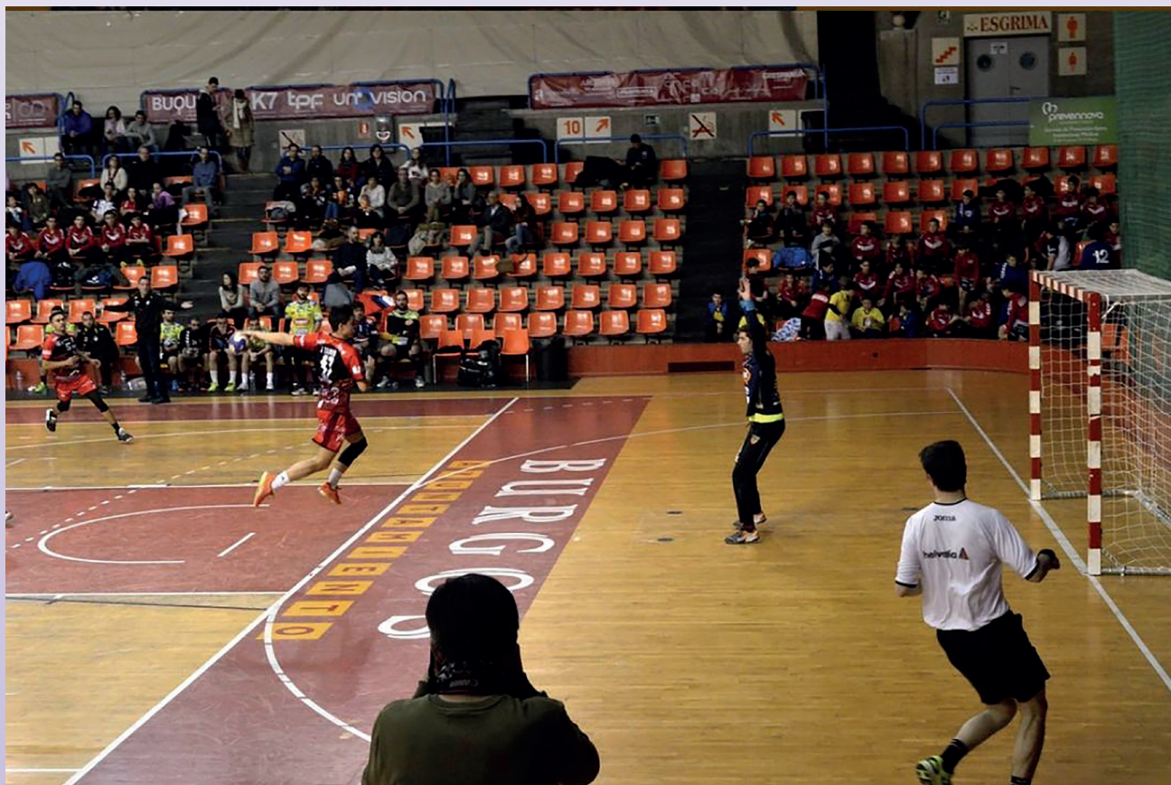
Encuentro en el Polideportivo de Burgos

Los árbitros levantan la mano cuando a su juicio, un equipo no quiere atacar, lleva un tiempo en fase de ataque y no está logrando una ventaja o la defensa le gana la partida. El tiempo comienza a contar desde el momento que los jugadores tienen el balón, incluso antes de sacar de centro tras un gol.