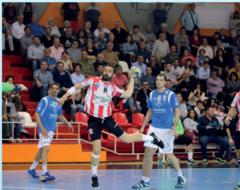
El equipo finalizó en la novena posición en la temporada 17/18.

El Atlético Valladolid siguió mejorando en la cuarta temporada, al final en la novena posición y alcanzar los cuartos de final de la Copa.