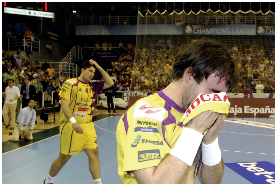
Se quedaron sin final por un gol

Los de Valladolid ganaron la Copa del Rey al Ciudad Real en la final por 35-30, conquistando la segunda de forma consecutiva.