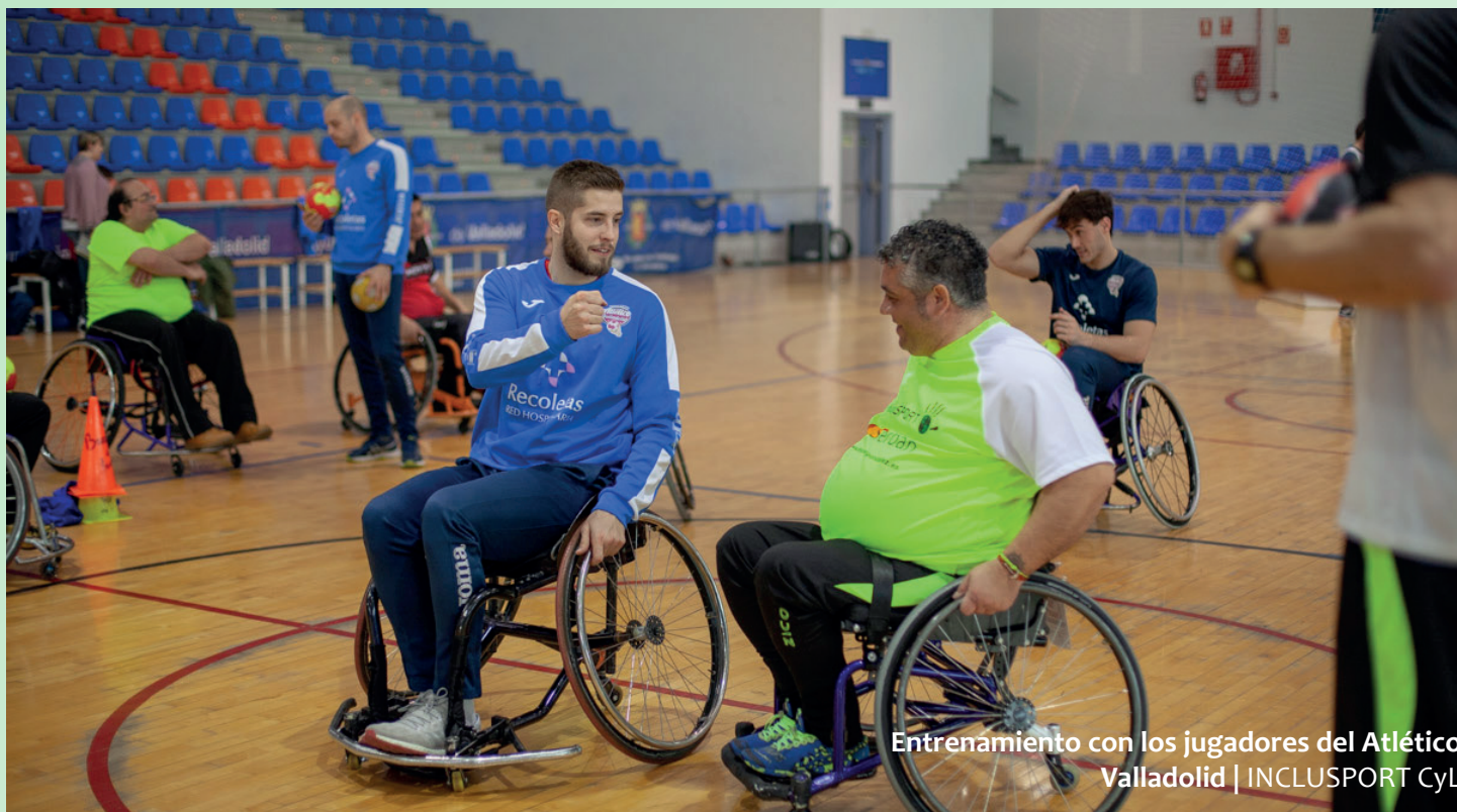
Entrenamiento con los jugadores del Atlético Valladolid | INCLUSPORT CyL