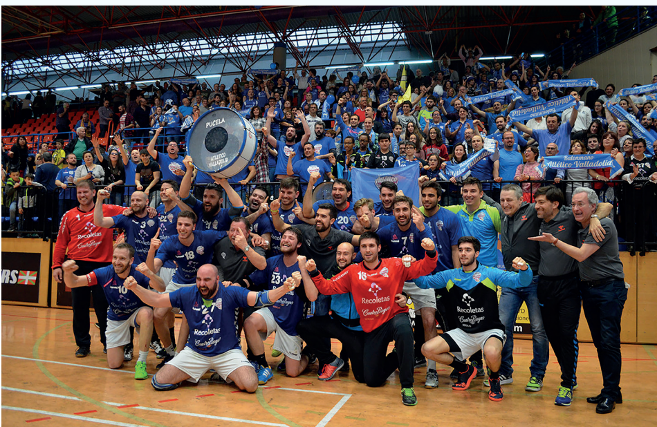
Celebración del ascenso del Atlético que tuvo lugar en Irún.