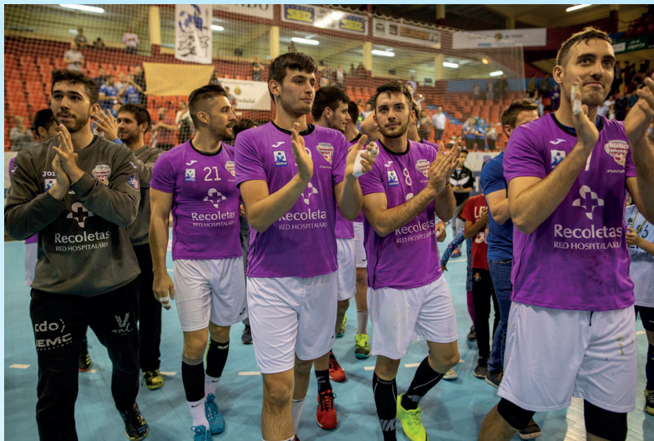
Los jugadores se despiden de Huerta hasta la siguiente temporada.

El verano de 2019 fue movido en las oficinas azules. A la marcha al Barcelona de Abel Serdio se le sumó la del entrenador David Pisonero a Hungría. Esto se ha traducido en un mal comienzo liguero de la temporada 19/20 con cuatro victorias en once partidos en la competición doméstica.