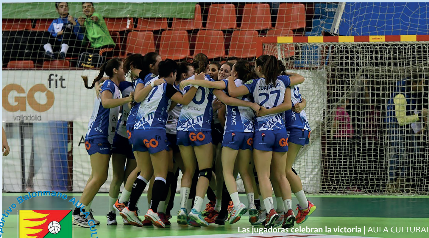
Las jugadoras celebran la victoria