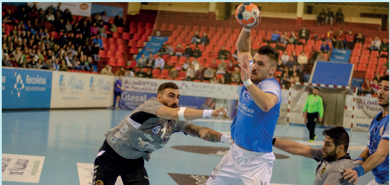
Roberto tira ante la mirada del defensa de Liberbank Cuenca | ATLÉTICO VALLADOLID

No me gusta mirar al futuro, pero estaré vinculado de alguna manera al balonmano.