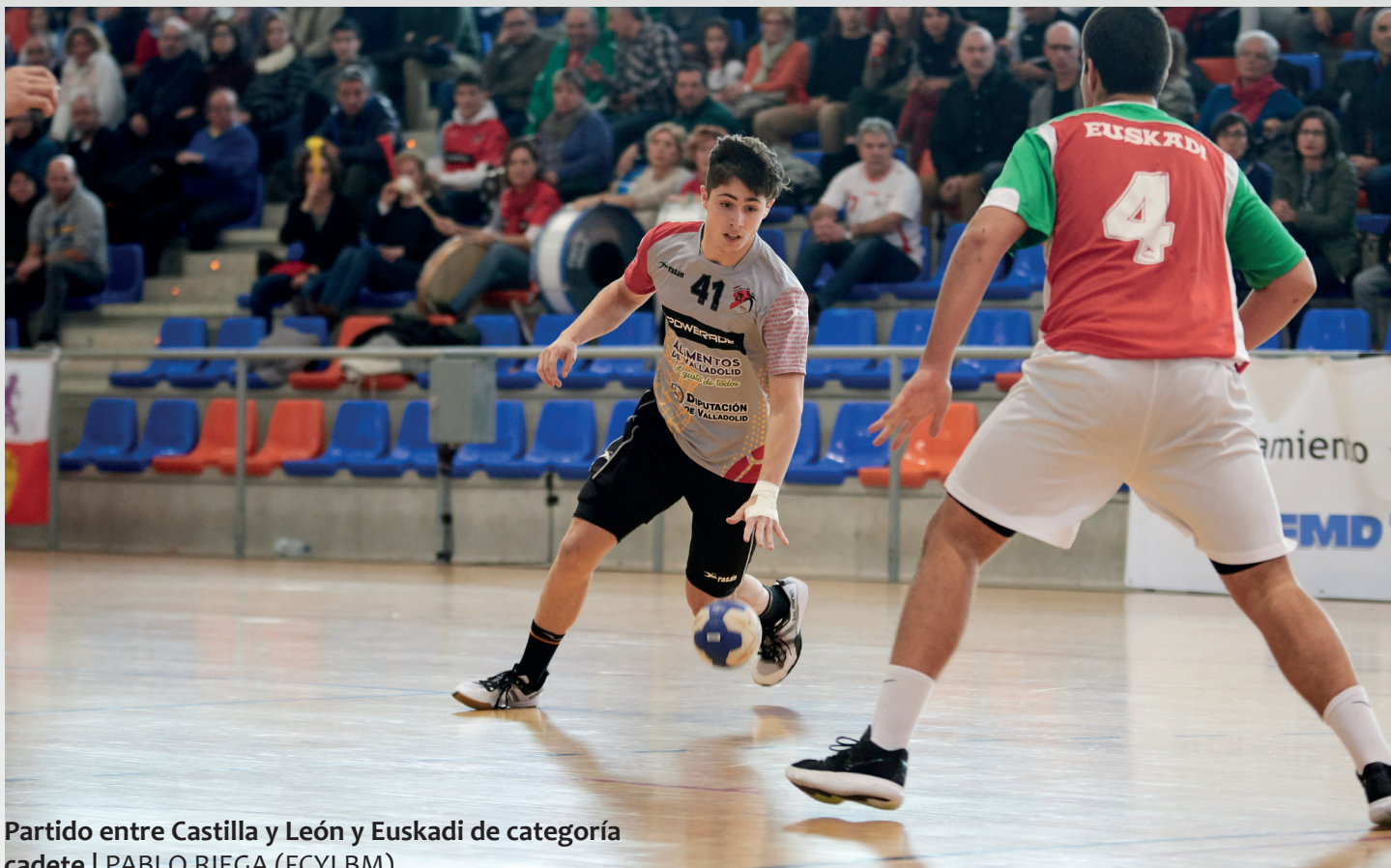
Partido entre Castilla y León y Euskadi de categoría cadete | PABLO RIEGA (FCYLBM)