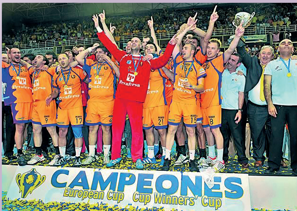
El BM Valladolid consiguió en 2009 su único título europeo | AS

La temporada 08/09 dejó la mejor clasificación histórica del club, con la obtención del tercer puesto en Asobal y la conquista del único título a nivel europeo, la Recopa de Europa. Esto se logró tras haber disputado su sexta final europea,