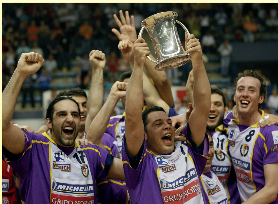
El BM Valladolid logró ganar dos Copas del Rey

“Estar ya en Europa era muy difícil por todo lo que conlleva tanto a nivel deportivo como extradepor-tivo. Alcanzar el título estaba en el sueño de todos, pero nos quedaba muy lejos”, dice Ávila.