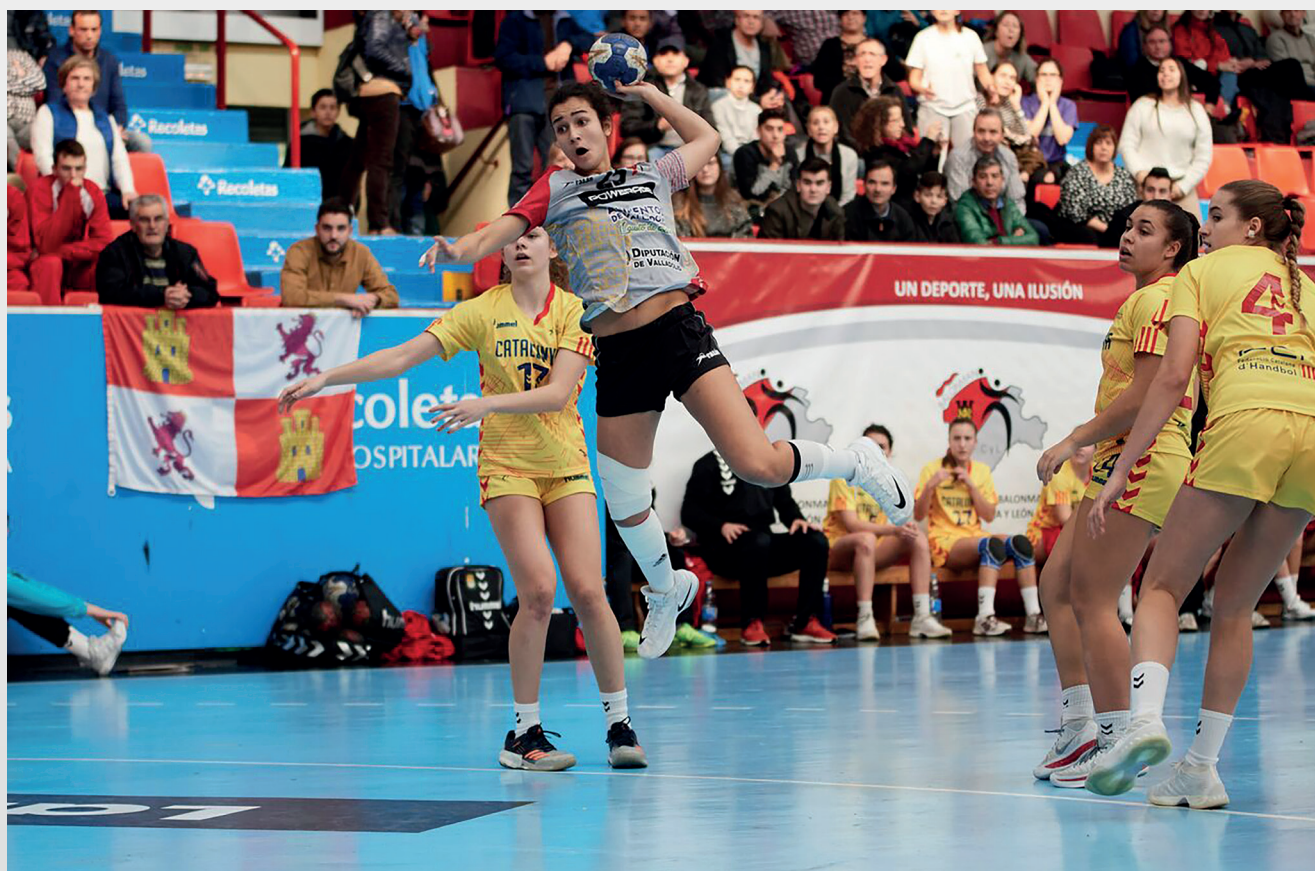
Una juvenil de Castilla y León lanza a portería | FCYLBM

Por parte de los equipos femeninos, los malos resultados seguían llegando. Las infantiles perdieron 25-20 ante Canarias en un choque dominado por las segundas desde el principio, con las castellanas-leonesas por detrás del marcador. Con esta derrota, las infantiles de Castilla y León tuvieron que jugar por el séptimo puesto.