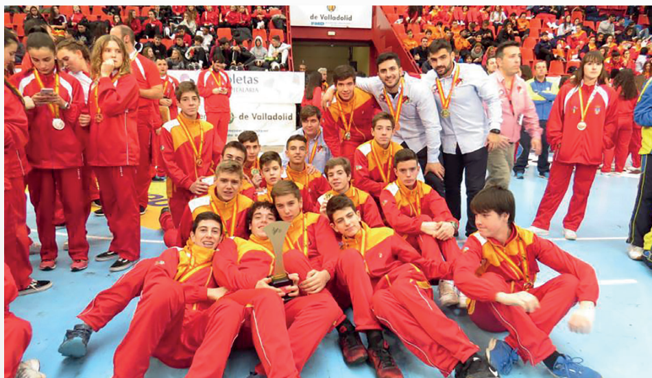
El infantil se proclamó campeón de la Copa | FCYLBM

Tras el paso por vestuarios, la Comunidad Valenciana reaccionó hasta recortar el electrónico a