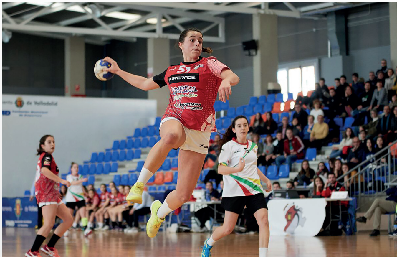
Una cadete lanza a portería en el Pilar Fernández Valderrama

Las cadetes, por su parte, cayeron ante Euskadi por un ajustado 31-32 en un enfrentamiento que se presentaba favorable a falta de 25 minutos para el final, con una ventaja de cinco arriba. No obstante, las vascas, con dos parciales de 0-4, se adelantaron en el marcador para acabar ganando el partido. Al igual que las infantiles, las cadetes jugaron el choque por el séptimo puesto en el CESA.