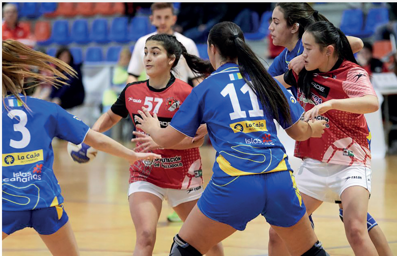
Una infantil del Castilla y León tiene la posesión del balón

Los tres equipos femeninos cayeron derrotados en cuartos de final. El combinado del juvenil femenino perdió ante Cataluña por 26-28 en un duelo donde las catalanas gestionaron mejor los tiempos para acabar clasificándose para la siguiente ronda.