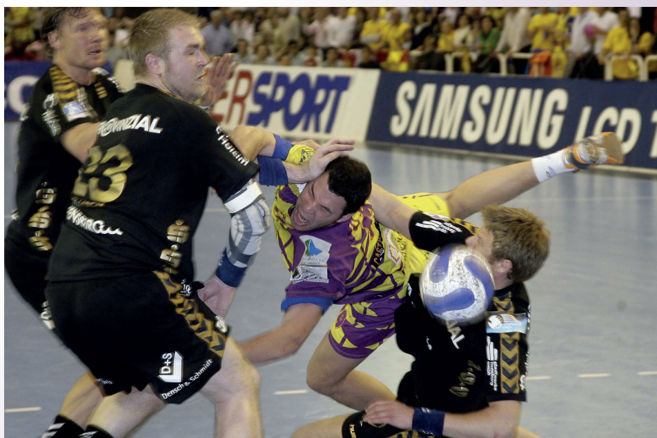
El encuentro se jugó en Pisuerga

temporada 06/07, con una actuación sensacional. Sólo un penalti errado en el último instante privó a los vallisoletanos de jugarla. “Habíamos conseguido que se hablara de nosotros en España y era nuestra oportunidad de dejar nuestra huella en Europa. Que un equipo como el nuestro llegara a la final habría sido un hito histórico”, lamenta Garabaya.