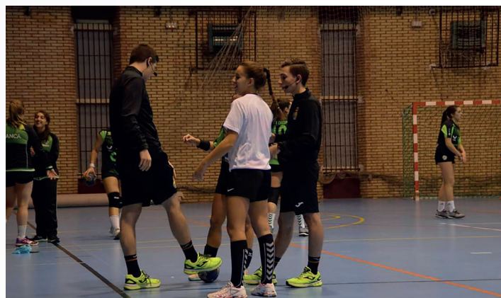
Las capitanas eligen antes del partido.

Sí. El pinganillo es un instrumento muy útil e importante que supone un gran avance para mejorar las decisiones que se toman a lo largo del partido.