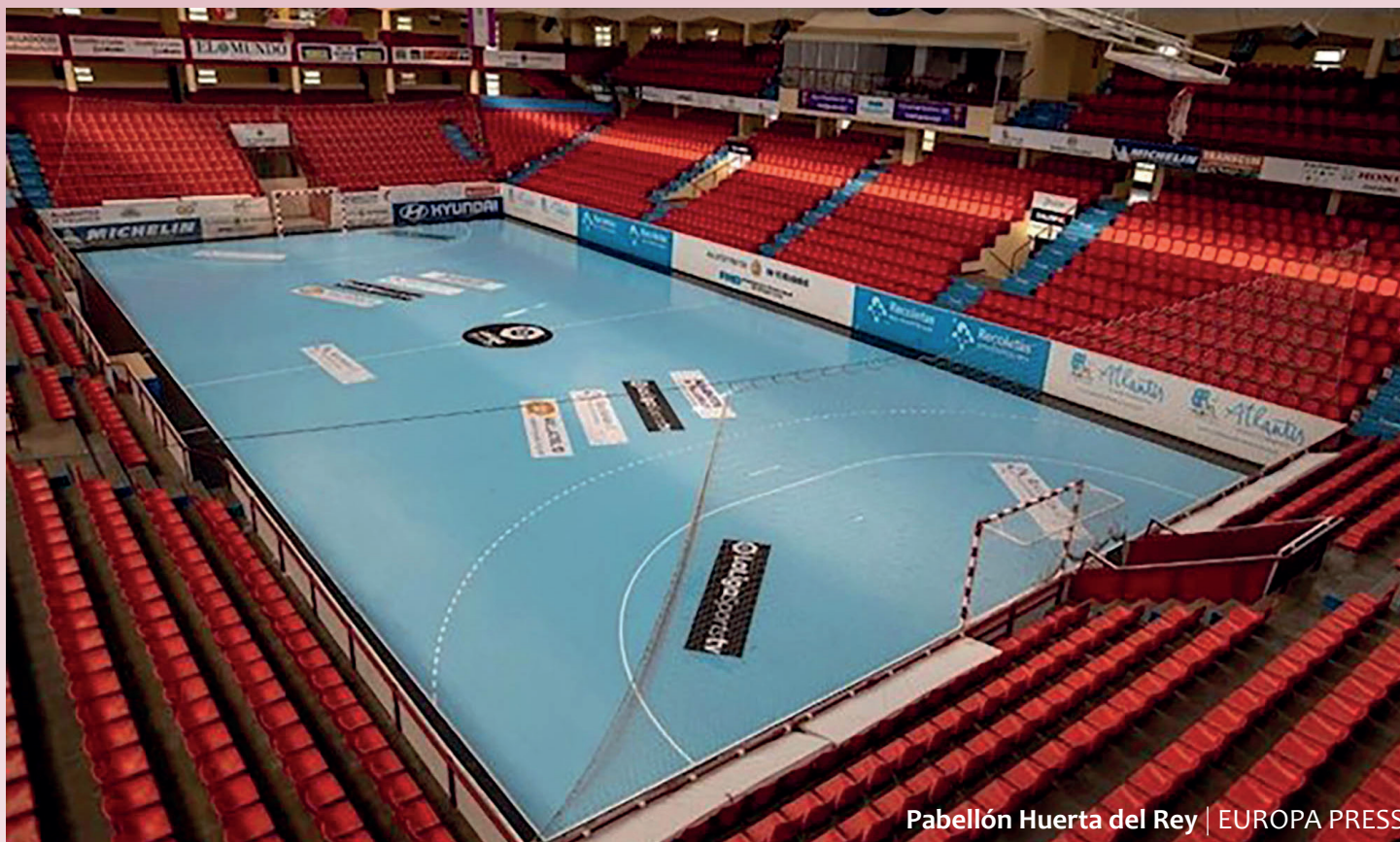
Pabellón Huerta del Rey