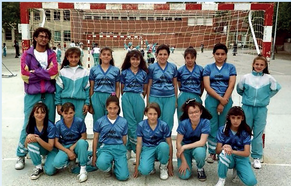
Inicios del Aula Cultural en el Colegio Colón | AULA CULTURAL

Si hay una generación que hizo que el Aula Cultural llegara a donde está en estos momentos, esa fue la generación del 94. La gran mayoría de integrantes eran del barrio de Los Pajarillos, un barrio particular, ya que “era conflicti-