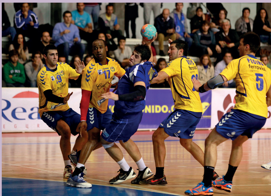
La deuda creció hasta ahogar al club