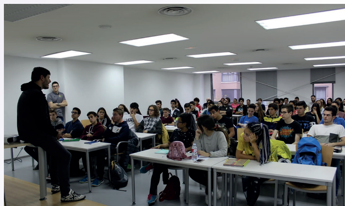
Charla formativa con Malumbres.

Las funciones que tiene la mesa son las labores de anotador y cronometrador. Además, las personas que trabajan en esto se encargan de apuntar los goles, las sanciones, supervisar que se hagan bien los cambios y controlar los tres ataques después de la atención a un jugador.