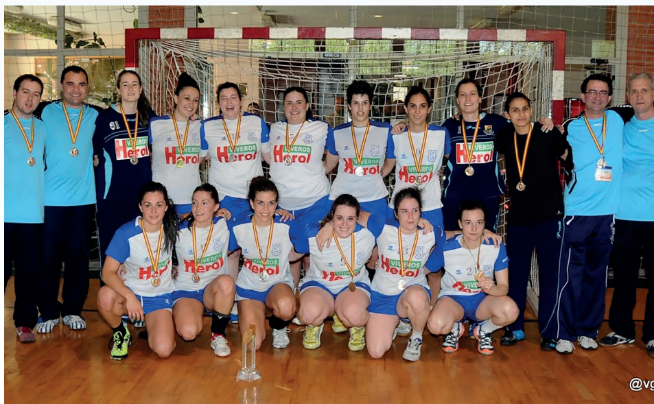
Plantilla que consiguió el ascenso a División de Honor | VALETÍN G. GARIBAY

Desde hace seis años, el Aula Cultural juega en la División de Honor, la máxima categoría del balonmano español femenino, sin bajar de la séptima posición de la tabla clasificatoria. Esto les ha permitido codearse con las mejores plantillas de la liga, hasta el punto de vencerlas, como el caso del equipo vasco del SuperAmara Bera Bera en tres años seguidos en la liga Guerreras Iberdrola.