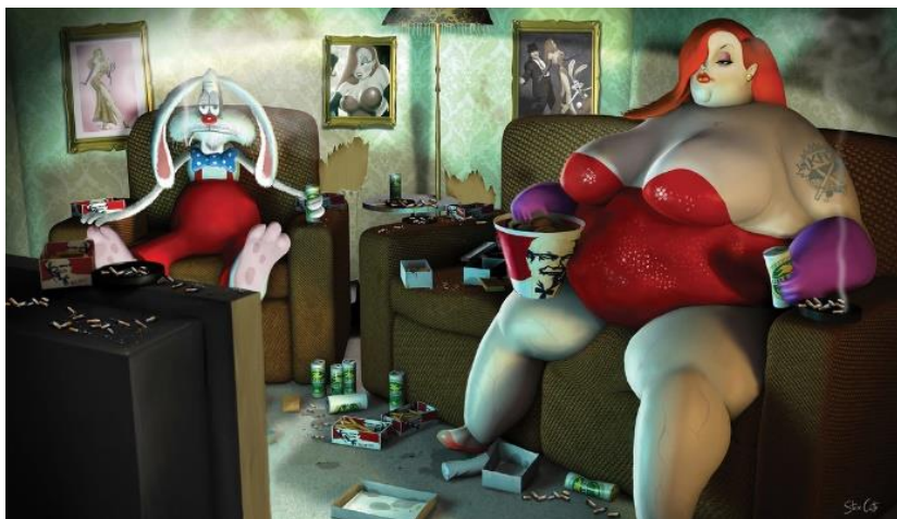
Imagen 2. Steve Cutts, 2016

Diversos artistas, como el británico Steve Cutts, han reivindicado a través de sus ilustraciones situaciones cotidianas que vive un ser humano en el S. XXI. (Imagen 2) Esta obra es un ejemplo de ello. Representa la avaricia del ser humano, el consumismo, la comida rápida y, en definitiva, actos que han