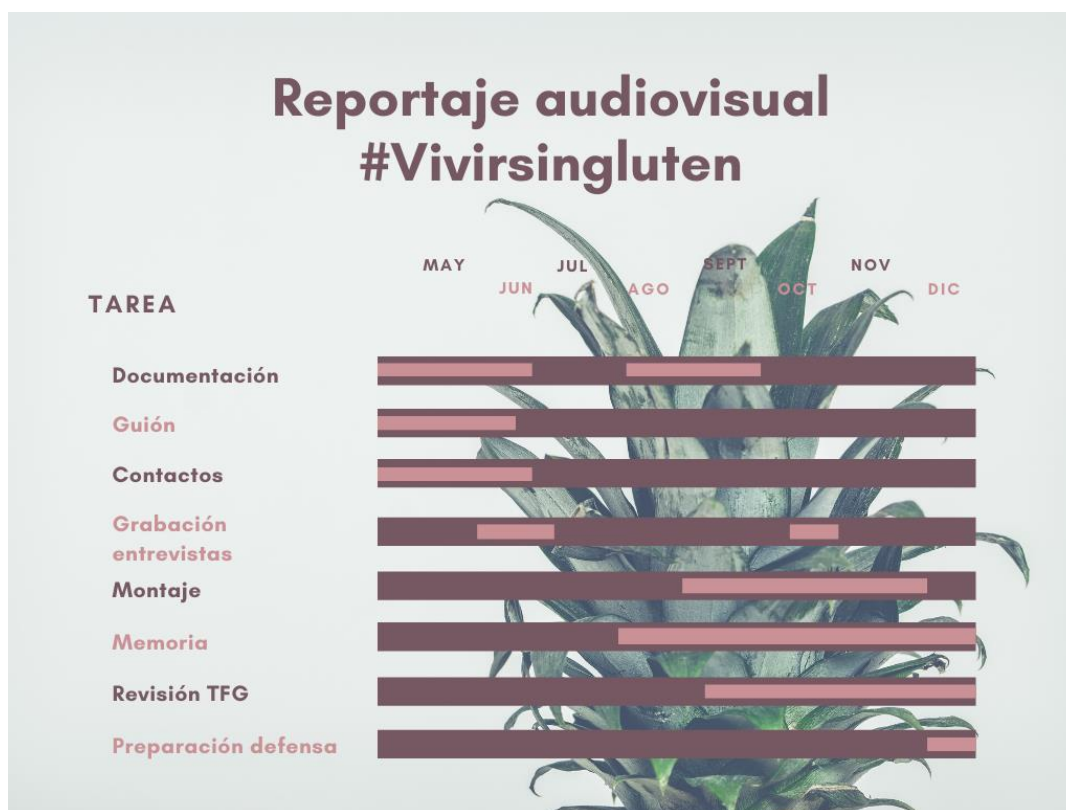
Imagen 8. Diagrama de Gantt para el reportaje audiovisual #VivirSinGluten

Para poder organizarme y saber exactamente todo lo que tenía que hacer para este reportaje elaboré un Diagrama de Gantt. Estoy familiarizada con este tipo de diagramas pues como productora audiovisual he elaborado más de uno a lo largo de mi carrera. Primero lo hice en sucio, para más tarde, a través de la web Canva , realicé mi calendarización para el reportaje (Imagen 8) que se puede observar bajo estas líneas.