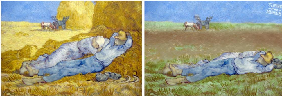
Imagen 3. La Siesta , de Vicent van Gogh

alojada en Internet se encuentran fotogramas de películas tales como La Dama y el Vagabundo (Imagen 5) (1955, Walt Disney), Pulp Fiction (Imagen 6) (1995, Quentin Tarantino), o una escena (Imagen 7) de la película 66 Scenes From America (1982, Jørgen Leth) en la que el artista Andy Warhol sale comiéndose una hamburguesa de la multinacional Burger King . De esta manera, los artistas de GlutenFreeMuseum convierten a los celíacos en protagonistas de diversas obras de arte.