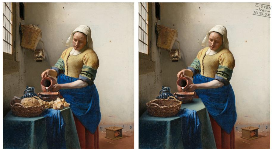
Imagen 4. La Lechera , de Johannes Vermeer