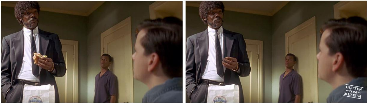
Imagen 6. Pulp Fiction, Quentin Tarantino