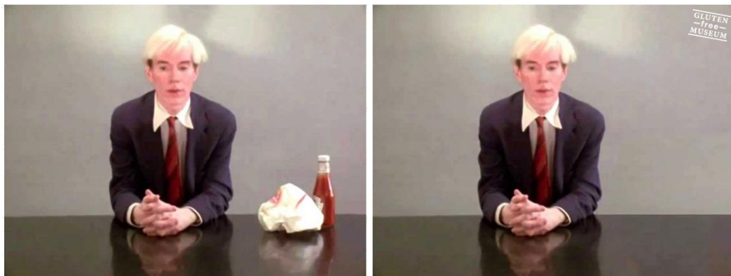
Imagen 7. Andy Warhol en 66 Scenes From America, Jørgen Leth