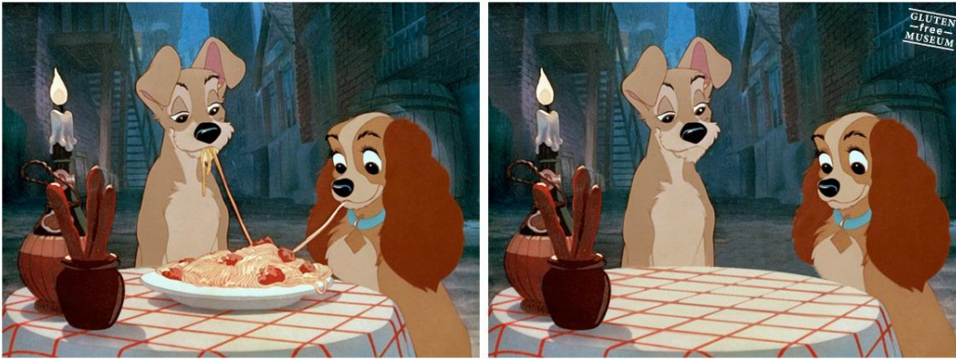
Imagen 5. La dama y el vagabundo, Walt Disney