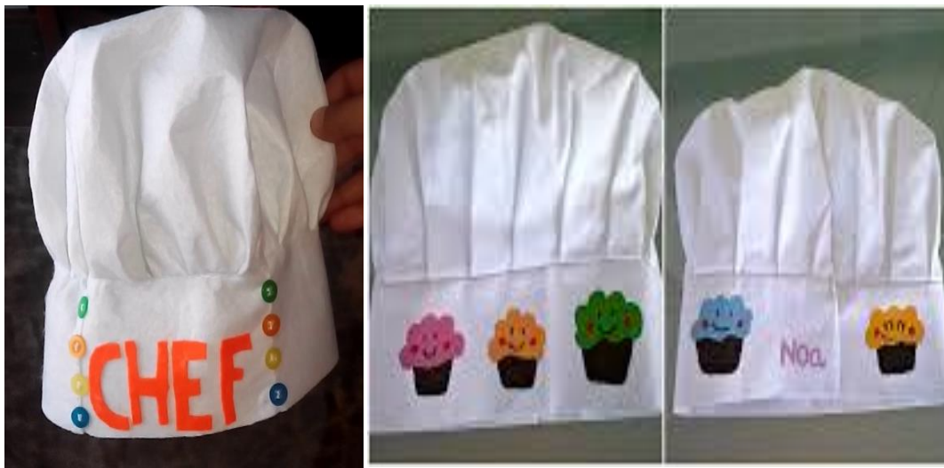
Imagen 3: Gorros decorados

Dimos la opción de que decorasen el gorro a su gusto, ofreciéndoles pegatinas de comidas, rotuladores especiales, etc. Se pudo observar la creatividad e implicación de los familiares y de los pequeños a la hora de decorar su vestimenta. Por otro lado, se pudo observar que algunas familias hicieron la básico para tenerlo a tiempo, pero sin esforzarse lo más mínimo.