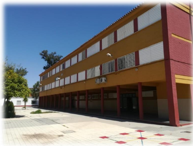
Imagen 1. Fachada del CEIP Cristóbal Colón.

El CEIP Cristóbal Colón es un colegio de titularidad pública, dependiente de la junta de Andalucía, que imparte educación infantil y educación primaria. Hay un total de 217 alumnos y alumnas, de los cuales 45 pertenecen a educación infantil.