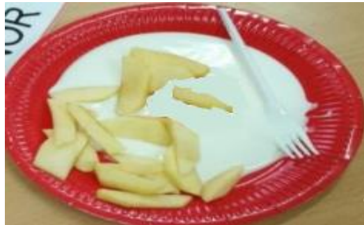
Imagen 4: Plato de macarrones con tomate sin colorante

La receta fue un éxito, ya que la participación de las familias junto con sus hijos e hijas fue espléndida.