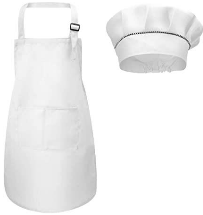
Imagen 2: Outfit Cocinero

Dimos la opción de que decorasen el gorro a su gusto, ofreciéndoles pegatinas de comidas, rotuladores especiales, etc. Se pudo observar la creatividad e implicación de los familiares y de los pequeños a la hora de decorar su vestimenta. Por otro lado, se pudo observar que algunas familias hicieron la básico para tenerlo a tiempo, pero sin esforzarse lo más mínimo.