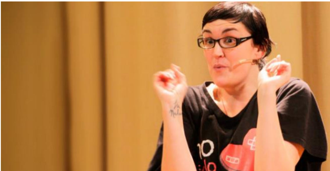
Entrevista para Público, 2017