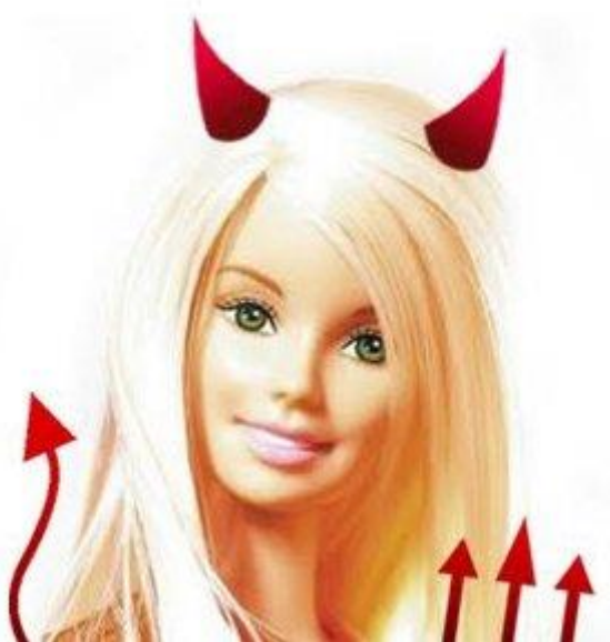
Imagen de perfil en Twitter

Con más de 300 mil seguidores en Twitter, Barbi apareció en 2009 para denunciar el machismo de nuestra política y de nuestra sociedad activando el sentido crítico de miles de personas por su retórica tan personal. Famosa por ser una máquina de polémicas, se ha convertido en toda una referencia para el feminismo radical de nuestro