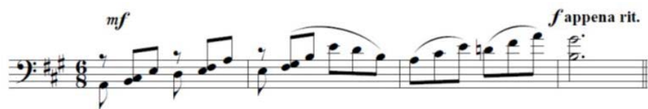
Ejemplo 11. Primera idea temática con carácter introductorio (cc. 1-4) de Guajira (1956).

La idea temática con carácter introductorio consignada en el ejemplo 11 tiene como característica que, a pesar de estar concebida en el marco de una obra denominada Guajira , que se sustenta en la alternancia métrica 6/8-3/4, transcurre en el primer compás. Además, genera una línea melódica sobre las funciones básicas de La Mayor con un ritmo armónico y métrico constante (nótese el diseño de tríada fundamental disuelta ascendente), aunque hacia el término de la frase aparece la indicación agógica de appena rit. Tales códigos tienen la propiedad de significar las secciones introductorias del punto cubano cuyas propiedades discursivas son similares, con la peculiaridad de presentar hacia su final una ralentización que marca la entrada del poeta ( Ibid. , 112).