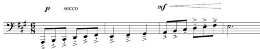
Ejemplo 13. Idea temática conectora (cc. 9-12) de Guajira (1956)

al final del primer núcleo temático, en la cadencia abierta sobre el V grado, encontramos una bordadura superior que ha sido descrita como parte de los discursos acompañantes de las secciones introductorias del punto —ejemplo 12—, aunque en este caso no se explota la función típica de doble dominante (León1984, 109). Adviértase señalado en rojo la bordadura superior sobre la fundamental del V grado de La mayor, que describe una cadencia abierta sobre esta función. Con ello es posible afirmar que el primer ámbito recursivo empleado por el autor en Guajira es el de la música campesina menos influida por factores transculturales, específicamente de géneros como el punto y el zapateo.