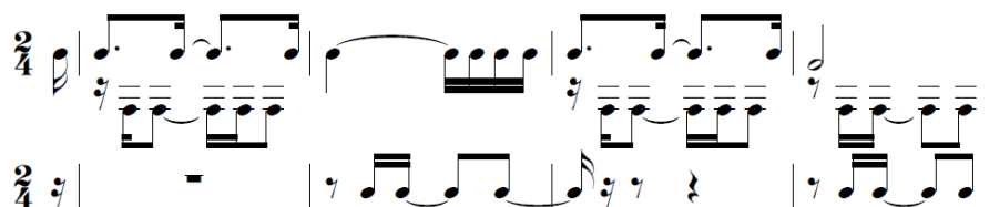
Ejemplo 4. Polirritmia (cc. 7-10) de Montuna (1948).

necesariamente se superponen ritmos. Sin desconocer dicha noción, el ejemplo 4 consiste en la modelización de la polirritmia resultante de los compases del 7 al 10 (equivalentes al primer sistema del ejemplo 3). Este modelo evidencia que las voces en sus específicos rangos desarrollan formaciones rítmicas reiterativas que delinear los patrones recíprocos de Orozco, específicamente el tresillo y el cinquillo. Opino que el compositor aprovecha las reglas del contrapunto, según las cuales una voz ha de moverse cuando otra se estabiliza, para construir una superposición de ritmos reiterativos que tienen la propiedad de significar prácticas de las músicas cubanas.