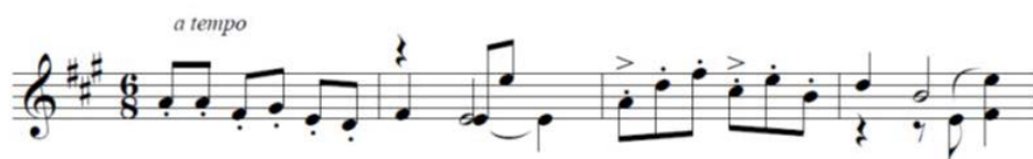
Ejemplo 14. Tercera idea de fuerte identidad temática (cc.17-20) de Guajira (1956)