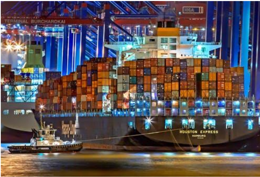
Imagen 2: ejemplo de globalización comercial.