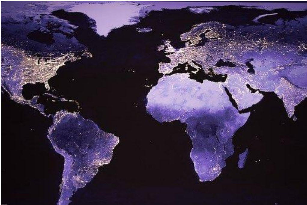
Imagen 3: Planeta tierra de noche.