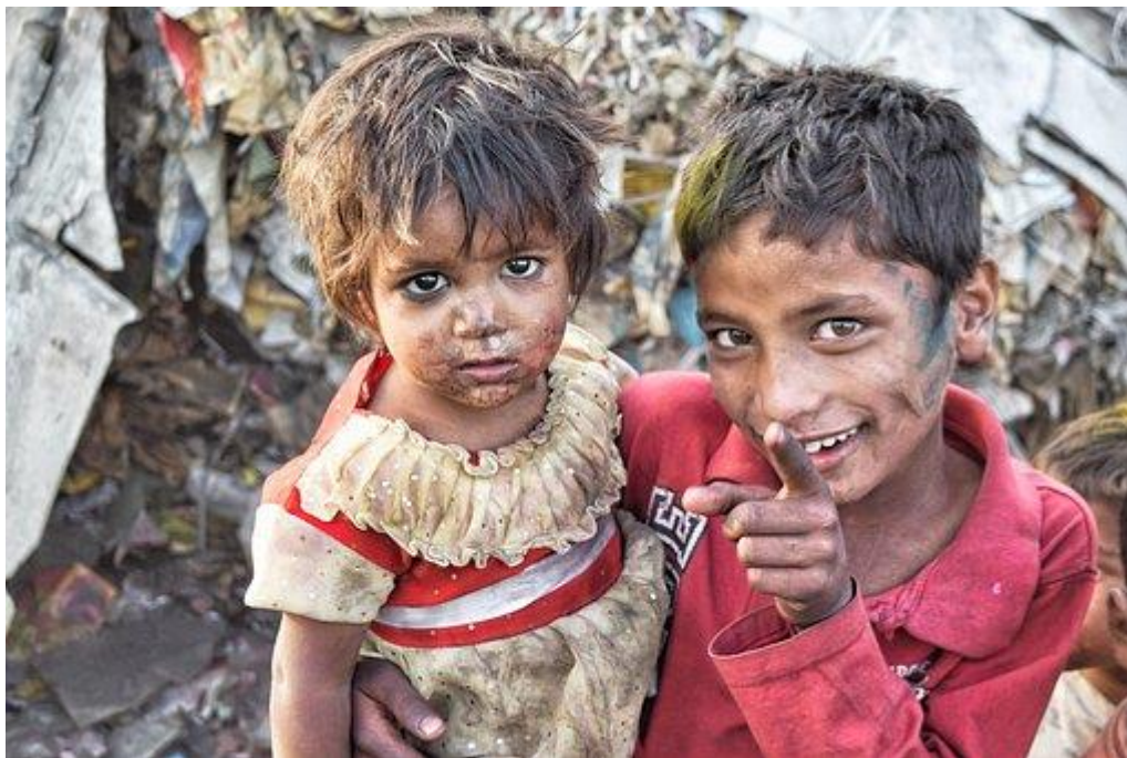
Imagen 1: niños en la pobreza.

También serán proyectadas las siguientes imágenes para generar debate y opinión.