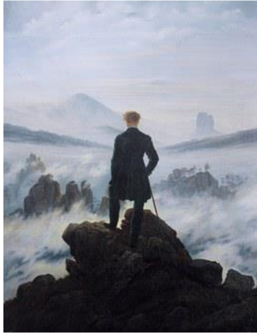
Imagen 4: “El caminante sobre el mar de nubes” Caspar David Friedrich, 1818