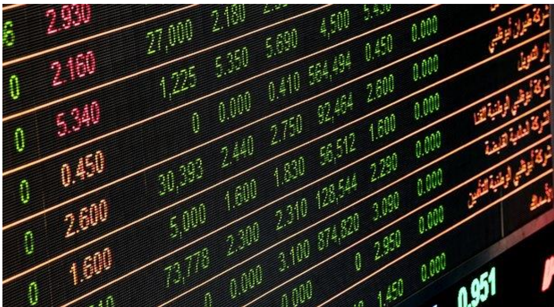
Imagen 3: ejemplo de globalización financiera.