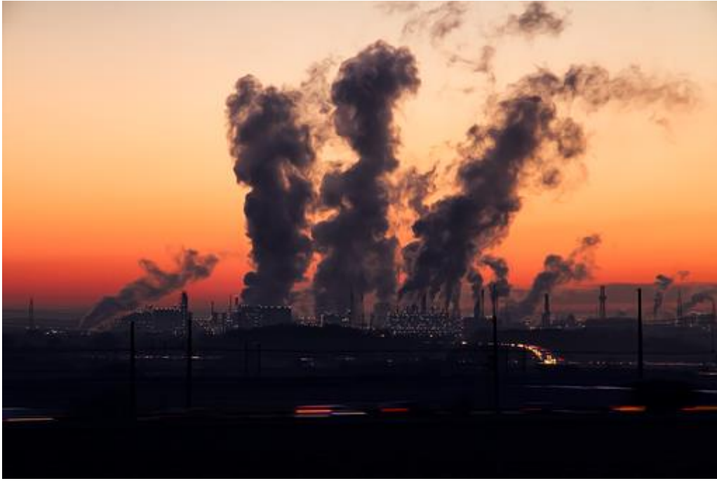
Imagen 2: contaminación atmosférica.