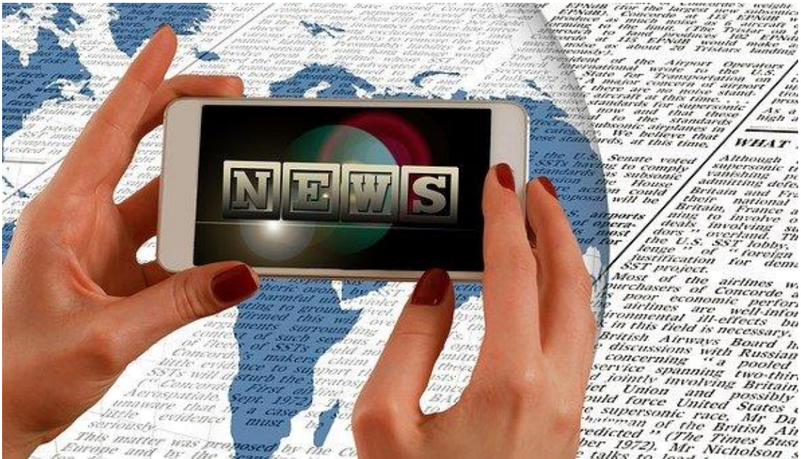
Imagen 4: desarrollo tecnológico.