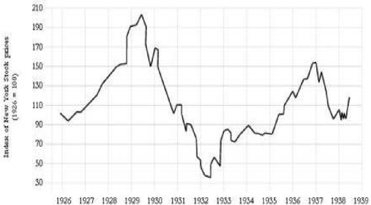
Gráfico 5. 1: Evolución del índice de la bolsa de New York, 1926-1939