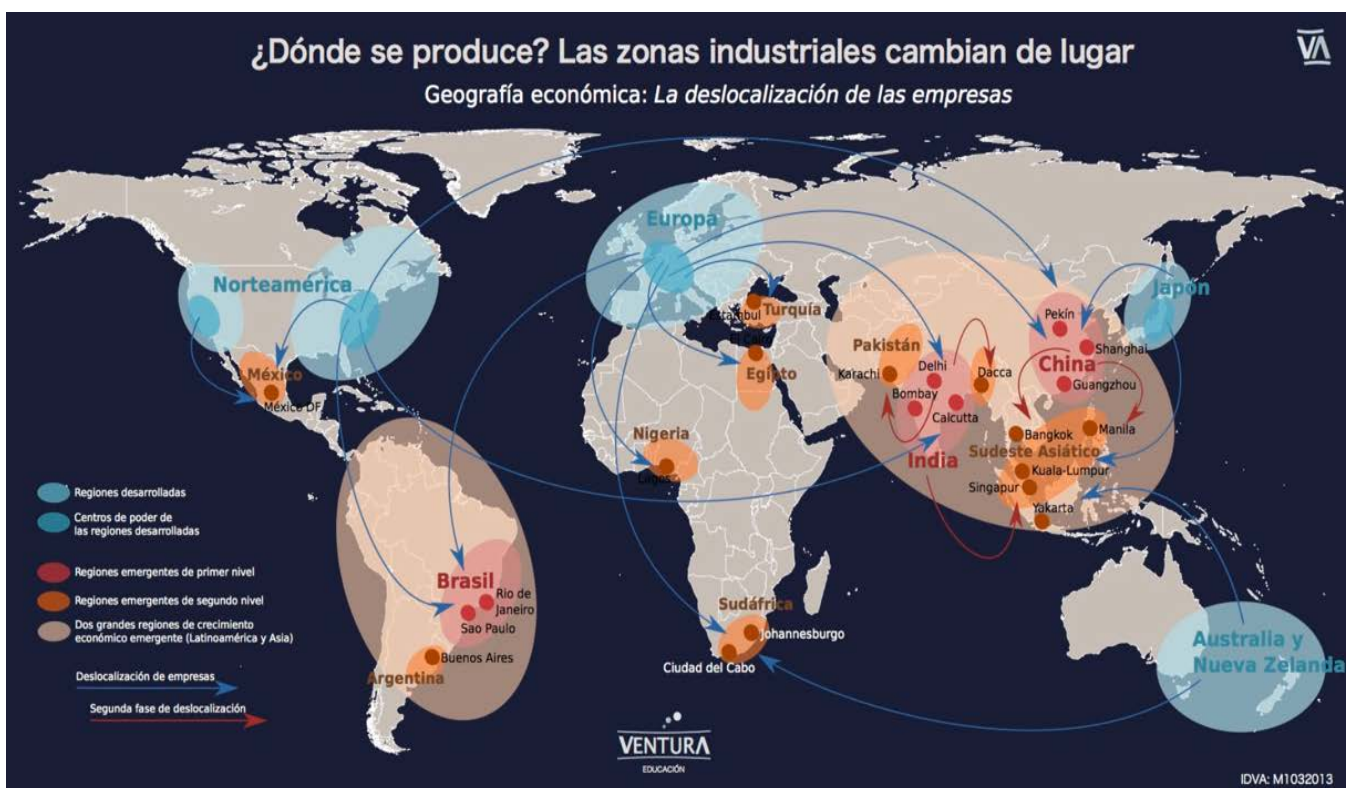
Ilustración 7.1: Deslocalización de las empresas.

En la Ilustración 7.1 podemos observar cómo se ha producido la deslocalización industrial desde países como Estados Unidos y Europa hacia países emergentes: