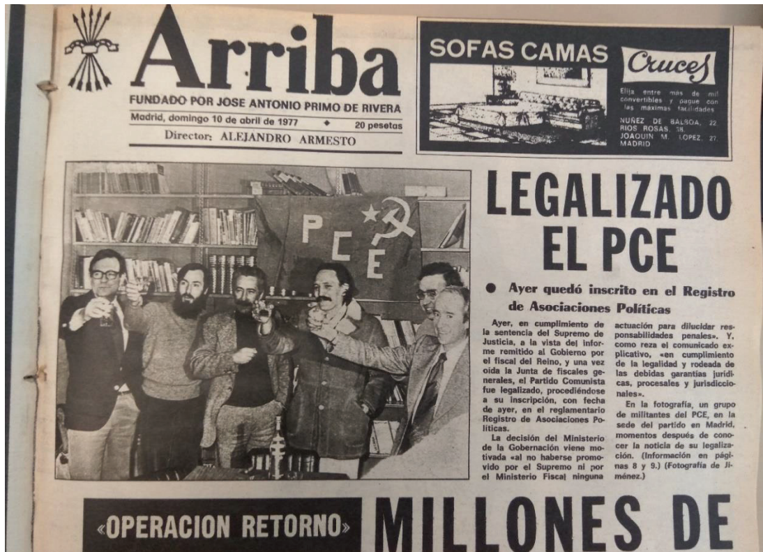
Portada del diario Arriba el domingo 10 de Abril del 1977, fecha de la legalización del Partido Comunista, extraída de la hemeroteca municipal de Madrid