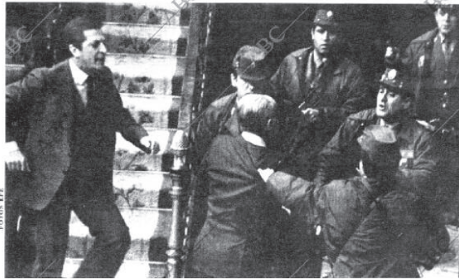
Portada del 23 de Febrero de 1981 del diario ABC