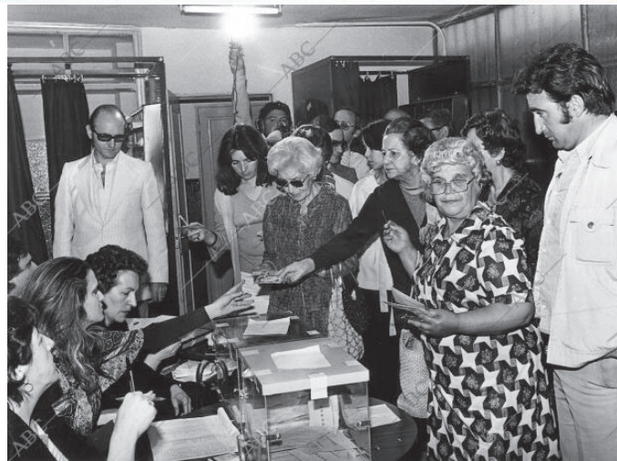
Fotografías extraídas del archivo fotográfico digital del diario ABC del día después de las elecciones de 1977.