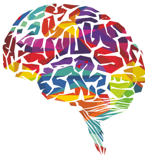
Figura 8: Puzzle final.