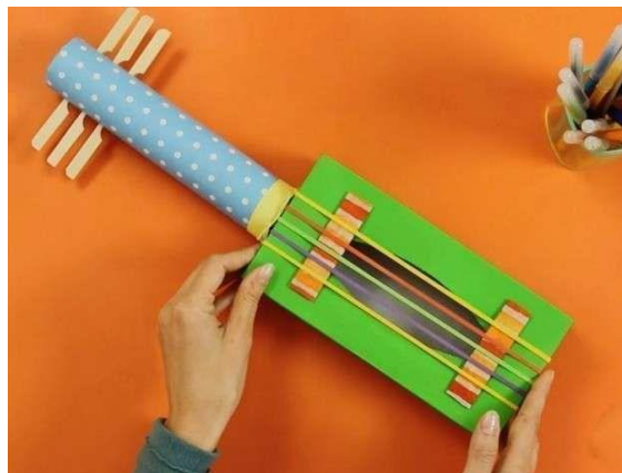
Figura 4: Guitarra casera