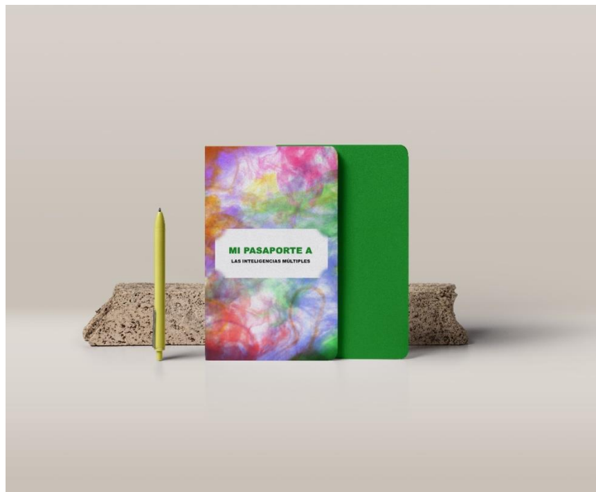
Figura 1: Genialporte

Como elemento motivador y transversal a todo el Proyecto, he creado un pasaporte que contiene 8 hojas, una por cada inteligencia. Cada hoja tendrá 5 casillas, siendo cada una referente a un día de la semana. El alumnado tendrá que sellar cada día al haber superado las actividades desarrolladas en esa jornada. Al finalizar la semana, todos los sellos que pusieron durante esa semana formarán una figura que simbolice algo referente a esa inteligencia. También al finalizar la semana recibirán una pieza de puzle que les servirá para completar un cuadro que se formará en la novena semana, pudiendo utilizarlo como elemento de repaso. Más detalles del pasaporte ( Anexo 1 )