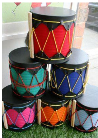
Figura 2: Tambores caseros