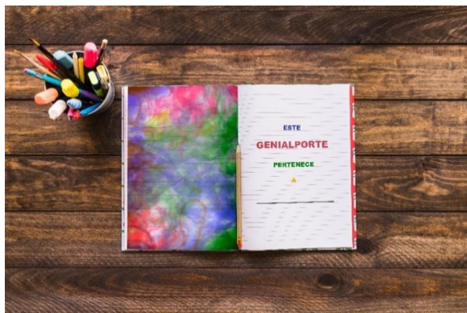
Figura 6: Contraportada del pasaporte