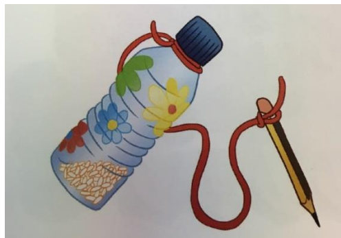
Figura 3: Maraca-rascador

Materiales necesarios para la elaboración de la guitarra: