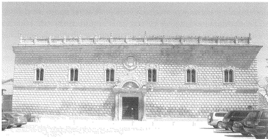
Fig. 2. Palacio de Cogolludo. Guadalajara.

su visita se encontraba Lalaing, quien calificó el edificio como «el más rico alojamiento de España». 28 A juzgar por la decoración de la chimenea del salón principal que se ha conservado, en la que se mixtifican las técnicas mudéjares con los motivos góticos, el interior no se apartaría mucho del aspecto que ofrecerían otras grandes mansiones contemporáneas y ligeramente posteriores. 29