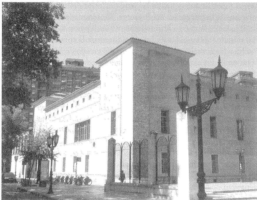
Fig. 3. Palacio del Conde de Benavente. Valladolid.

La contemplación del panorama circundante era una de las ventajas de su palacio que valoraba extraordinariamente ya el V Conde de Benavente. 58 Las torres que habían sido percibidas por los ciudadanos como un signo de prepotencia militar, no dejarían de tener una función de vigilancia, como requeriría una morada tan grande y perteneciente a uno de los nobles más importantes del reino, pero al mismo tiempo supusieron un punto de inflexión que inauguraba en la ciudad unos nuevos modos de entender la vida palaciega, que se venían formulando desde el siglo XV en Italia. 59 En unión de las galerías, las torres pasaron a ser un belvedere desde el que disfrutar de la visión del locus amoenus que ofrecían las riberas del Pisuerga y que fueron muy valoradas por la so-