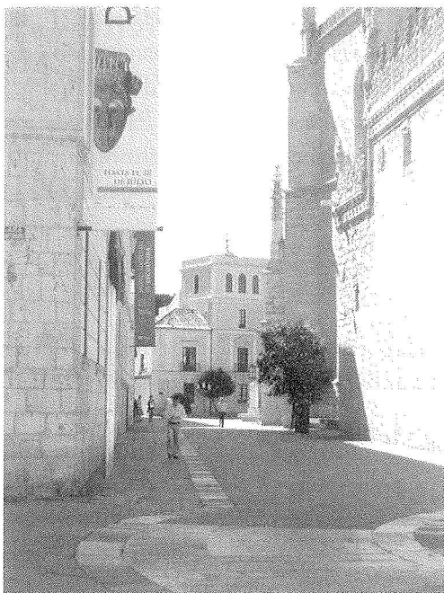
Fig. 5. Actual calle Cadenas de San Gregorio, con una de las torres del antiguo Palacio de Francisco de los Cobos al fondo.

por encima del caserío permitía una eficaz vigilancia del entorno. Carlos V ya había tenido, en su precipitada salida de Valladolid en 1520, una mala experiencia sobre la amenaza que para su seguridad podía suponer la hostilidad ciudadana. No en vano, la situación del palacio de Cobos ofrecía la ventaja de su proximidad a las puertas de San Benito el Viejo, al norte, y del Puente, 70 al noroeste, lo que facilitaría una rápida salida en caso necesario.