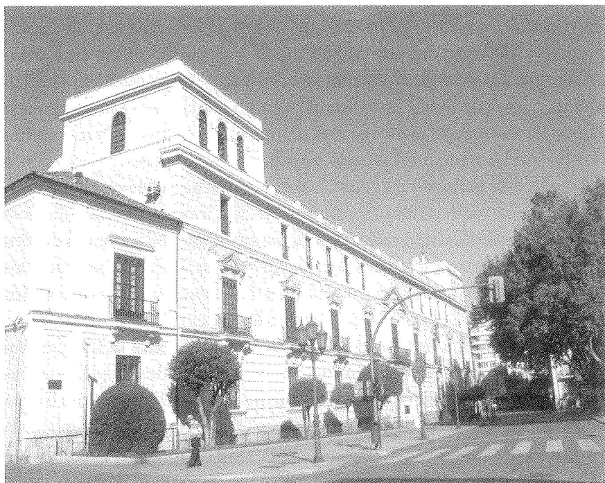
Fig. 4. Antiguo Palacio de Francisco de los Cobos. Valladolid.

La novedad en la composición de la fachada se presentaba como una alternativa a las viejas imágenes de casas fuertes de la nobleza medieval. El arquitecto Luis de Vega escribía a su cliente que su proyecto obedecía a «la mexor manera que nunca se ha visto en delantera de casa». A partir de la simetría y regularidad que ofrece la actual fachada del palacio y que, en nuestra opinión, mantienen en gran medida las originales, hemos propuesto que el arquitecto llevara a cabo aquí una temprana aplicación de los principios vitrubianos y que tuviera en cuenta el modelo que ofrecía el grabado que ilustraba la Ortographia o imagen frontal de un edificio civil en la edición del tratado de Vitrubio que publicó Fra Giocondo (Venecia, 1511). 69