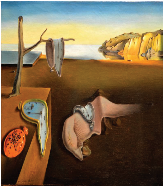
La persistencia de la Memoria (1931), Salvador Dalí