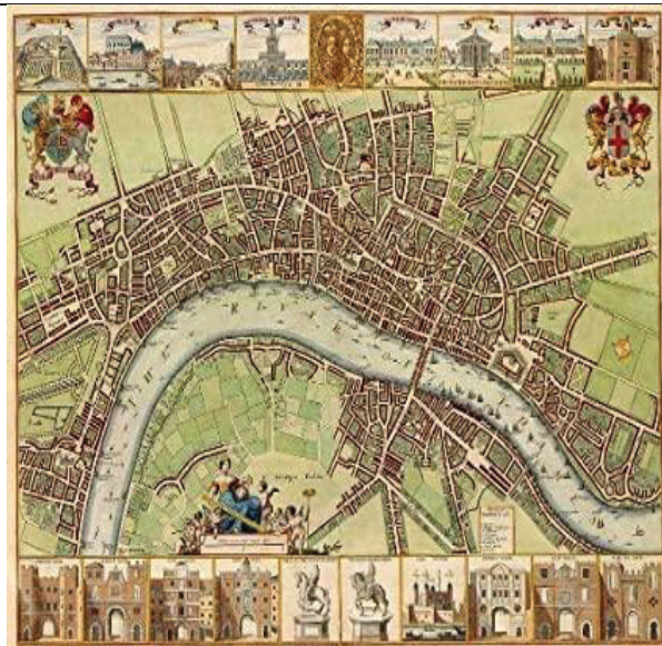
Mapa de Londres, 1680