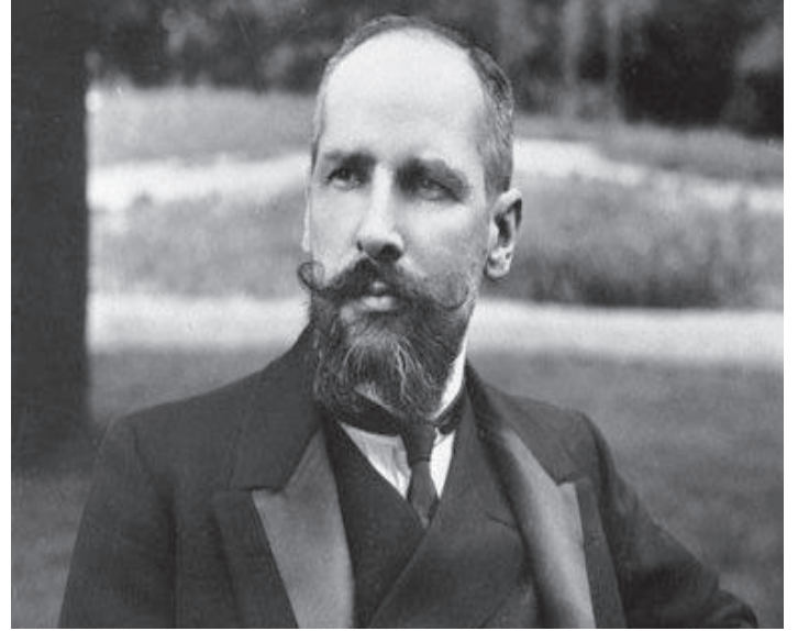
Imagen II. Fotografía de Stolypin.