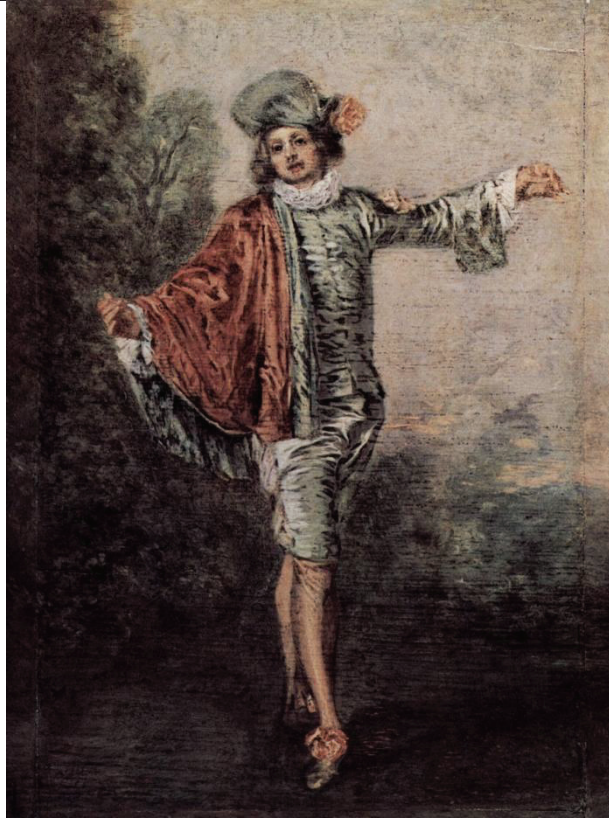
El indiferente (1717), Antoine Watteau