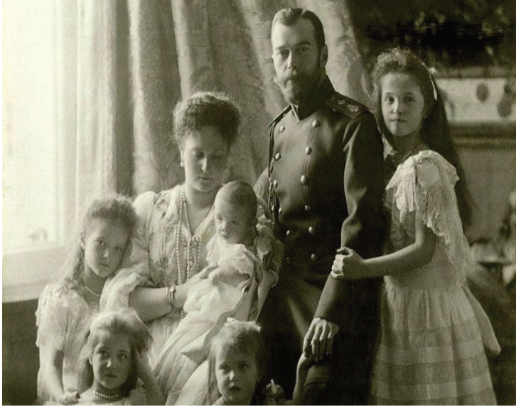
Imagen I. Fotografía de la familia de Nicolás II.