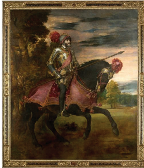
Carlos V en Mühlberg de Tiziano Vecellio.

https://www.museodelprado.es/coleccion?gclid=EAIaIQobChMIhcHx-6Gx6gIVCd-yCh3IYQZGEAAAYASADEgJkyPD_BwE