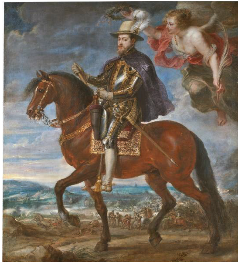
Felipe II a caballo de Pedro Pablo Rubens.