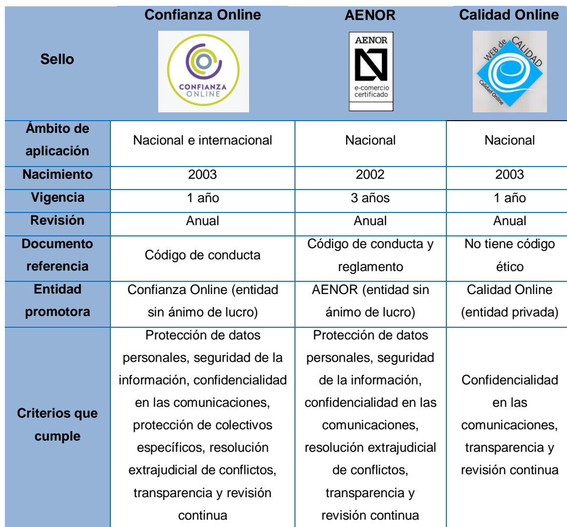
Tabla 6.1: Comparativa entre los sellos de confianza.