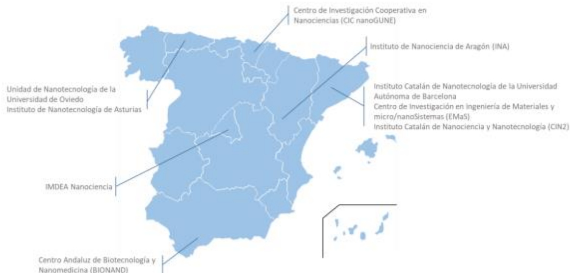
Ilustración 2.- Mapa de centros I+D dedicados a la investigación en Nanotecnología en España.

dedicados a la Nanotecnología en España son numerosos, con una distribución un tanto irregular a lo largo de nuestro país.