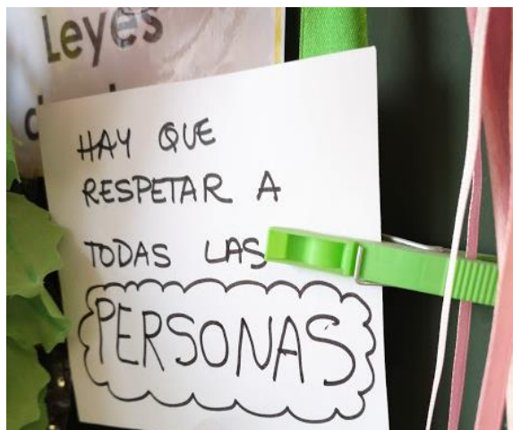
Figura 3. Ley creada por el grupo de 2 y 3 años. Elaboración propia