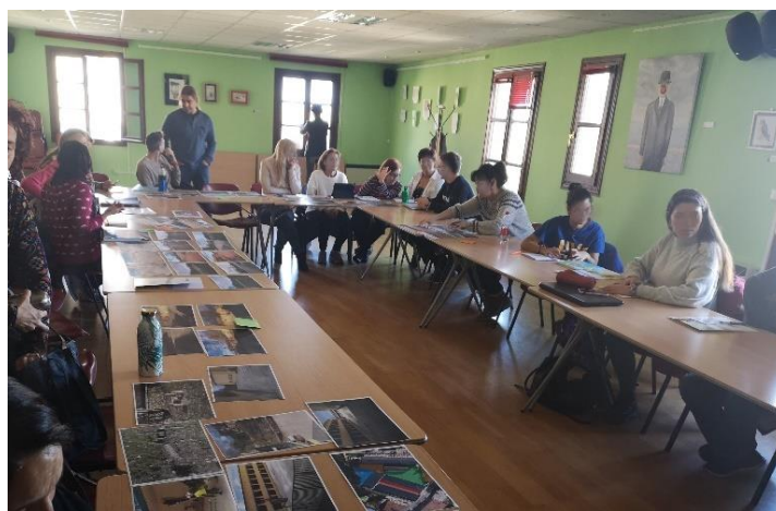
Figura 11. Jornada de formación.