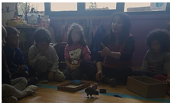
Figura 6. Crianza de pollitos en el aula. Elaboración propia.

Y es este optimismo crítico el que se impregna en las prácticas que observamos durante nuestra investigación, que muchas veces se alejaban de las lógicas de la escuela infantil tradicional. Por ejemplo, el dejar en manos de los niños y niñas la organización del aula, incluidas las normas sociales (por medio del parlamento); el eliminar rutinas típicas de las aulas de infantil para dar gran espacio al juego libre y al trabajo autogestionado (por medio, por ejemplo, de los planes de trabajo); el defender formas de evaluación que se basen en la observación cualitativa de los progresos de los niños y niñas (mediante un diario del docente y entrevistas a las familias) o el dar espacio a la participación de la comunidad en el aula —en la figura 6 se ve cómo, con la ayuda de una de las familias, el grupo de 4 y 5 años crió pollitos en una incubadora en el aula— y fuera de ella (trabajando colaborativamente con otros docentes o expertos locales).