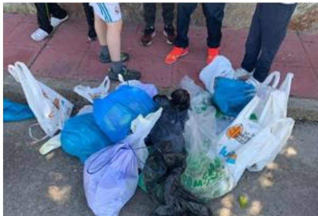
Figura 8. Jornada de reciclaje. Elaboración propia.

Estas actividades, así como la actitud abierta del equipo educativo y el equipo de liderazgo escolar, representado por Sote, eran muy valoradas por las familias: