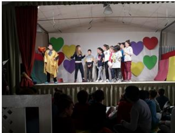
Figura 9. Obra teatral. Elaboración propia.

También eran muy conscientes de sus procesos de aprendizaje, cuidaban mucho de su escuela (sentían gran comodidad en ella) y se demostraban un gran afecto entre ellos y ellas: