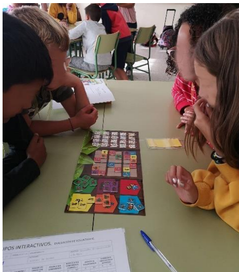
Figura 10. Grupos interactivos. Con la presencia de las familias, maestros en prácticas y la investigadora, niños y niñas aprenden a resolver problemas. Elaboración propia.

Los niños y niñas consideraban las actividades generales, como las tutorías entre pares, una de las formas de aprender a colaborar con otros más complejas, pero que generaban mayores retribuciones: