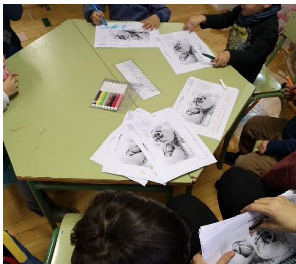
Figura 7. Niños y niñas aprendiendo sobre las tortugas. Elaboración propia.

como el ABP (aprendizaje basado en proyectos), que sigue una lógica lineal. Por ejemplo, el proyecto que realizaron los niños y niñas de 2 y 3 años sobre las tortugas comenzó para que los niños y niñas tuvieran una identidad de grupo y logaran cohesionarse en una lógica de tribu. Sin embargo, esa identidad, por medio de la curiosidad y el anhelo de aprender de los niños y niñas, se transformó en algo mayor. Y así, el grupo, sin una pauta o un orden de acciones determinado, estudió libros sobre tortugas, accedieron a documentales, hicieron arte y observaron al animal (el material que se muestra en la figura 7 es una ilustración realista de una tortuga, no una caricatura, y sirve para que los niños de 2 y 3 años aprendan sobre su anatomía):