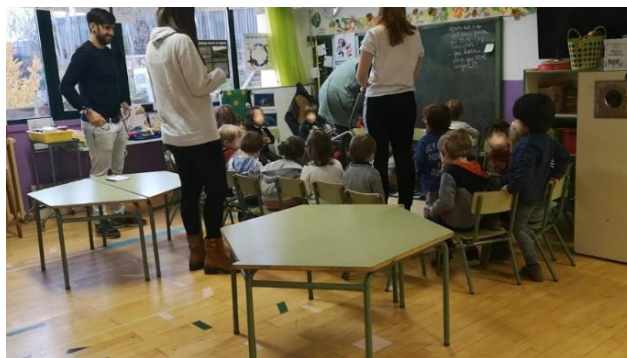
Figura 2. Asamblea de niños y niñas. Elaboración propia.

común de ideas con dos maestras en prácticas, un maestro visitante, una investigadora y la propia Rosa: