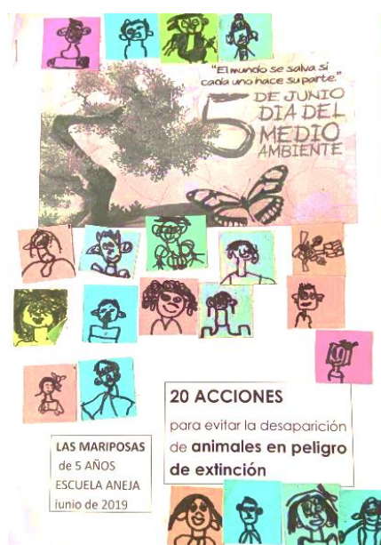
Figura 4. Revista sobre el proyecto de animales en peligro de extinción. Elaboración propia.