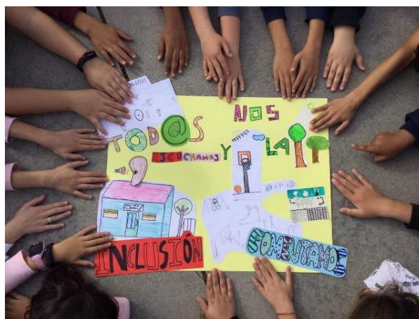
Figura 12. Cartel en defensa de la inclusión. Elaboración propia.

Dichas actividades eran potenciadas por un equipo docente, en su mayoría, dispuesto a colaborar por medio de actividades sociales en las que todo el pueblo podía participar: