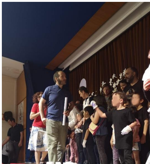
Figura 5. Conferencia de niños y niñas de 4 y 5 años. Elaboración propia