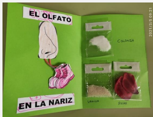
Ilustración 9. Cuaderno de aprendizaje. El olfato.