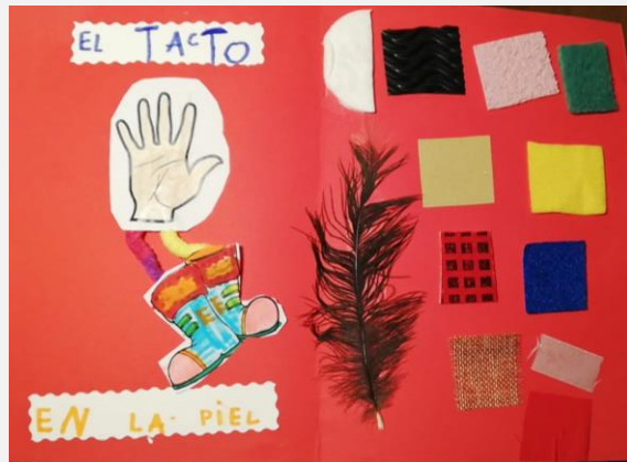
Ilustración 18. Cuaderno de aprendizaje. El tacto.