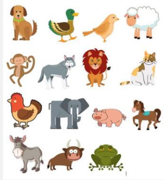
Ilustración 11. Animales elegidos para el juego.