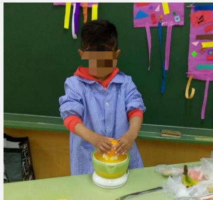
Ilustración 13. Alumno preparando el zumo.