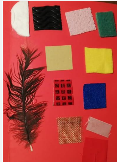
Ilustración 16. Materiales para la experimentación.