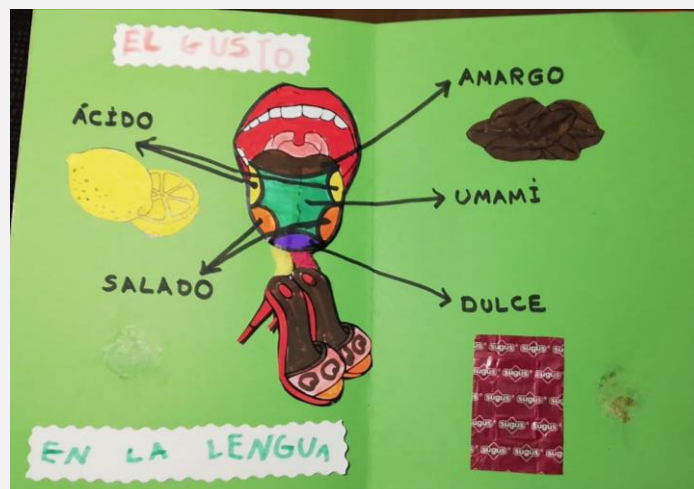
Ilustración 15. Cuaderno de aprendizaje. El gusto.