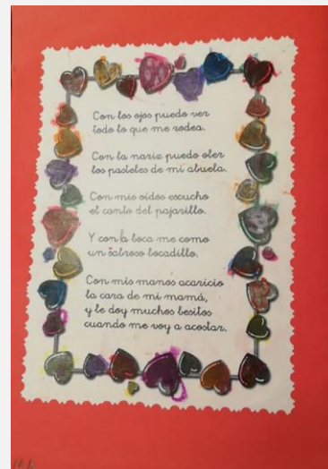
Ilustración 22. Cuaderno de aprendizaje. Contraportada.