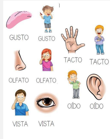
Ilustración 19. Tarjetas del memory.