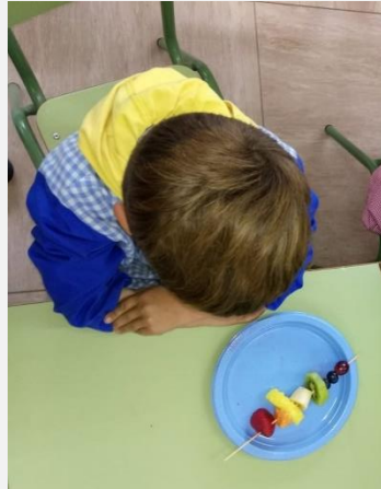
Ilustración 14. Alumno con su brocheta de fruta.