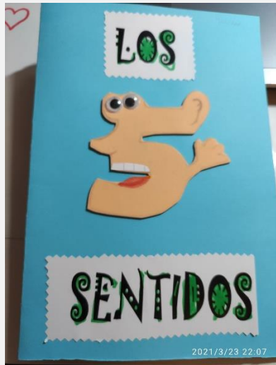
Ilustración 21. Cuaderno de aprendizaje. Portada.