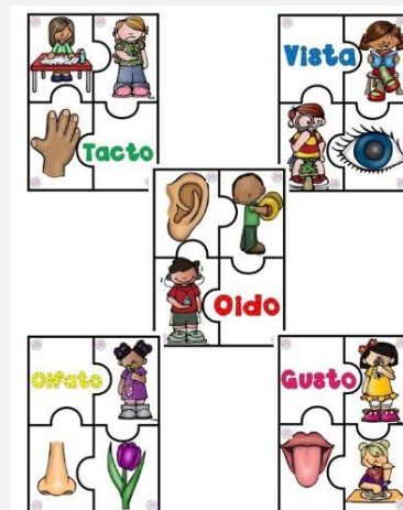
Ilustración 20. Puzles de los sentidos. (2020) [Imagen]