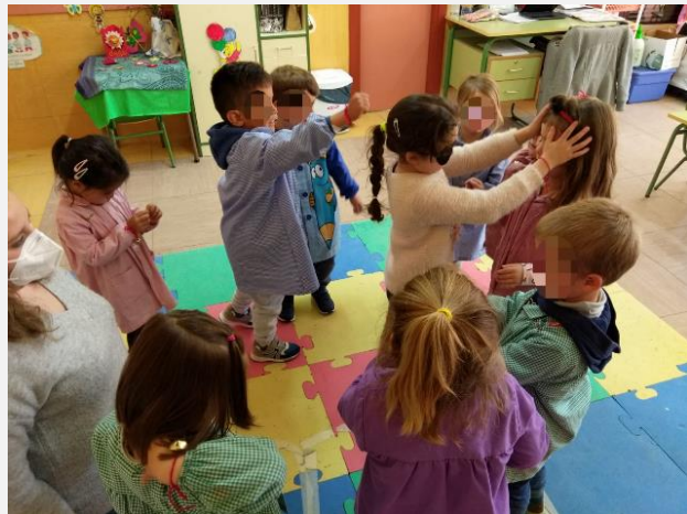
Ilustración 17. Adivina quién soy.