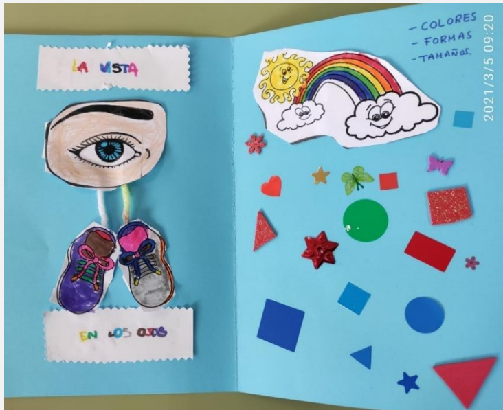
Ilustración 6. Cuaderno de aprendizaje. La vista.