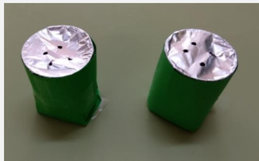
Ilustración 8. Memory olfatorio.