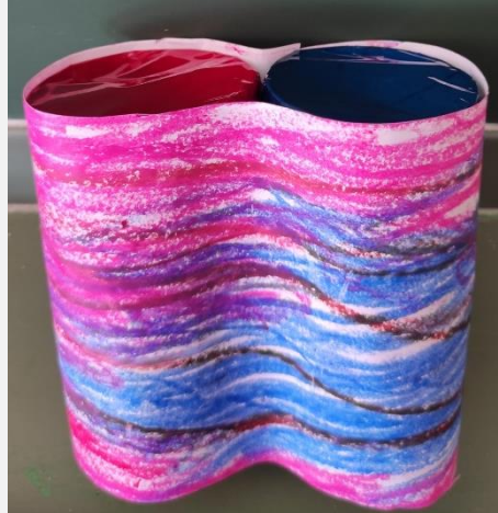
Ilustración 1. Prismáticos mágicos.