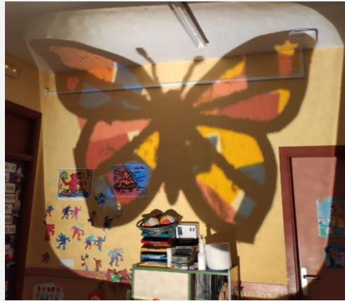
Ilustración 2. Proyección de la mariposa.