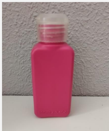
Ilustración 7. Botes olorosos.