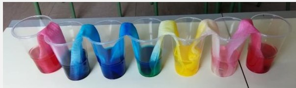
Ilustración 5. El arcoíris que viaja.