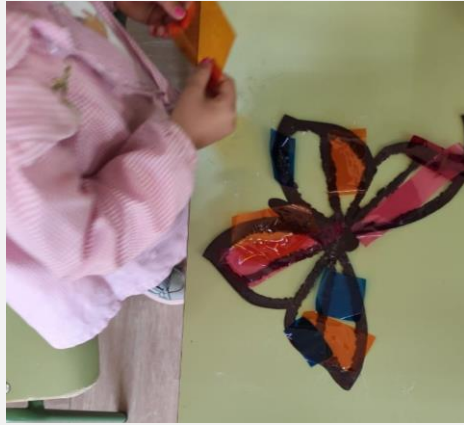
Ilustración 3. Proceso de elaboración de las mariposas.