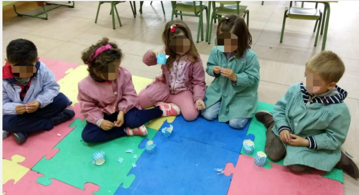
Ilustración 10. Abrimos las cajas sonoras.