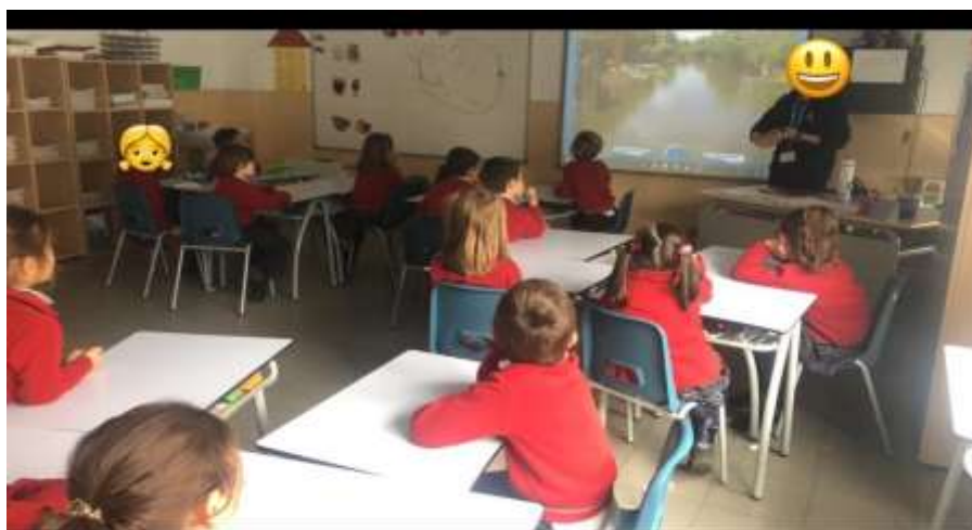
Figura 5. Distribución en la actividad cooperativa

Las cuatro cajas estarán compuestas de imágenes de animales, frutas/ bebidas, partes del cuerpo y colores.