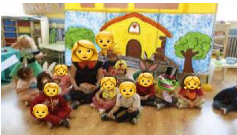
Figura 3. Representación teatral