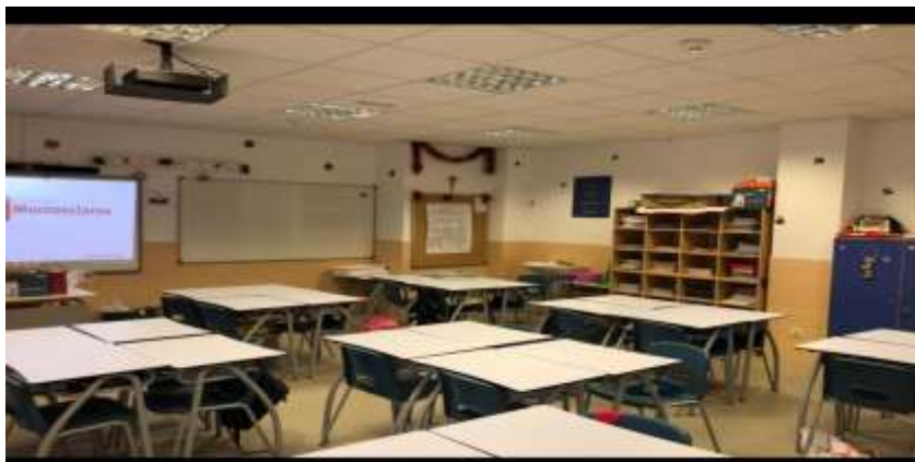
Figura 2. Distribución del aula