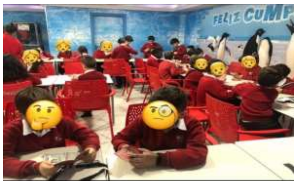
Figura 4. Simon says

En concreto, es el espíritu del mandato lo que importa, no las acciones; si se dice "Simón dice que saltes", el jugador debe saltar ya que ha dicho la frase bien. En este juego se trata de distinguir entre las órdenes válidas y no válidas, más que demostrar la capacidad física a cumplir. Simón tiene la función de lograr que cada participante quede eliminado lo antes posible, y cada participante debe tratar de permanecer 'dentro' todo lo posible. El último en mantenerse en el juego gana (aunque el juego no se realiza siempre hasta el final).