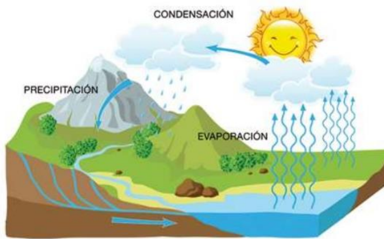
10.15. Anexo 15. Taller del ciclo del agua