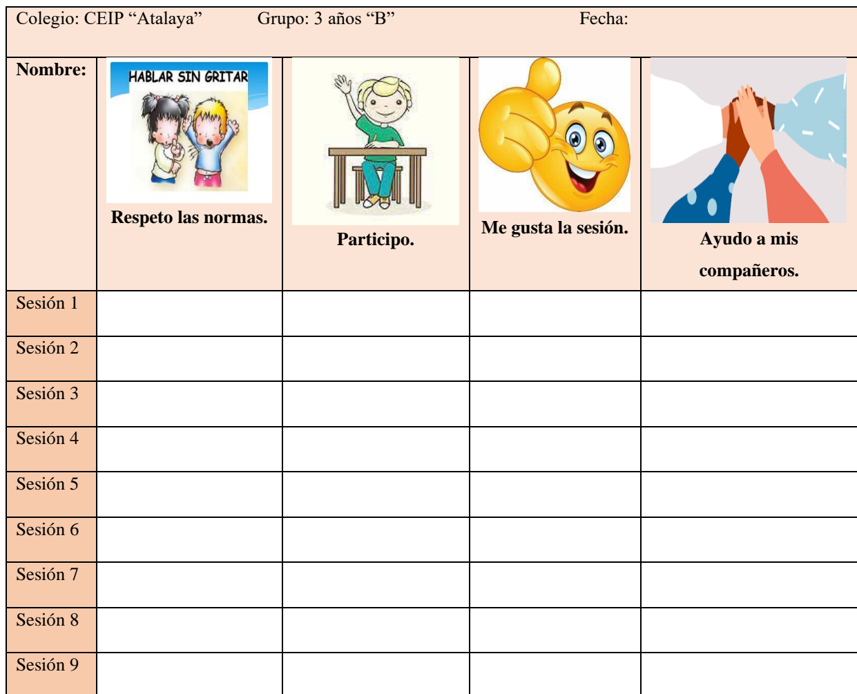
Tabla 11. Autoevaluación del alumnado mediante escala gráfica

-Escala gráfica para realizar la autoevaluación del alumnado a través del sistema del semáforo. Tendrá lugar al finalizar cada sesión mediante una cartulina individual (tabla 11). Cada alumno tendrá su propia cartulina y gomets de color verde (les ha gustado la actividad y que se ha realizado correctamente) y naranja (los aspectos que tienen que mejorar para las siguientes sesiones). En la cartulina aparecen cuatro ítems que se explicarán antes de que la rellenen. Antes de comenzar la primera sesión se explicará detalladamente lo que significa cada columna y cada gomets, para que sean los propios alumnos quiénes evalúen su aprendizaje al finalizar la sesión. Además, se recordará al finalizar la sesión que significa cada uno antes de que decidan cual tienen que poner. En ella se evalúan los aspectos actitudinales (comportamiento y respeto de normas) y si les ha gustado o no la sesión planteada.