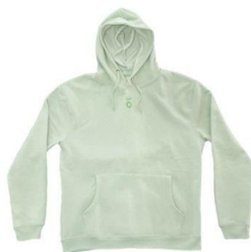
Sudadera Bambú €35,00