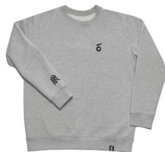
ŌKAMI'S ORIGINAL G €35,00