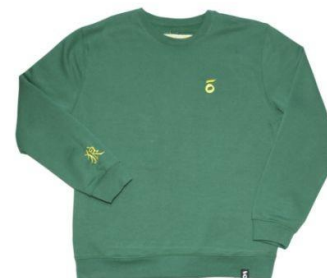
ŌKAMI'S ORIGINAL V €35,00