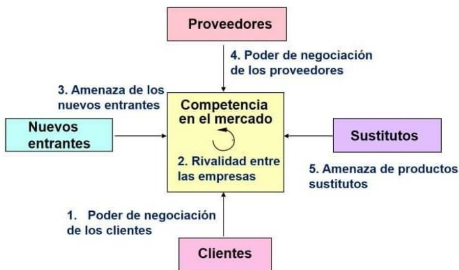
Ilustración 2. Las 5 Fuerzas de Porter.