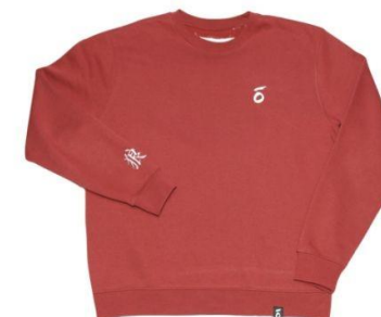
ŌKAMI'S ORIGINAL B €35,00