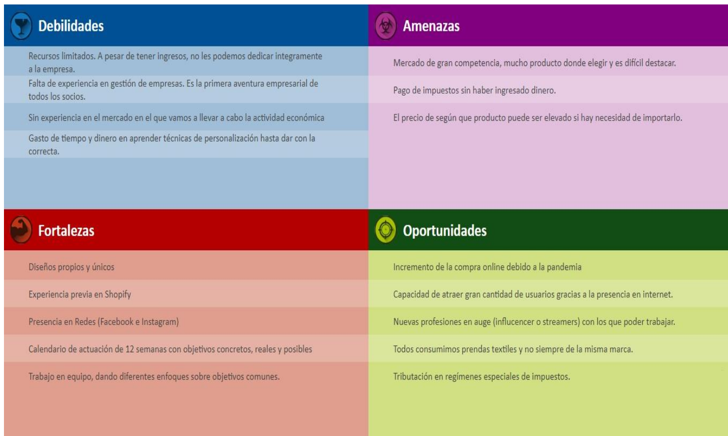
Ilustración 3. Matriz DAFO