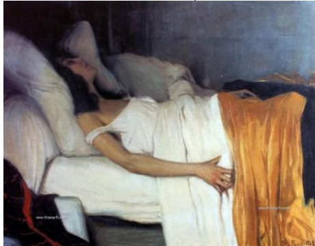
Imagen 4. La Morfina (Santiago Rusiñol, 1894)

Octavia llevará a cabo ambas posturas con sus manos; en primer lugar, “cruza las manos con una súplica dolorida” que, de nuevo, la hace parecer una virgen, “que parece transparentar la luz” (Valle-Inclán, 2017: 63); esa actitud doliente y suplicante se emparenta con la Virgen de la Soledad, fundamentalmente en esas lágrimas constantes, unas lágrimas cristalizadas y una mirada hacia el cielo, en un deseo de ascensión y expiación. Un tercer movimiento sería ese desquitar sus manos de su cara, descubriendo “el rostro frío y blanco, un rostro de estatua 13 ” (Valle-Inclán, 2017: 63), o “los párpados de cera” (Valle-Inclán, 2017: 76). En esta línea, no solo encontraremos similitudes con la tradición mariana de las procesiones sevillanas, sino también con otra de las pinturas representantes del decadentismo finisecular hispánico: La Morfina (1894) de Santiago Rusiñol –imagen 4–, donde “el dolor físico [...] altera la apariencia del cuerpo. [...] una dama joven que yace sobre un lecho blanco adormilada por la engañosa serenidad que da la morfina, pero que al mostrar al espectador una mano que agarra fuertemente la sábana deja patente el sufrimiento” (Villaverde Solar, 2010: 26).