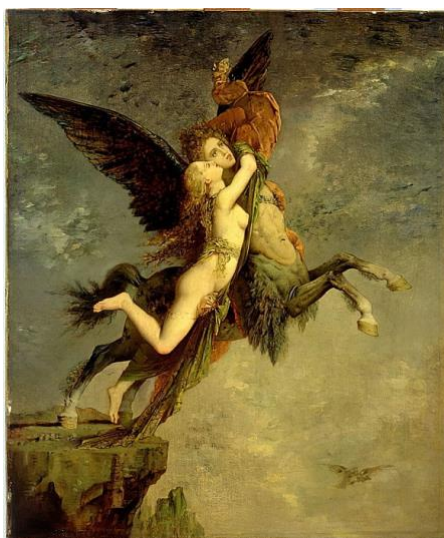
Imagen 10. La Quimera (Gustave Moreau, 1867)

representada por su joven amante, son los movimientos de las manos. También se ha comprobado cómo sus pálidos dedos se enredan en los cabellos rizados y rubios del efebo, a quien podríamos describir en la línea de los querubines de las pinturas renacentistas. Así, entre “el temblor de lo efímero [y] el olor de la decadencia” (Balakian, 1969: 85), el joven mantiene una postura agónica en esa alcoba mortuoria, el nicho de la muerta. Se recupera el suspiro romántico en los amantes, silencios exasperantes que ralentizan el terrible momento del último aliento; en esta decrepitud espacio-temporal, ambos intentan una última unión, y sus abrazos parecen enlazarse tan armoniosamente como se presentan los personajes del cuadro de La Quimera (1867) de Gustave Moreau –imagen 10–.