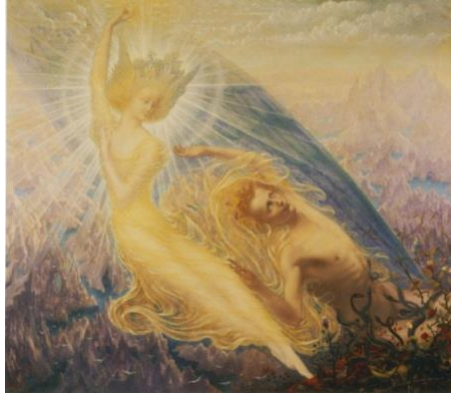
Imagen 11. El ángel del esplendor (Jean Delville, 1894).

enferma con ánimo de perdón divino podría vincularse a El ángel del esplendor (1894) de Jean Delville –imagen 11–.