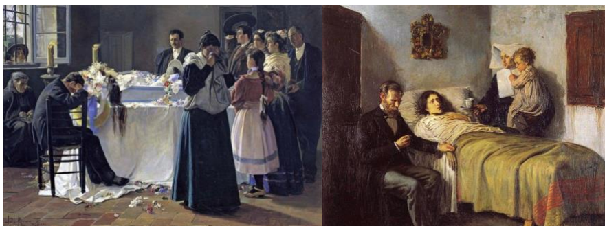
Imágenes 12 y 13. Mira qué bonita era (Julio Romero de Torres, 1895) y Ciencia y caridad (Pablo Picasso, 1895).

Finalmente, una vez ha fallecido Octavia, la tristeza que inunda la estancia podría representarse en Mira qué bonita era (1895) de Julio Romero de Torres –imagen 12–. Aparecerá por primera vez el marido de la fallecida, un vejete que podríamos instalar en la tradición del cornudo aparentemente consentidor íntegro, en la línea de Víctor Quintanar, consciente probablemente de haberse sumido en un matrimonio yermo, tan yermo como toda la simbología analizada. Incluso mayor similitud encontraríamos con Ciencia y caridad (1895) de Pablo Picasso –imagen 13–, donde podríamos hilar el triunvirato del cuadro (hombre-monja-niño) con el del drama (marido, Hermana de la Caridad e hija).