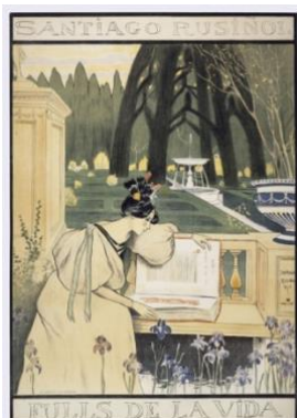
Imagen 1. Fulls de la vida (Santiago Rusiñol, 1898)

El silencio va unido a otro elemento importante para esta ambientación: el reloj 5 . Los sonidos del reloj o el tañido de las campanas 6 también serán característicos en esta literatura de fin de siglo, heredados por su parte del Romanticismo. En primer lugar, debemos recordar lo que supone el tiempo a raíz del fin del romanticismo y la entrada prematura en la llamada poética de la modernidad. Los artistas y autores insertados en lo moderno conciben el tiempo como bien lo explica Baudelaire en El pintor de la vida moderna : la temporalidad en la modernidad supone apreciar el instante, lo fugitivo, efímero o evanescente, pues en el instante se concibe la eternidad; por esta razón, la consciencia del paso del tiempo a través del sonido del reloj es tan significativa en estos autores. Unido a ello, veremos que la enfermedad en los poetas decadentes se transmite con la mayor dilación posible: la muerte de la protagonista se ralentiza de una forma exasperante, culminando con el último suspiro, no sin antes haberse producido una lentificación agónica, tanto para la enferma como para sus espectadores, ya sean el resto de personajes o el público. El tiempo, en definitiva, acompaña al ambiente de ciudad muerta de la casa: todo se halla paralizado, putrefacto, en un instante vaporoso.