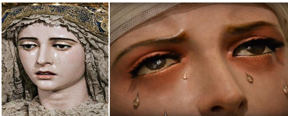
Imágenes 7 y 8. Nuestra Señora de la Concepción de Sevilla y la Virgen de la Soledad

Por último, si ya habíamos visto la languidez de Octavia en la vidriera como si de una virgen de una catedral gótica se tratara, avanzando hacia el final de la trama asistimos a una mujer “echada sobre el canapé de su tocador” (Valle-Inclán, 2017: 69) con temperamento alicaído, postrero, que recordaría de nuevo a las portadas de Pèl & Ploma . El tocador es otro de los elementos recurrentes de toda la literatura decimonónica; sobre este elemento del hogar, Max Nordau establece una sintonía con la imaginiería sagrada en su obra canónica Degeneración . Como era recurrente en el decadentismo, los autores simbolistas pervierten lo litúrgico.