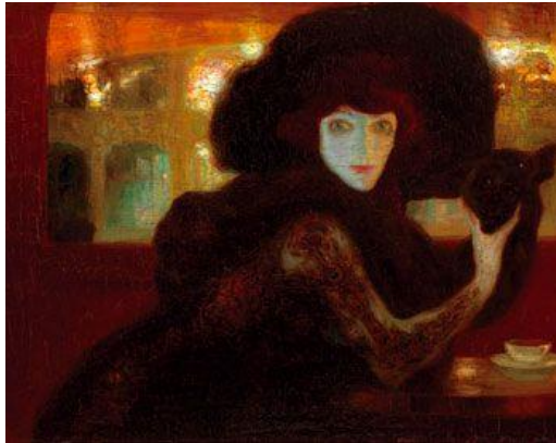
Imagen 6. La morfinómana (Anglada Camarasa, 1902)

Su palidez estará contrarrestada con otros dos colores faciales: el negro, en unos ojos con “la sombra mortal de las ojeras” (Valle-Inclán, 2017: 59), hundidos y satánicamente oscurecidos por esas ojeras que recuerdan a La morfinómana (1902) de Anglada Camarasa en su angustia y su toque perverso y macabro –imagen 6–; y el rojo de esa “pálida rosa de su boca” (Valle-Inclán, 2017: 35), en contraposición a su opacidad ojerosa y palidez facial: