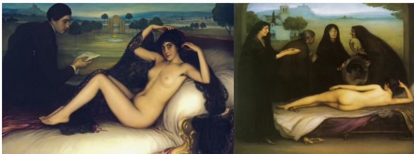
Imágenes 2 y 3. La Venus de poesía y El pecado (Julio Romero de Torres, 1913)

Un segundo cuadro en el que presenciamos similitudes con la acotación valleinclanésca es el fondo paisajístico de La Venus de poesía (1913) de Julio Romero de Torres –imagen 2–, así como cuadros similares del artista como El pecado (1913) –imagen 3–. En ambos, el fondo es austero, solitario, lúgubre, el único elemento arquitectónico es una fuente manando agua, y una construcción arquitectónica y una iglesia, respectivamente. En ambos, el color aparenta estar difuminado: un cromatismo melancólico, decadente, que concede sensación de abulia, spleen baudelairiano; en definitiva, colores propios del modernismo finisecular: el color oro para la fuente y el azul, verde y marrón para la composición del paisaje natural. Son representaciones de tintes alicaídos: “la melancolía-dulzura pasa a convertirse en éxtasis-turbación y en un camino para ahondar en el universo de lo oscuro (el negro abismo de la nada) y lo temible (la revelación de los tormentos inconscientes)” (Sáez, 2004: 45).