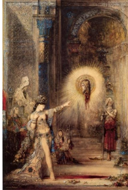
Imagen 9. Salomé (Gustave Moreau 1874-1876)

Aún queda más explícita esta sacralización de la enferma cuando las “sedas de un áureo reflejo” unido al “aroma del incienso dan aspecto de reliquia al cuerpo exánime de la enferma” (Valle-Inclán, 2017: 69); realmente, no es un aspecto novedoso del Simbolismo si recordamos que el cordón de Melibea en la Celestina 14 ya torna esta simbología de profanación de elementos sacros. De hecho, ante este cuadro se dice que “parece una de esas santas que en los remotos santuarios duermen bajo el retablo dorado en urnas de cristal 15 ” (Valle-Inclán, 2017: 69). Ni los términos ni el retablo pueden ser más prototípicamente modernistas 16 . De la misma forma, esa languidez y actitud aletargada podrían ejemplificarse en la volubilidad de la Salomé (1874-1876) de Gustave Moreau, donde la figura dirige su agónica mirada hacia una posición elevada y sus pies apenas tocan la estancia neoclásica en que se ambienta el cuadro –imagen 9–.