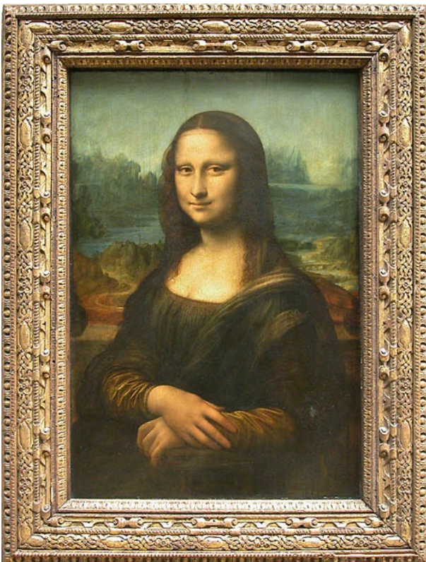
Retrato de Lisa Gherardini, esposa de Francesco del Giocondo , Leonardo da Vinci, entre 1502 y 1506. Museo del Louvre, París.

Cuando el 22 de agosto de 1911 el personal del Museo del Louvre de París fue consciente de la desaparición de La Gioconda , robada el día antes, no podía, sin duda, imaginar la repercusión que el suceso tendría en la prensa internacional y, aún más, la fama que alcanzaría una obra que desde aquel momento se convirtió en un auténtico icono artístico. Hoy, a punto de cumplirse los cien años del suceso, la obra del pintor italiano contempla tras su cristal de seguridad, cómo sigue siendo una de las obras más famosas, reproducida y rodeada de misterio de la Historia del Arte.