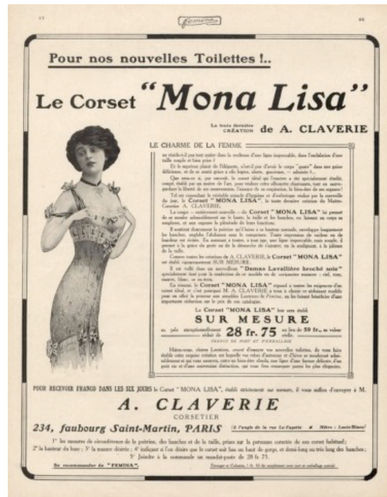
Anuncio del “Corset Mona Lisa”, París, 1911

Efectivamente, en 1912 se vendía un frasco de prueba de Eau Gioconda , “lo mejor para la belleza”, por tres pesetas 91 ; y en 1914, una vez que el ladrón Peruggia había sido