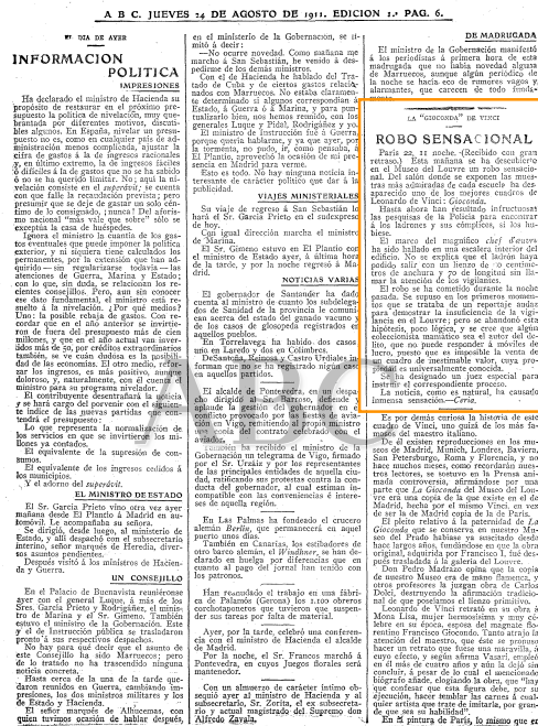
Robo sensacional. Página 6 del diario ABC del jueves 24 de agosto de 1911, dando cuenta del robo de La Gioconda

¿Cómo recibió y trató el asunto del robo de la obra de Leonardo la prensa española? Una vez se conoció lo ocurrido en París, la prensa internacional procedió a dar cuenta de los pormenores del robo, ofreciéndose una cobertura continuada desde la desaparición del cuadro hasta su regreso a París, pasando por el proceso judicial contra el ladrón Vincenzo Peruggia. Los periódicos españoles no fueron menos. De norte a sur, periódicos nacionales y locales, conservadores y liberales, semanarios ilustrados y revistas satíricas..., todo el medio periodístico prestó atención al robo de La Gioconda , haciendo partícipe a la población no solo del suceso, sino también de la propia obra y su historia, acercando así algo que pertenecía al