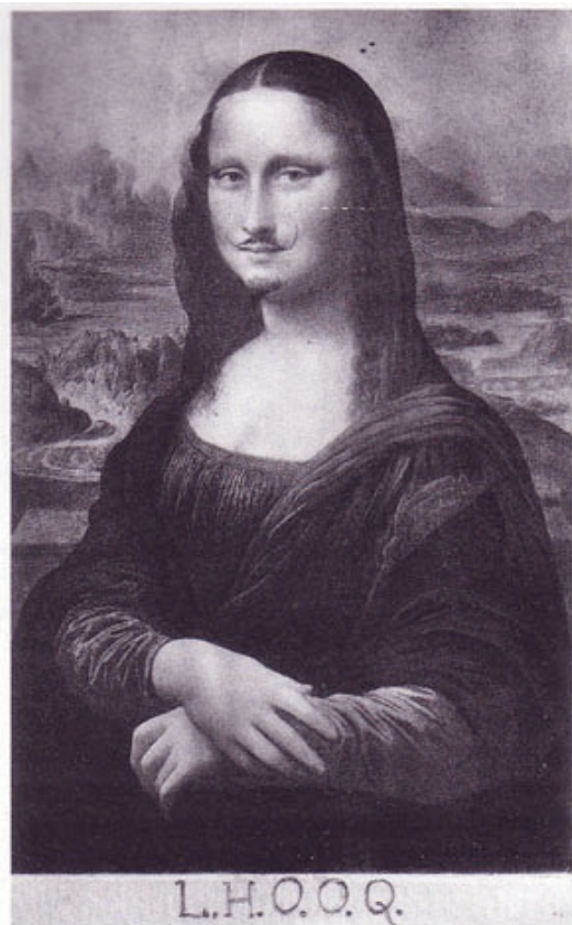
L.H.O.O.Q. , Marcel Duchamp, 1919. Colección Privada, en depósito en el Museo de Arte Moderno, Centre Georges Pompidou , París.

Si el 29 de agosto de 1911 la masa corría apresurada por el Louvre para ver el vacío dejado por La Gioconda 110 , hoy ocurre lo mismo pero lo hacen para amontonarse en torno a la enigmática mirada. Casi nadie atiende a los otros cuadros, casi nadie presta atención a los demás tesoros del museo parisino, ni siquiera a otras obras de Leonardo o de otros maestros de su talla. Es ella la que atrae a los visitantes. Ella la que ha superado al autor y las cuestiones artísticas. Poco importan estas. Los espectadores cruzan su mirada con Lisa y ya pueden abandonar tranquilos el museo, hechizados por la enigmática figura que un día de 1911 puso en vilo a medio mundo.