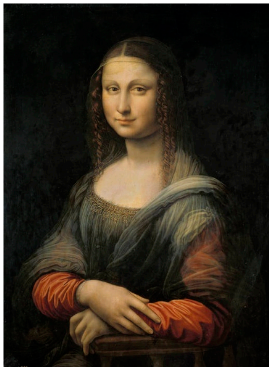
Mona Lisa o La Gioconda , copia antigua de Leonardo da Vinci, primer cuarto del siglo XVI. Madrid, Museo del Prado.

En sus Vidas , publicadas en 1550 6 , Giorgio Vasari señala como Leonardo: “Hizo para Francesco del Giocondo el retrato de su mujer Mona Lisa y, a pesar de dedicarle los esfuerzos de cuatro años, lo dejó inacabado. Esta obra la tiene hoy el rey Francisco de Francia en Fontainebleau” 7 . Continúa el biógrafo indicando cómo la obra es de un gran verismo, tanto que, en la garganta “se veía latir el pulso” si se mira con atención. Recoge también el florentino la anécdota de cómo, mientras Leonardo la retrataba, la hermosa Lisa Gherardini se encontraba rodeada de músicos y bufones que le hacían estar alegre