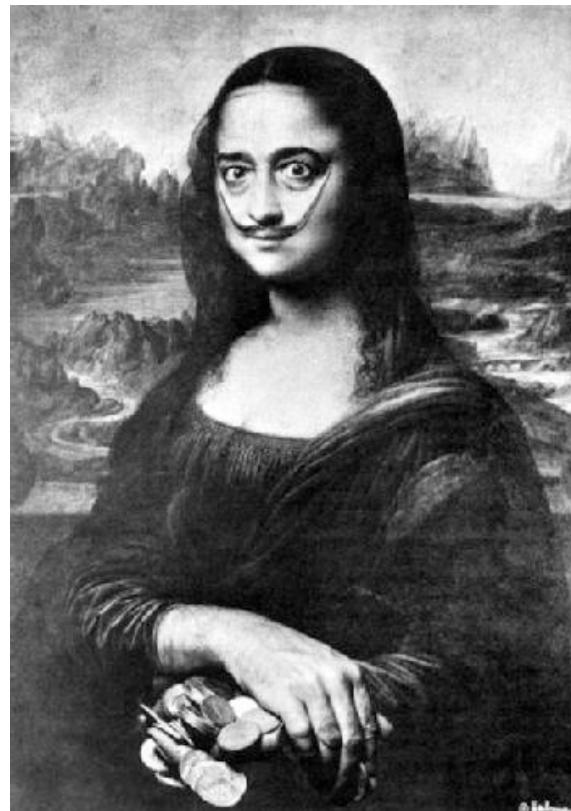
La Gioconda –Autorretrato como Mona Lisa , Salvador Dalí y P. Halsman (1954). Colección Halsman.