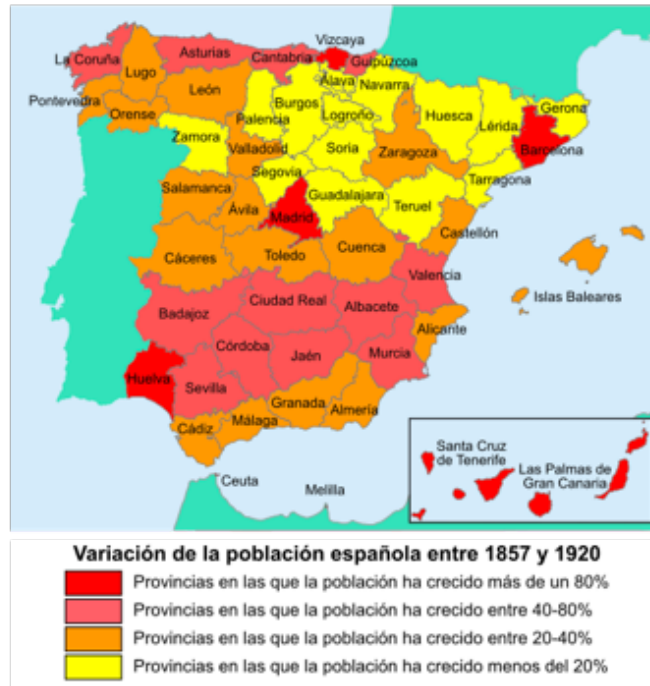
Imagen 1. Mapa de la población española entre 1857 y 1920.

A mediados del siglo XX, España se empieza a recuperar de la Guerra Civil Española, favoreció un gran crecimiento económico en las grandes urbes, y por lo tanto una mayor pérdida de población en el medio rural. Esta pérdida de población dio lugar a que los pueblos se vaciaran, y cuanto más se vaciaban menos facilidades y servicios ofrecían a sus habitantes, entre ellos, servicios esenciales como la educación o la sanidad. El éxodo hacia las grandes urbes ha continuado en detrimento de las zonas rurales que han ido perdiendo de forma paulatina su población. Éste es un problema que se ha seguido manteniendo con el tiempo, las ciudades cada vez con mas población, oportunidades, servicios; y los pueblos, por el contrario, cada vez con menos.