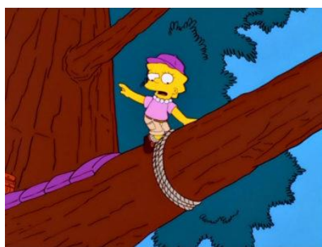
Imagen 32: Lisa acampano en un árbol para que no lo talen.

Hay varios episodios en los que se puede ver cómo la población de Springfield abusa de los productos de origen animal, habiendo siempre tras ellos una crítica a la sociedad americana. El más destacado es “Lisa, la ecologista” (temporada 12 episodio 4) donde Lisa se enamora de un joven ecologista que le hace profundizarse más en el mundo de los derechos de los animales y en el cuidado del planeta. Para impresionarlo, la preadolescente se ofrece voluntaria para acampar encima del árbol más viejo del pueblo, ya que el tejano rico quiere talarlo.