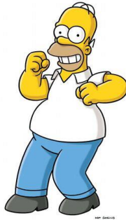
Imagen 18: Homer Simpson.

Es el padre de la familia. Se caracteriza por su bajo coeficiente intelectual, su carácter es impulsivo y despreocupado. Se podría decir que es el personaje principal ya que es el único que sale en todos los episodios.