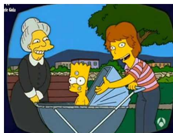
Imagen 27: Anuncio Bart Simpson de bebé.

En “Bartir de cero” (temporada 14 episodio 11) Bart se independiza legalmente de sus padres. La causa de la emancipación es que el chico hizo un anuncio de televisión cuando era un bebé y su padre en vez de guardar el dinero que le dieron por la promoción se lo gastó. En el transcurso del capítulo se puede ver como Homer echa de menos a su hijo, pero su orgullo no le permite pedirle perdón para que regrese a casa. Desesperado pide ayuda a un famoso skater, para sorprender a su hijo y convencerle de que vuelva al hogar.