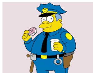
Imagen 43: Wiggum, el jefe de policía.

Wiggum es el jefe de policía de la ciudad, el hombre consiguió su placa porque su predecesor estaba cansado de su trabajo y se la dio por casualidad. En “Papá tiene una placa nueva” (temporada 13 episodio 22) se le ve como una persona incompetente que juega con su pistola y que siempre que está de guardia está comiendo y apenas resuelve casos. Su gran ayuda son sus dos compañeros, Eddie y Lou, que son más inteligentes y parecen estar más capacitados para el puesto.