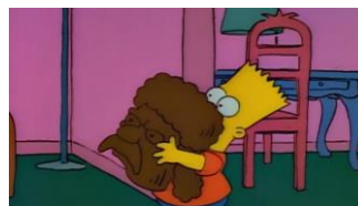
Imagen 29: Bart con la cabeza de la estatua de Jedediah Sprienfield.

Esta acción conmociona a toda la ciudad y Bart, angustiado por su fechoría, se la confiesa a sus padres. Homer y Marge, preocupados por la situación, se lo hacen saber a los ciudadanos, provocando la rabia de estos hacia el niño, pero Bart termina pidiendo disculpas delante de todos y devolviendo la cabeza a la estatua.