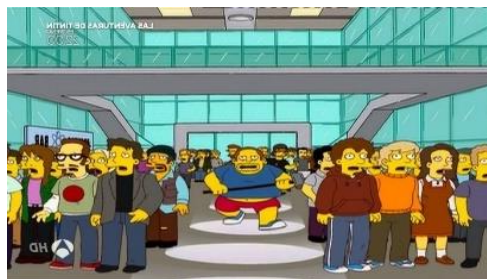
Imagen 9: Parodia anuncio Apple.

En este capítulo podemos ver la lectura paródica que los guionistas hacen sobre la marca de tecnología. Por un lado, se ironiza sobre el precio que tiene en general la empresa de tecnología ya que Lisa está muy ilusionada con tener un dispositivo Mapped pero más tarde, al no poder pagar su elevado coste, tiene que trabajar precariamente para devolver el dinero. Además, en otro momento del capítulo, como la joven sabe que no tiene dinero suficiente para comprarse unos originales, le pide al dependiente unos falsos, pensando que su coste será mucho más bajo, pero cuestan 40 dólares y tampoco se los puede permitir. Más tarde, también se hace una parodia del famoso anuncio de Apple “Why 1984 won’t be like 1984” en el cual aparece el dependiente de la tienda de cómics corriendo por un pasillo con un mazo con el fin de romper una pantalla donde sale Steve Jobs.