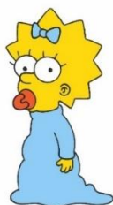
Imagen 34: Maggie Simpson.

La bebé independiente que nunca ha hablado. La característica más representativa del personaje es el sonido que hace al succionar su chupete.