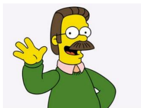
Imagen 47: Ned Flanders.

Flanders, es el vecino al cual Homer odia y trata constantemente mal. Intenta ser un buen cristiano y siempre hace lo correcto y ayuda a los demás, aunque eso hace que en varios momentos los vecinos se aprovechen de él. Su cuerpo es perfecto, aunque no realice ejercicio. Siempre se está entrometiendo en los asuntos de la familia Simpson apareciendo por la ventana con su famosa frase “Hola, hola vecinillo” y reprochando su poca fe cristiana. Todos los domingos va a misa y reza varias veces al día. Además, apenas ve la televisión porque para él es demasiado pecaminosa y Jesús no lo aprobaría.