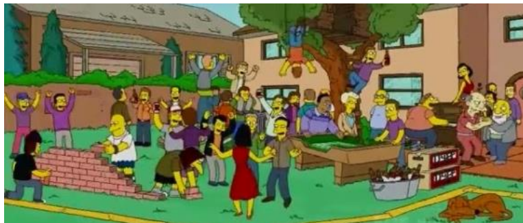
Imagen 16: Ciudadanos celebrando una fiesta, ya que las cámaras no lo pueden ver.

Bart, cansado de su vecino, descubre que detrás de su casa hay un punto ciego, así que él y su padre comienzan a hacer fiestas libertinas donde acude toda la ciudad. Flanders se entera del punto ciego y quiere disolver la fiesta, pero Homer le hace entender que no es ético vigilar a toda la ciudad.