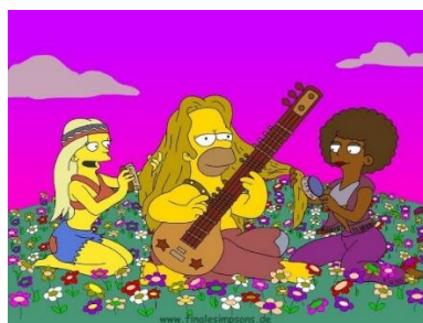
Imagen 48: Homer imaginándose como hubiera sido su vida de hippie.

Por otro lado, en el capítulo “¡Oh! En el viento” (temporada capítulo) Homer se entera de que su madre era hippie y le hizo un mural en una granja apartada de la ciudad. El padre se obsesiona con que él tiene que ser hippie también y comienza a vestir con ponchos, no se ducha y anda descalzo todo el día. En la granja viven dos señores que eran amigos de la progenitora y que en la actualidad tienen una empresa de zumos que hacen ellos mismos. Homer los convence para salir a “escandalizar a la ciudad”. Cuando regresan a la finca todas las botellas de zumo están rotas porque el padre Simpson dejó encajado su frisbee en la máquina. Para recompensar las pérdidas, Homer se cuela en la fábrica por la noche y hace una nueva producción, pero como no tenía ingredientes de sobra echa marihuana y al día siguiente cuando los consumidores prueban los zumos sienten los efectos del cannabis.