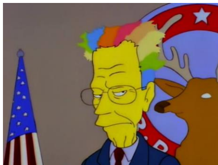
Imagen 2: Parodia de George Bush con peluca de payaso.

En “2 vecinos malos” (temporada 7 episodio 13) el expresidente George Bush y su esposa Barbara se mudan enfrente de la familia Simpson. Bart comienza a introducirse en casa de sus nuevos vecinos haciendo fechorías que terminan destruyendo las memorias que Bush que llevaba años escribiendo, por lo que este le pega un par de azotes en el culo al niño. Cuando vuelve a casa le cuenta a su padre lo ocurrido y Homer le reclama una disculpa al republicano, pero este se niega, lo que desencadena una guerra entre vecinos haciéndose jugarretas unos a otros. En una de ellas Bart y Homer pegan una peluca de payaso en la cabeza del político, lo que termina en una pelea física entre ambos adultos. En el desenlace del capítulo el exgobernante se disculpa con la familia y se muda.