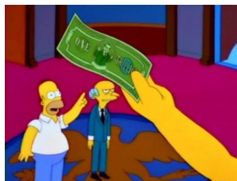
Imagen 3: Homer localiza el billete de un trillón de dólares en casa del Señor Burns.

En “El problema con los billones” (temporada 9 episodio 20) a Homer se le había olvidado hacer la declaración de la renta, así que la hace a toda prisa y la introduce en el sitio incorrecto. El FBI se pone en contacto con él porque piensan que ha intentado defraudar y le proponen un trato a cambio de no ir a la cárcel: tendrá que llevar una grabadora encima para espiar a sus amigos y al centenario Señor Burns, que tiene en su posesión un billete robado de un trillón de dólares. Cuando la agencia de investigación criminal localiza y esposas al Señor Burns, Homer y Smithers (el fiel ayudante del anciano) lo ayudan a escapar en una avioneta, y mientras están en el aire Burns alega que podrían quedarse en esa isla que pone “LIBERTAD” y Smithers le dice “Señor Burns, esa isla es Cuba” con un tono de disconformidad.