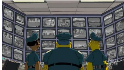
Imagen 15: Central de vigilancia.

Por último, en “Vigilancia con amor” (temporada 21 episodio 20) la ciudad se llena de cámaras para protegerla de actos terroristas ya que Homer se deja en una estación de tren una mochila con plutonio. Lo que comienza siendo un acto de vigilancia se vuelve una estructura panóptica, desde un punto central se ve todas las calles de la ciudad y todos sus habitantes son vigilados constantemente.