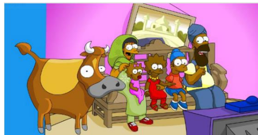
Imagen1: Cabecera de la serie “Los Simpson” versión India.

Tal es la importancia del contexto, que en muchas ocasiones la serie de Los Simpson se ha tenido que adaptar al país donde se emite, ya que si no se entiende el marco de referencia el receptor no puede captar la ironía. Uno de los ejemplos más claros es la diferencia que hay entre la India y España. La serie se llama Los Singhsons y el tono de su piel no es amarillo, sino oscuro. La serie está protagonizada por Omar (el padre) Mar Ji (la madre), Bartinder (como Bart) Lisajit (como Lisa) y Mugglie (como Maggie). En esta versión Homer no bebe ni consume carne de vaca, Lisa toca la tabla india y no el saxofón. La serie, finalmente se canceló en el país ya que no tenía tanto éxito como en otros.