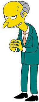
Imagen 50: Señor Burns.

El gran entretenimiento del señor Burns es ver cómo las demás personas sufren, por eso en “Homer contra la dignidad” (temporada 12 episodio 5) el padre de familia comienza a realizar actividades que afectan a su honra, como disfrazarse y comportarse como un bebé delante de toda la ciudad, con el fin de divertir al anciano a cambio de dinero. Cuando Lisa se entera de esto consigue hacer recapacitar a su padre y este intenta ponerle solución por lo que se ofrece a disfrazarse de Papá Noel y tirar caramelos en la cabalgata de Springfield.