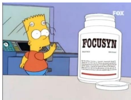
Imagen 14: Bart haciéndose pruebas para tomar al medicamento para la hiperactividad.

En este capítulo se puede ver como se cuestiona el uso de los medicamentos, en concreto en los tratamientos de los niños que en vez de encontrar otra alternativa a la mínima se les médica cada vez más, aunque sea contraproducente para ellos. Por otra parte, también se ironiza la cuestión de la vigilancia totalizadora, en este caso por la liga de béisbol, que sabe hasta la talla de gorra que utilizan los habitantes.