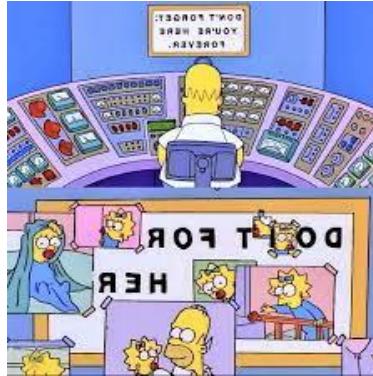
Imagen 19: Mural que tiene Homer en su puesto de trabajo con Maggie.

En un acto de maldad, el empresario cuelga un cartel en su despacho que pone “No olvide que usted estará aquí para siempre” y Homer lo cubre con fotos de la pequeña estratégicamente colocadas para que se lea “Hazlo por ella”.