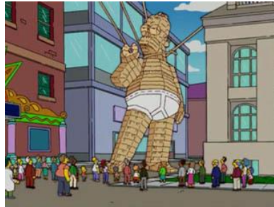
Imagen 22: Figura de Homer con palos de polos.

Otro ejemplo de su amor incondicional lo encontramos en el capítulo “Helado de Marge” (temporada 18 capítulo 7), en el cual Homer se hace heladero y con los palos sobrantes de los polos Marge comienza a realizar esculturas. Pero una vez más, Homer llega tarde a la exposición de Marge, e intentando llegar a casa a toda velocidad con su automóvil, trata de frenar al llegar pero termina derrumbando todas las esculturas, enfadando a su mujer. De nuevo, el amor por su cónyuge hace que lo perdone y le realice una escultura gigante.