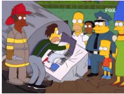
Imagen 13: Satélite que recoge toda la información sobre los ciudadanos.

Tras la inquietante escena los padres acuden a los científicos que le dieron la medicación a Bart y le dicen que no la puede dejar, por lo que comienzan a recetarle tranquilizantes. El joven se escapa y roba un tanque del ejército, disparando con este al cielo. Delante de todo el pueblo derrumba un satélite de la liga de béisbol que controlaba todos los datos de los ciudadanos entre ellos “su talla de gorra”.