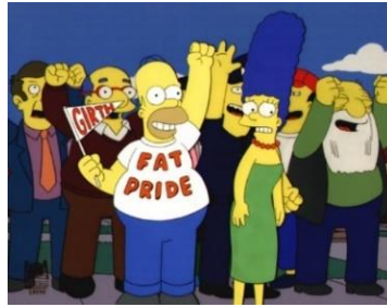
Imagen 42: Springfield celebrando que es la ciudad más gorda de Estados Unidos.

En este capítulo se puede ver una crítica clara al abusivo uso del azúcar en los productos alimentarios, ya que en el momento en el cual Marge comienza a leer la lista de ingredientes de productos que aparentemente son saludables siempre está presente la glucosa.