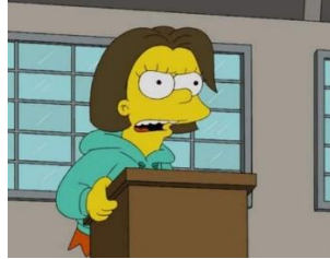
Imagen 51: Lisa Simpson teñida de morena.

Por otro lado, el estereotipo lo encontramos sobre todo en las amantes del alcalde Quimby, que son mujeres jóvenes, rubias, atractivas, preocupadas por su aspecto físico y siempre tienen un carácter sumiso e inocente. En numerosos casos, el hombre les promete que va a dejar a su mujer para mantener una relación sentimental con ellas, y estas siempre se creen sus mentiras.