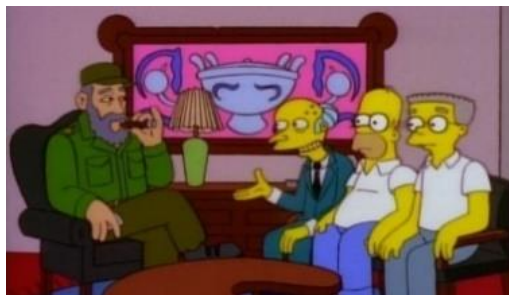
Imagen 4: Burns, Homer y Smithers le piden el billete a Fidel Castro.

En la siguiente escena aparecen los tres hombres en una barca en medio del mar apenados. Entonces el Señor Burns decide volver a América, sin importarle que le metan en la cárcel, ya que piensa sobornar al jurado.