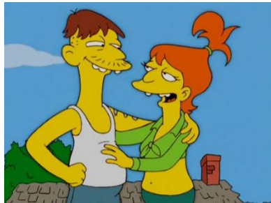
Imagen 46: Cletus y Brandine.

Estos personajes suelen dedicarse a la agricultura y tienen tradiciones arraigadas en el pasado, como por ejemplo en “Apocalipsis mu” (temporada 19 episodio 17) en el que Bart intenta salvar a su ternero del matadero y se lo da a Cletus para que lo cuide en su granja, pero según sus tradiciones, que alguien regale un animal a otra persona quiere decir que se quiere casar con su hija. El amor de Bart hacia el animal hace que se programe la boda independientemente de la corta edad de él y de la hija de Cletus y Brandine.