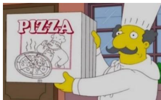
Imagen 39: Luigi Risotto