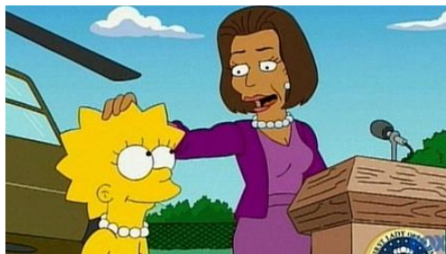
Imagen 33: Michelle Obama alentando a Lisa para que siga sacando buenas notas.

Otro ejemplo lo encontramos en “Picos robados” (temporada 21 episodio 15) en el cual Lisa comienza a ser popular porque ha sacado poca nota en un examen, y todos sus compañeros quieren ser amigos suyos, hasta que la profesora le comenta que ha sido un error y que de nuevo vuelve a tener un 10. Entonces, todos los niños se apartan otra vez de su lado. Lisa, apenada, escribe en su blog lo sucedido, recibiendo una respuesta de “Flotus1” que resulta ser Michelle Obama ya que acude al colegio para animar a la joven a seguir con sus buenas notas.