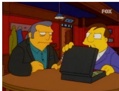
Imagen 6: Quimby recibiendo un soborno de la mafia.

Por ejemplo, en “El alcalde y la mafia” (temporada 10 episodio 9) Homer se hace guardaespaldas de Quimby y se puede ver cómo el alcalde abusa de su poder en beneficio propio, recibiendo dinero de la mafia para actuar ilegalmente (produciendo, por ejemplo, leche de rata para su posterior comercialización).