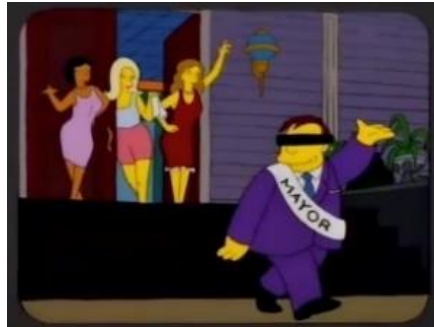
Imagen 5: El alcalde Quimby saliendo de un prostíbulo.

La serie hace una crítica directa a los políticos a través del personaje del alcalde Quimby ya que es retratado como un hombre blanco heterosexual que siempre está con mujeres guapas, con un coeficiente bajo, y que le es infiel a su mujer. El alcalde es un personaje corrupto que no se preocupa por el bienestar de la ciudad. Así, por ejemplo, en varios episodios podemos ver cómo recibe sobornos de la mafia.