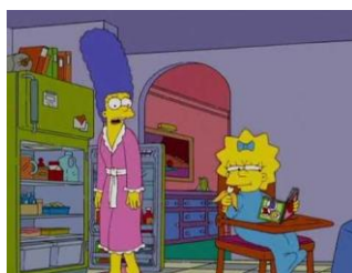
Imagen 36: Maggie se prepara ella sola el desayuno.

En otros capítulos se puede ver como la pequeña es independiente, “Grúa-boy de medianoche” (temporada 19 episodio 3) Marge está preocupada por su hija menor y contrata a una mujer que le hace darle más espacio a su bebé, demostrando las altas capacidades de esta: cambiándose el pañal, haciéndose el desayuno, incluso saliendo a la calle de noche y salvando a su padre que ha sido secuestrado.