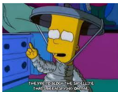
Imagen 12: Bart con metal en la cabeza para que no le espíen.

En otros capítulos, los guionistas buscan criticar el uso excesivo de medicamentos que se les da a los jóvenes para controlar su comportamiento. En “La ayudita del hermano” (temporada 11 episodio 2) Bart comete otra traxtada y los padres deciden darle medicación para combatir su trastorno de hiperactividad. A medida que el niño va tomando la medicación se vuelve cada vez más calmado y atento en la escuela, pero una noche comienza a comportarse de una forma obsesiva y les dice a sus padres que la liga de béisbol le vigila.