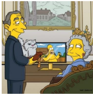
Imagen 17: La reina Isabel II y su hijo Carlos de Gales viendo la serie.

En los últimos segundos del capítulo se ve a un presentador de Reino Unido diciendo que su programa favorito se había terminado, como si un Show de Truman se tratará.