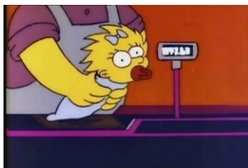
Imagen 35: Entradilla de la serie Maggie pasa por escáner del supermercado.

En las introducciones a la serie, cuando la bebé pasa por el escáner de la caja del supermercado, pone el precio de 847,63 dólares, que es lo que costaba mantener a un hijo en 1989. A partir de 2009 el escáner marca 486,52 dólares.