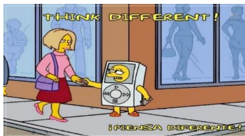
Imagen 8: Lisa repartiendo folletos de Mapeed.

Otro ejemplo lo encontramos en el capítulo “MyPods y cartuchos de dinamita” (temporada 20 episodio 7) en el cual Lisa entra en la tienda electrónica de Mapple (alusión de la tienda Apple) porque le apasiona toda su tecnología, pero es muy cara y no se puede permitir ningún dispositivo. En ese mismo lugar se encuentra Krusty, el payaso que enfadado con la calidad de su reproductor de música se lo regala a la niña. Entusiasmada, no para de escuchar música y descargarse canciones hasta que le llega la factura. Lisa se queda anonadada con la alta cantidad de dinero que tiene que pagar, así que decide ir a la casa de Steve Mobbs (clara referencia a Steve Jobs) que se encuentra debajo del mar y le pide un plan de pago personalizado mientras llora. En la siguiente escena aparece Lisa en la calle disfrazada de MP3 repartiendo folletos y diciendo “piensa diferente.