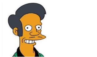
Imagen 40: Apu Nahasapeemapetilon.

En 2017, en Estados Unidos, se emitió un documental “El problema de Apu” donde varios personajes indios reconocidos del mundo del espectáculo estadounidense denunciaban los estereotipos racistas de la serie. La solución para que el personaje no fuera cancelado fue darle un giro de guion con el fin de que se adaptara al estilo cómico de la serie, pero sin dañar ninguna sensibilidad.