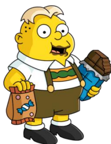
Imagen 49: Üter Zörker.

Üter Zörker es un niño de la escuela de Bart y Lisa, es alemán y está en el programa de intercambio. Üter es un niño rubio con un claro sobrepeso y un acento alemán muy marcado que viste con el trachten, traje típico alemán, y siempre se le puede ver comiendo chocolate, salchichas o pidiéndole a la cocinera del comedor más comida porque se ha quedado con hambre.