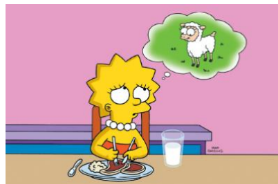
Imagen 31: Lisa sintiéndose mal por comer carne.

En el capítulo “Lisa la vegetariana” (temporada 7 episodio 5) la mediana comienza a tomar conciencia del abuso de productos animales que se consumen en su familia y decide no comer carne nunca más. Su familia no acepta este pensamiento y Homer hace todo lo posible para que su hija mayor cambie de opinión. En el desenlace del capítulo, la joven descubre que Apu, el dueño del supermercado, también es vegetariano lo que hace que tenga un apoyo y pueda continuar con este estilo de vida hasta la actualidad.