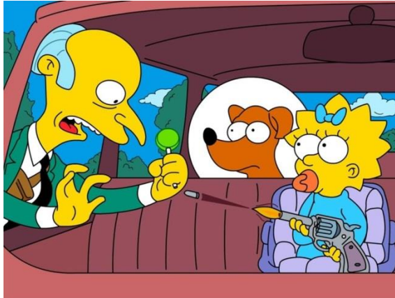
Imagen 37: Maggie dispara al Señor Burns.

La lactante también ha participado en varias tramas turbias de la serie, como por ejemplo en “Quién disparó al Señor Burns 2 parte” (temporada 7 episodio 1) donde resulta que fue ella quien lo hizo, pero lógicamente, como es un bebé, nadie lo cree.