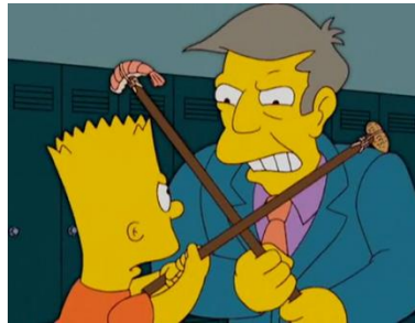
Imagen 28: Lucha entre Bart y Skinner.

El hermano mayor de Los Simpson descubre que es el director del colegio es quien sufre la intolerancia, por lo cual no para de amenazarlo con acercarle cacahuetes para que haga todas las cosas que él quiera. Skinner, cansado de la situación, descubre que Bart es alérgico a las gambas. Para finalizar el capítulo, los dos terminan peleándose entre dos cubetas llenas una de cacahuetes y otra de gambas y los dos acaban cayéndose en la que le da alergia respectivamente y con ello acaban en el hospital.