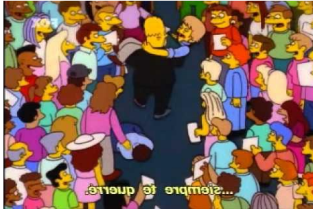
Imagen 7: Mark Richard Hamill en brazos de Homer parodiando la película “El Guardaespaldas”

Entonces Homer lo coge en brazos y mientras de fondo suena la famosa canción “I Will Always Love You” de Whitney Houston comienza a pegar patadas a todos los reporteros, haciendo un guiño paródico a la aclamada escena de la película “El Guardaespaldas”.