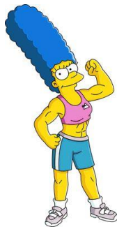
Imagen 23: Marge culturista.

En la historia contada en “Los fuerte brazos de Marge” (temporada 14 episodio 9) la madre comienza a utilizar el equipo deportivo que su marido compró y nunca ha utilizado. Ante el aburrimiento, Marge decide utilizar el equipamiento y poco a poco se vuelve más fuerte, va interesándose cada vez más por el mundo de la competición y va conociendo personas que utilizan esteroides para conseguir una mejor forma física. Marge, tras quedar en segunda posición en una competición, se vuelve más exigente consigo misma. Hasta que en la taberna de Moe, los amigos de Homer le dicen que ha perdido toda su feminidad y que no la ven atractiva, lo que desencadena una fuerte pelea en el bar que la hace recapacitar sobre su comportamiento y su adicción, dejando el mundo deportivo.