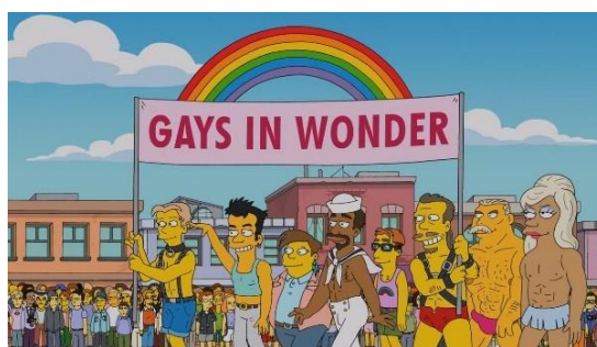
Imagen 41: Manifestación del Orgullo Gay en Springfield.

Por otra parte, las mujeres homosexuales siempre van vestidas con ropa típica de hombre y camiseta de cuadros por dentro de los pantalones, hecho que viene a recalcar que las mujeres homosexuales no cumplen con el estereotipo femenino, sino con el masculino.