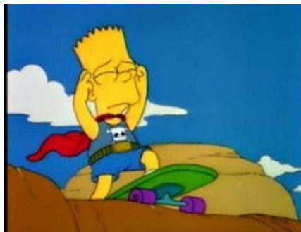
Imagen 20: Bart a punto de saltar de un acantilado.

Por otra parte, el padre se juega varias veces la vida para que su hijo no salga herido. En “Bart, el temerario (temporada 2 episodio 8) Bart intenta saltar un acantilado de un lado a otro con su monopatín, como lo intentó el hombre al que admira. El padre se entera de la locura que va a hacer y lo impide montándose él en el monopatín, con la mala suerte que este termina rodando cuesta abajo y al final es él quien tiene que saltarlo para salvar su vida. Naturalmente esto no ocurre y Homer termina en el hospital.