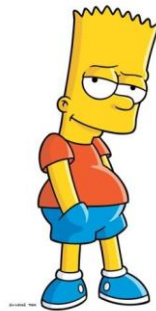
Imagen 26: Bart Simpson.

Es el hijo mayor travieso que siempre se está metiendo en problemas. Con este personaje se cumple el estereotipo de “niño malo”. Con su pelo pincho, su tirachinas en el bolsillo de atrás y su patinete en mano, a primera vista se puede intuir que Bart es rebelde.