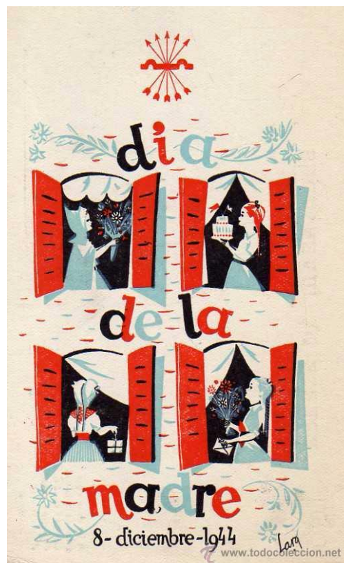
Figura 8: Cartel del Día de la Madre de 1944

Por lo que llegó a la conclusión de que en este cartel se busca dar la importancia a la mujer, pero siempre con los valores tradicionales, ya que los regalos que se ven en el cartel son los que se entregarían a una mujer porque se asocia con lo que tradicionalmente le gusta a una mujer como son las flores o la repostería.