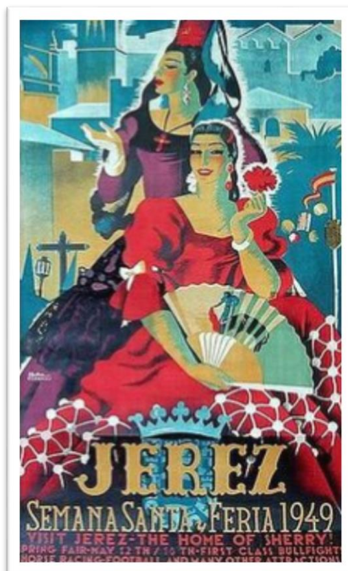
Figura 4. Cartel de Semana Santa y Feria de Jerez de la Frontera de 1949