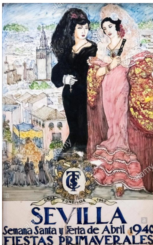
Figura 1. Cartel de las ferias y Semana Santa de Sevilla de 1940