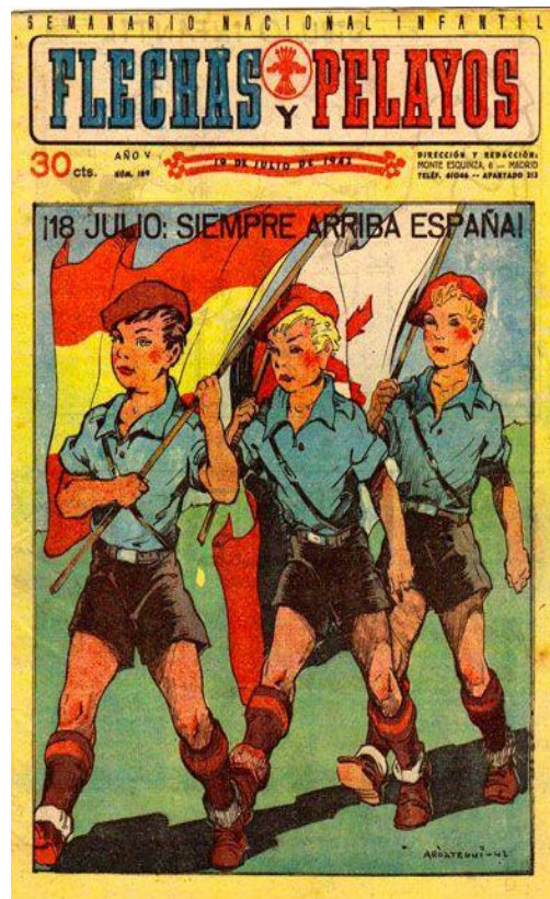
Figura 7. Portada de la revista “Flechas y Pelayos” del 19 de Julio de 1942