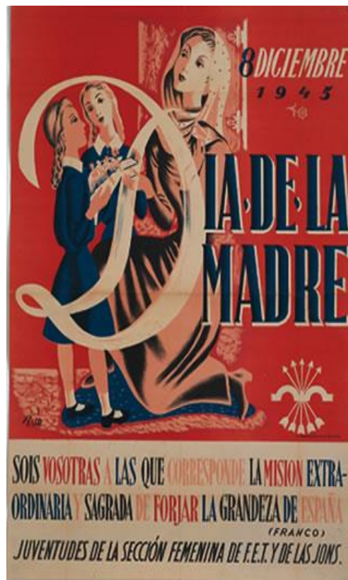
Figura 9: Cartel del Día de la Madre de 1948