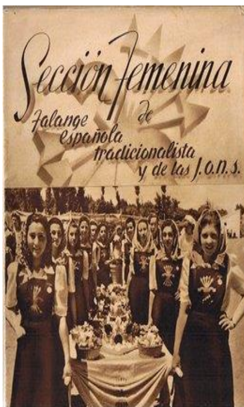
Figura 9: Cartel de la Sección Femenina de 1943