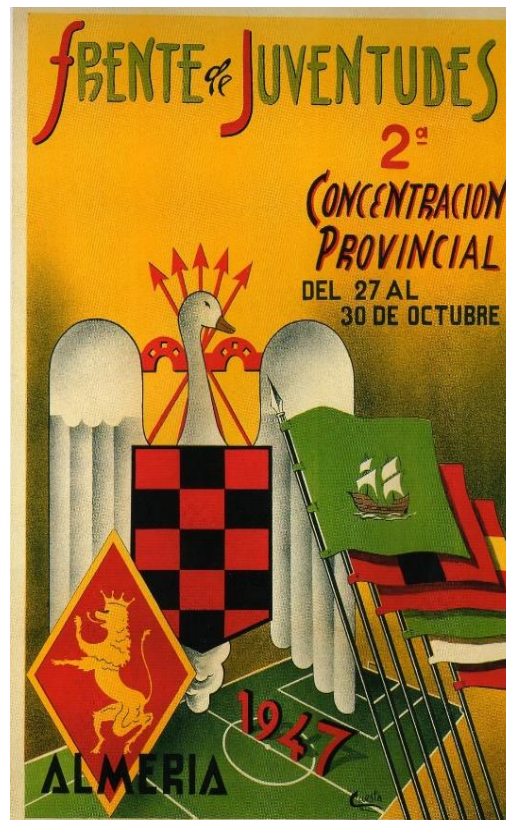
Figura 5. Cartel de Frente de Juventudes de Almería de 1947

En lo que respecta a las tipografías que se utilizan en “1947” y “Almería” aunque se ve que son distintas la una de la otra, ambas son tipografías decorativas, estas se caracterizan por no tener gran importancia a la hora de la legibilidad. Se puede ver que a diferencia de otros carteles que he analizado estas letras son más parte del dibujo que de fácil entendimiento para la lectura del cartel.