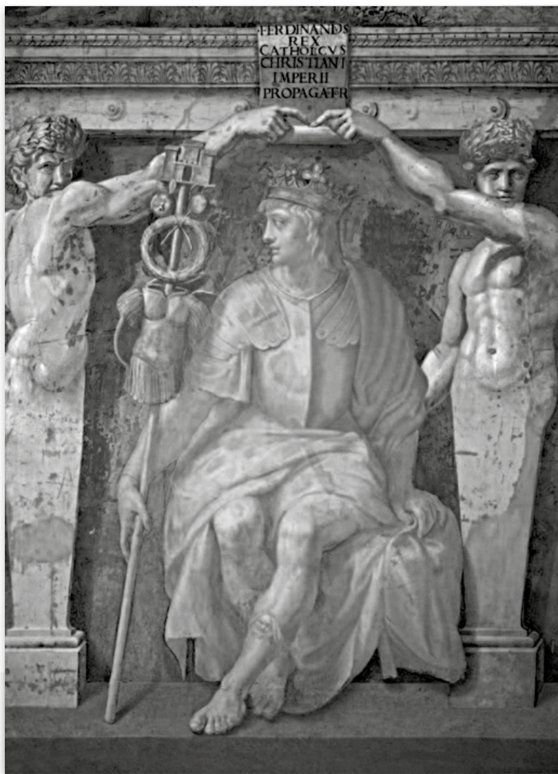
Fernando el Católico, Museos Vaticanos, estancia del Incendio del Borgo, Escuela de Rafael, 1514-1517.

lo que era ya sabido por todos. Un carta del arzobispo de Zaragoza –don Alonso de Aragón, hijo natural del rey Fernando– confirmó la noticia, momento en que el virrey hizo “llamar a todos los barones deste reyno que aquí se fallaron y a los otros desta çudad”, y les comunicó el deceso, comenzando entonces las muestras de dolor. En su narración, el virrey deja clara la fidelidad para con la corona: “falle en ellos tanta fidelidad y tan entrañable amor y voluntad de querer biuir y morir conmigo en seruicio de vuestra alteza y del rey mi señor que fue para tan grande perdida mucho consuelo”. Por ello,