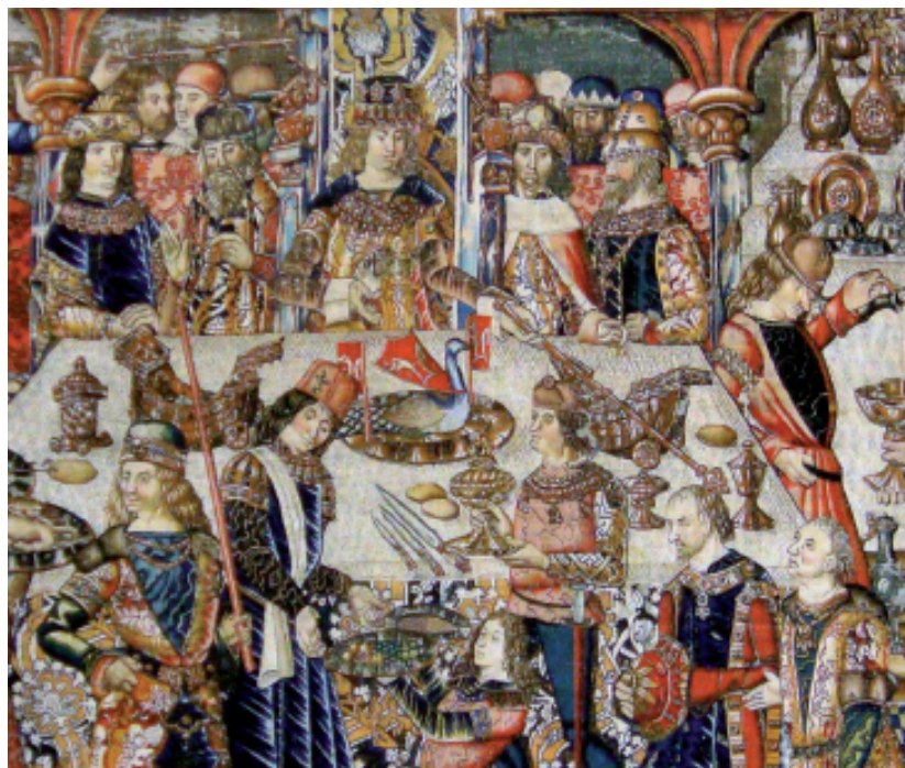
Tapiz de la serie de Esther y Asuero (detalle). f. sXV. Museo de Tapices de la Seo, Zaragoza.

Pero no sólo son los monarcas los que hacen uso –y abuso 122 – del lujo, sino que los nobles también se rodearán de tapices, joyas, ricos vestidos, costosas armaduras, en un alarde de riqueza, realmente espectacular. El lujo en el vestir es el más visible, por su carácter de exhibición, pero no es el único ámbito en el que se cometían excesos: en el comer, por ejemplo, nobleza y realeza hacen gala de una abundancia sin igual: en el banquete que el almirante sirvió a los archiduques en Valladolid el 6 de marzo, cuarenta caballeros sirvieron otros tantos platos. A todo esto acompañaba la posesión de objetos y animales exóticos, que, en un gesto no exento de extravagancia, separaban a su poseedor del común de los mortales 123 . Por ejemplo, en casa del marqués de Villena, en Toledo, se mostró un avestruz 124 .