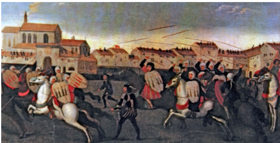
JUEGO DE CAÑAS EN VALLADOLID, Jacob van Laethem (atrib.), 1506. Château de la Follië, Écaussinnes (Bélgica).

al son de los tambores y trompetas y había tanta gente que era difícil mantener el orden. Toda la ciudad estaba engalanada para la ocasión: