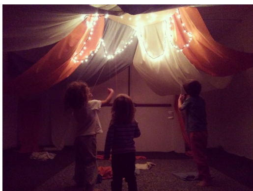
Figura 27: Instalación sensorial de telas y luces del museo DA2.