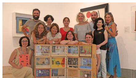
Figura 3: Grupo de profesores en un taller de Musaraña con la BigValise.