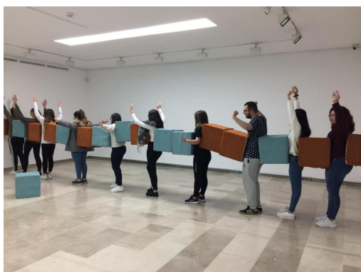
Figura 25: Alumnos y alumnas del I.ES. Fernando de Rojas jugando con la instalación de bloques del museo DA2.