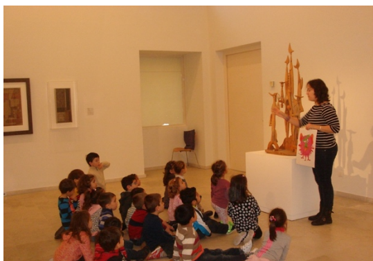
Figura 11: Alumnos visitando el museo, en el taller Un intruso en el Museo.