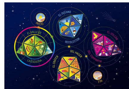
Figura 5: Tablero de juego de la actividad La Kepler.