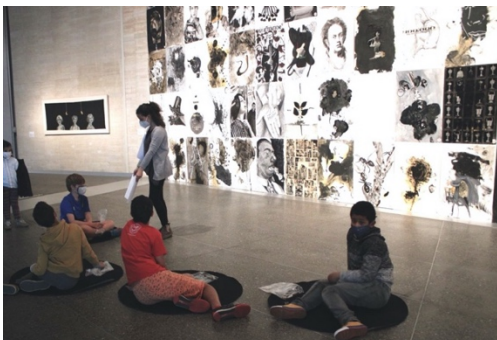
Figura 14: Taller Diverviajes por las Exposiciones.