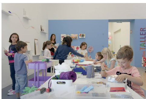
Figura 21: Actividad realizada en el Taller mini-TEA.