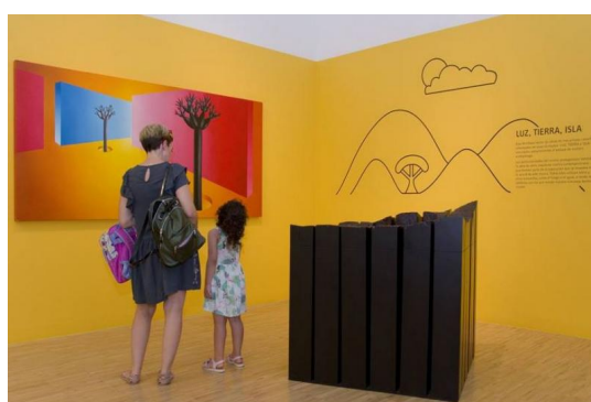
Figura 23: Madre e hija disfrutando de una obra perteneciente a la colección mini-TEA.