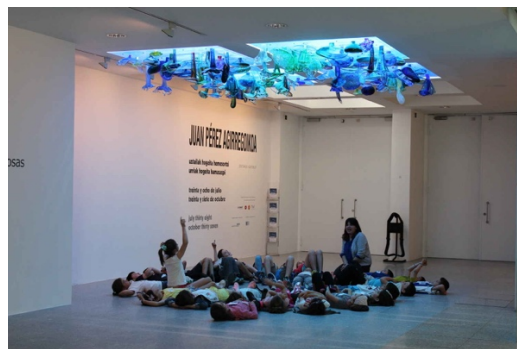
Figura 10: Actividad escolar en el museo ARTIUM.