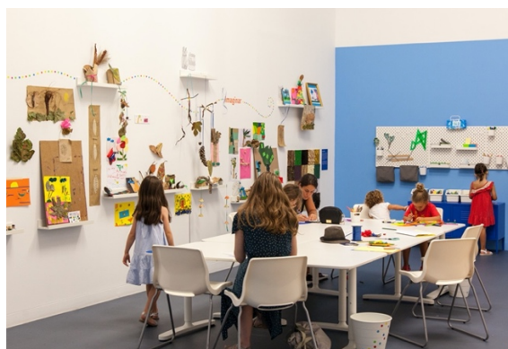
Figura 20: Taller mini-TEA.