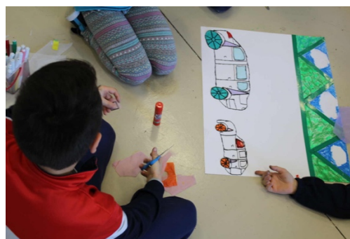
Figura 10: Actividad en el museo con el taller El Tesoro.