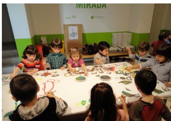
Figura 15: Alumnos realizando el mural final.