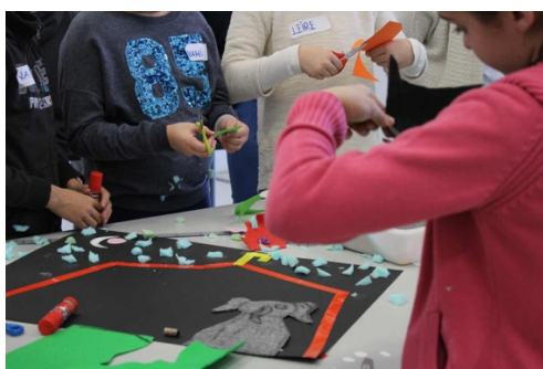
Figura 9: Actividad en el museo con el taller El Tesoro.