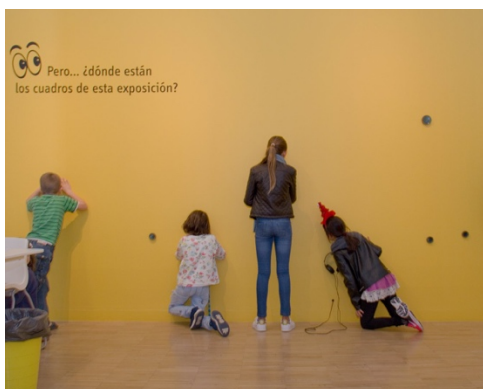
Figura 19: Inauguración 2017 Espacio Mini-TEA.

Imágenes extraídas de la página web del TEA. 12