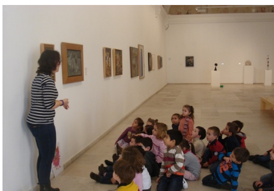
Figura 13: Visita por el Museo con la educadora, en el taller Un intruso en el Museo.