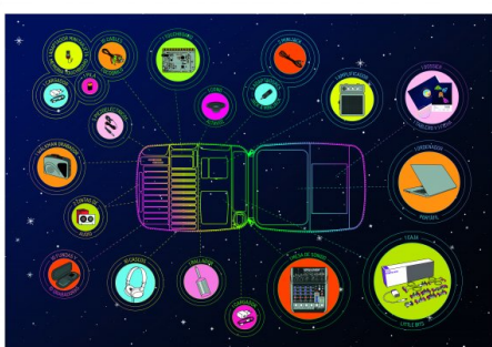
Figura 6: Mapa de aparatos de la actividad La Kepler.