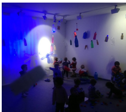
Figura 28: Instalación sensorial de botellas y luces del museo DA2.