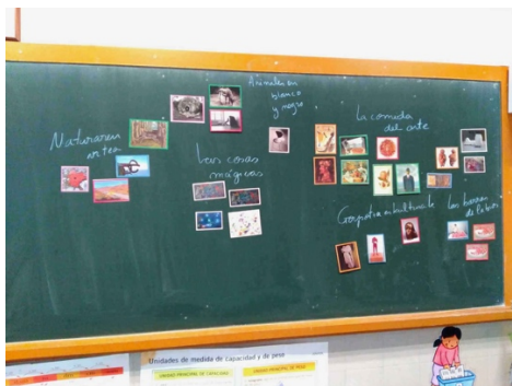
Figura 9: Actividad en una escuela con el proyecto ARTIUM Sale.