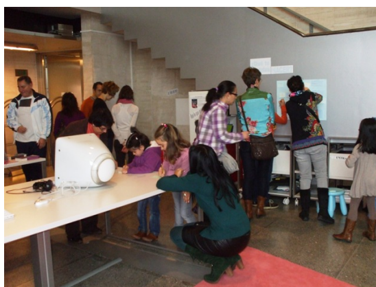
Figura 18: Sesión del taller Filoninxs.