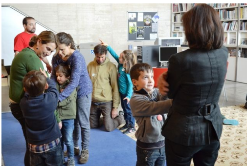
Figura 16: Taller Filoninxs.