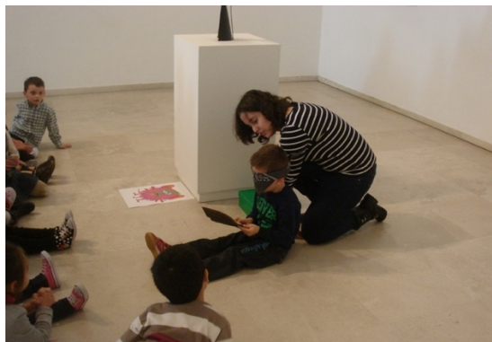
Figura 12: Niño usando el tacto para sentir el arte, en el proyecto Usa tus sentidos.