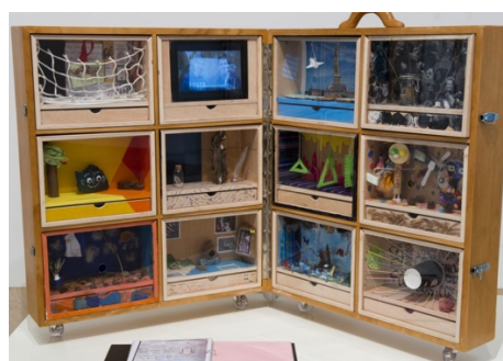
Figura 7: La Big Valise.