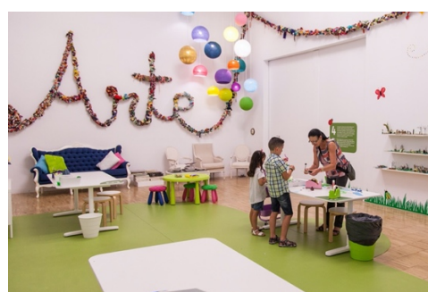
Figura 22: espacio Mini-TEA.