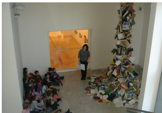
Figura 14: Alumnos visitando en el museo, con el taller Un intruso en el Museo.