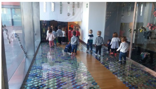
Figura 24: Niños y niñas disfrutando de una actividad sensorial del proyecto Miradas en el museo DA2.