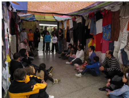
Figura 15: Taller Diverfamilia.