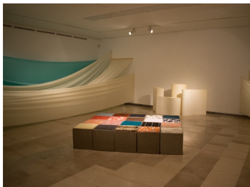
Figura 26: Instalación de bloques de gomaespuma.