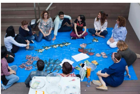
Figura 4: Grupo de profesores en un taller.