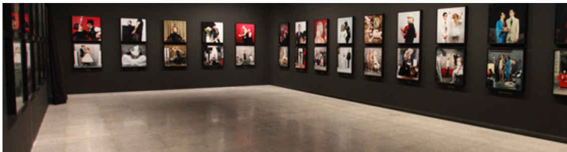
Figura 8. Exposición de fragmentos de los talleres en video del proyecto Loturak.