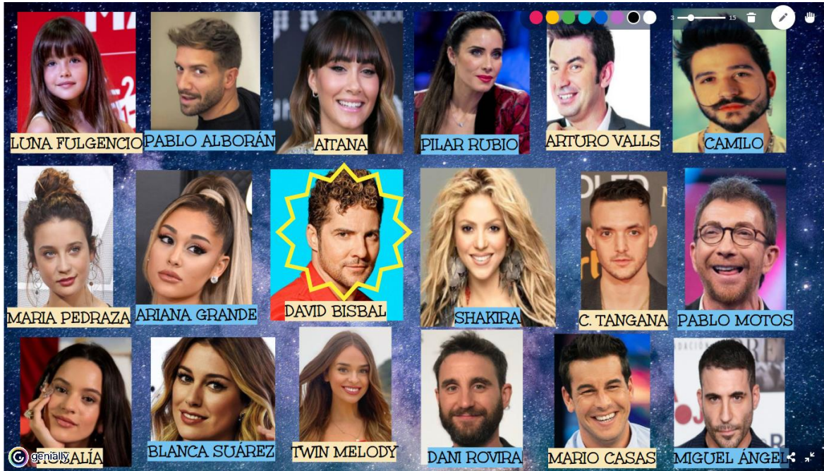
Anexo IV. Mural realizado en las sesiones 3, 6 y 9