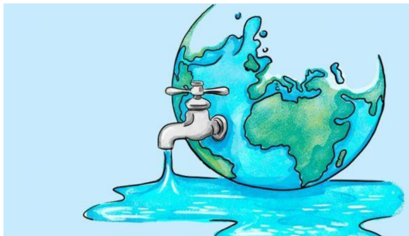
Figura 1. La hidrosfera