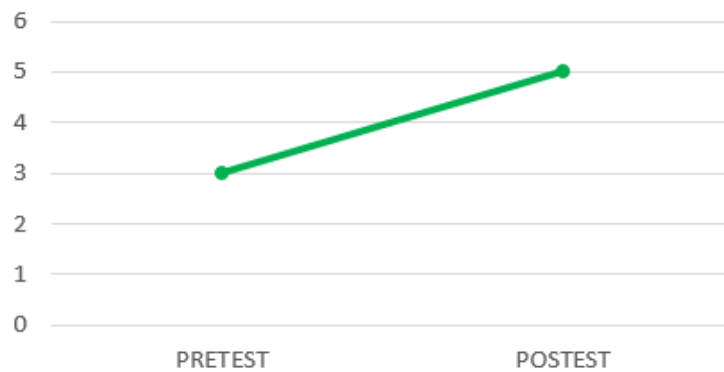
Gráfico 2. Evolución de la alumna en la cantidad de elementos estructurales narrativos utilizados

Por último, se analizaron las variables de estructura, coherencia y calidad textual. Tanto la estructura como la calidad de los textos de la alumna experimentaron una mejora considerable, pasando de calificar el texto como no estructurado y de baja calidad a considerarlo como parcialmente estructurado y adecuado. La coherencia, sin embargo, no mejoró, puesto que en ambas evaluaciones la alumna redactó textos por completo incoherentes. El gráfico 3 refleja la evolución de estas variables.