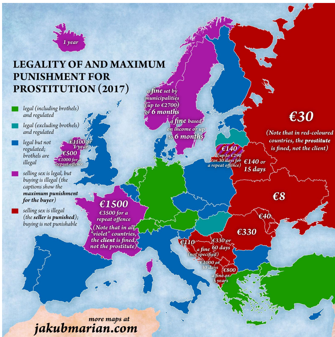
Ilustración 1. Leyes sobre prostitución en los países europeos.