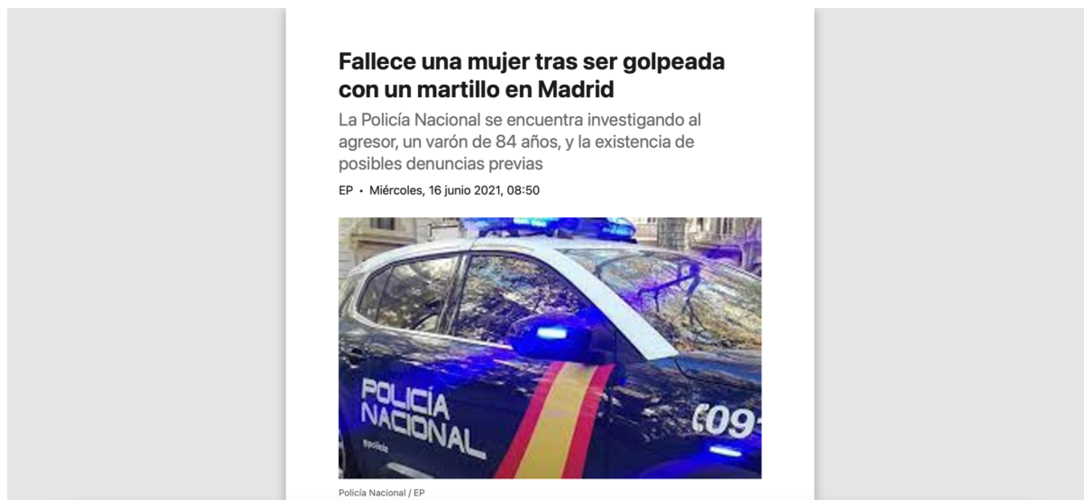
Figura 5. Torices, A. (2021) Noticia.

El periódico El norte de Castilla, el 16 de junio publica en su portal web la noticia “Fallece una mujer tras ser golpeada con un martillo en Madrid” a las 08.50 horas.