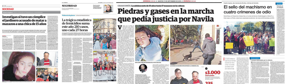
Figura 3. Portadas de periódicos argentinos. Elaboración propia.