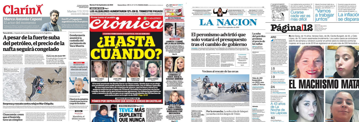
Figura 2. Portadas de periódicos argentinos. Elaboración propia.

En Argentina el femicidio es primera plana con una frecuencia lamentable. En 2019, cuatro mujeres fueron asesinadas en distintos puntos del país durante el fin de semana del 14 y 15 de septiembre instalando el tema una vez más en la agenda mediática. Como contrapartida, se instaló también el análisis sobre el tratamiento que recibe este tipo de contenido en los medios, tarea llevada a cabo por los Observatorios y Curadurías de Contenido Audiovisual con Perspectiva de Género.