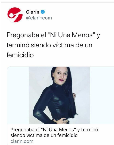
Figura 4. Aranda, L. (2020) Noticia policial. Recuperado de: https://www.clarin.com .

El periódico El norte de Castilla, el 16 de junio publica en su portal web la noticia “Fallece una mujer tras ser golpeada con un martillo en Madrid” a las 08.50 horas.