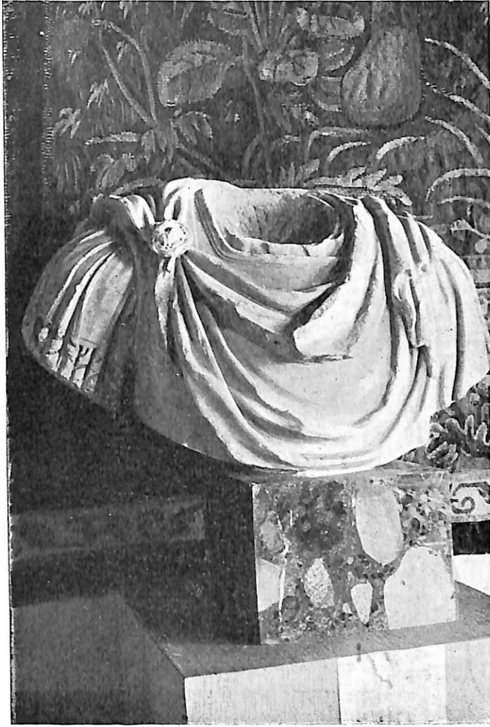
LÁMINA IV.—Busto de un soldado.