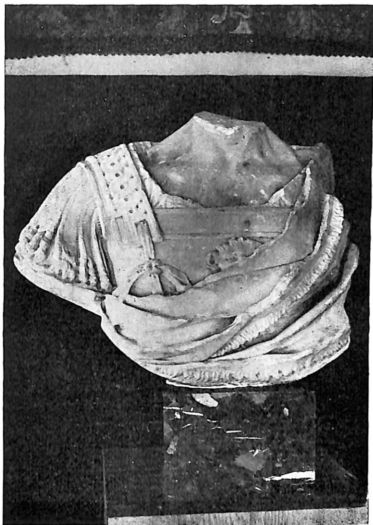
LÁMINA VII. — Busto toracatae . (Foto del S. E. A. A.).