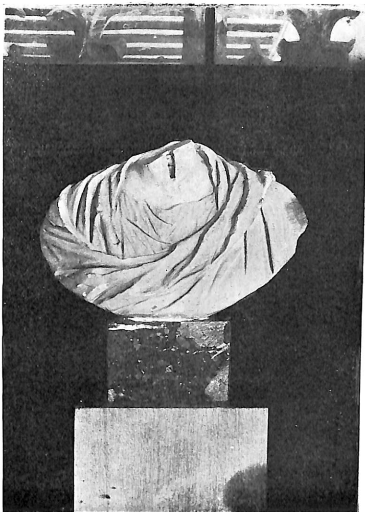
LÁMINA III. —Busto de personaje togado.