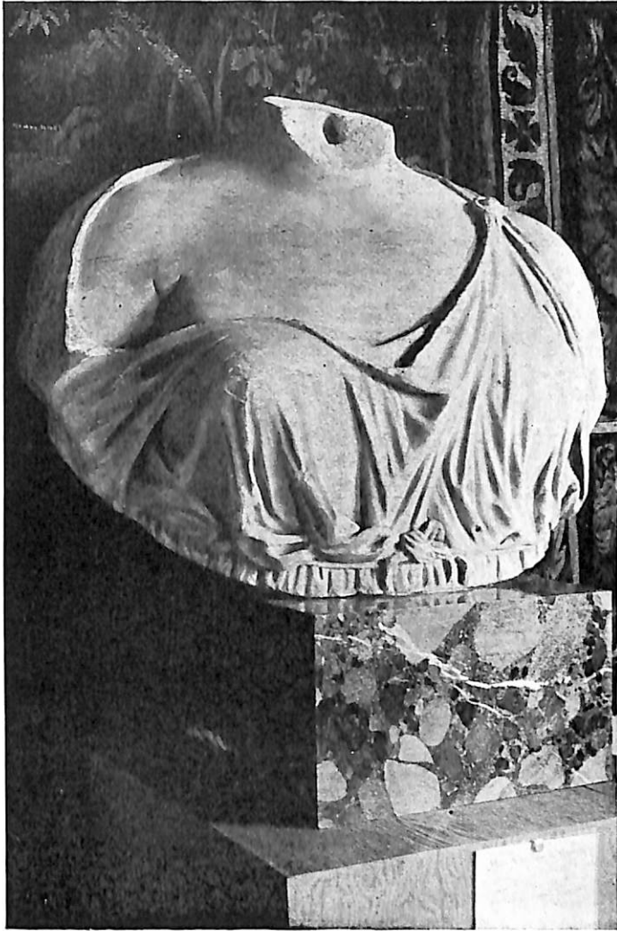
LÁMINA VI. —Busto de mujer.