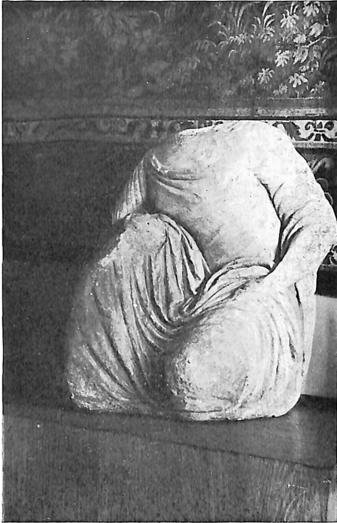
LÁMINA I. —Niña jugando a las tabas. (Foto del S. E. A. A.).