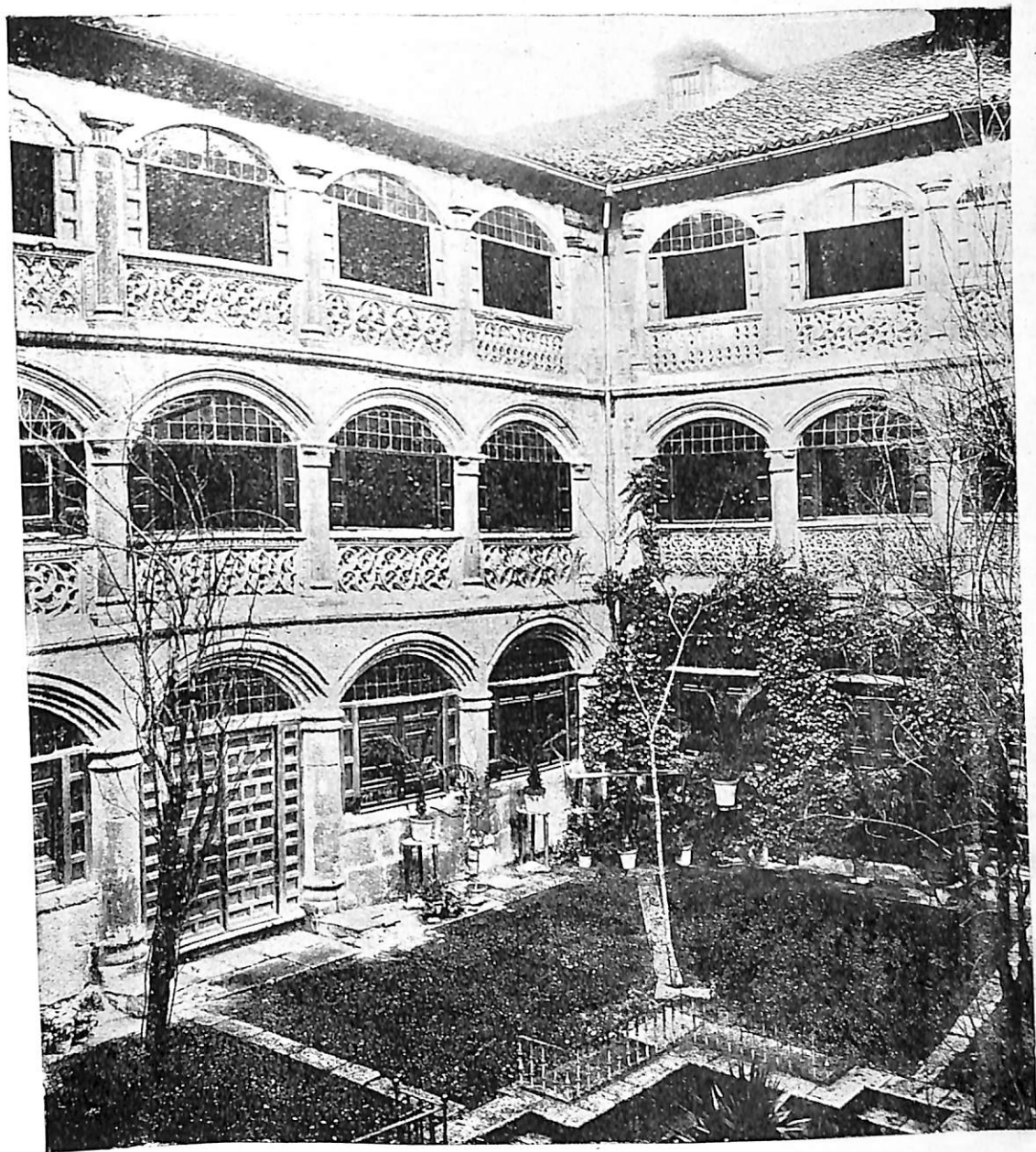
LÁM. I.—Valladolid.— Claustro del monasterio de Santa Cruz ( Dominicas Francesas )