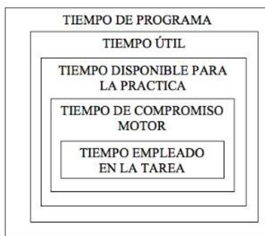
Figura 3. Reducción del tiempo en clase. Efecto embudo.

Además, la siguiente figura 3 muestra de forma gráfica el efecto embudo que supone la reducción del tiempo en las clases de EF.