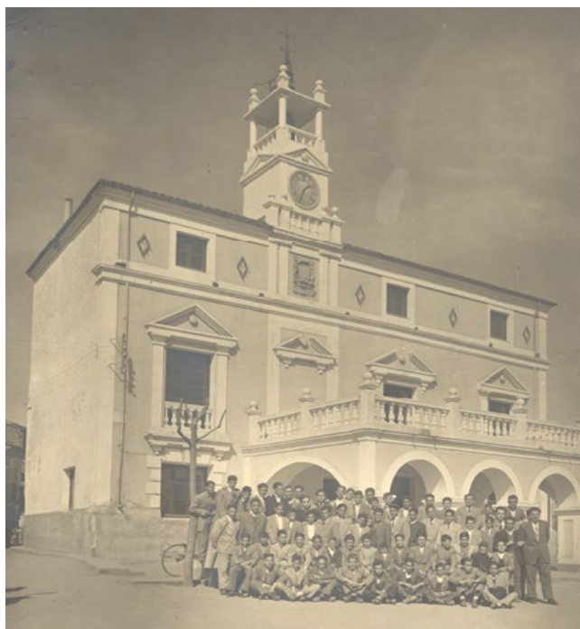
1953, marzo, 7. Grupo de alumnos de la clase de “Extensión cultural” del Instituto Laboral de Saldaña “José Antonio Girón”. (ADPP Archivo fotográfico).

Incorpora además el expediente de la Comisión de liquidación del Patronato que se inicia en 1967 y se concluye en 1972.