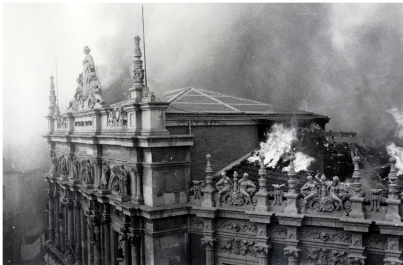
1966. Incendio del Palacio de la Diputación.