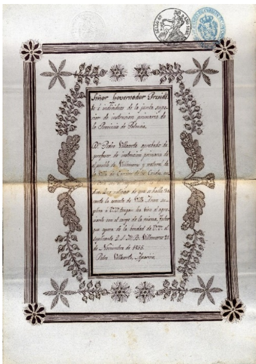
1855-1856. Expediente de provisión de vacante de maestro en Villa-arcón [Villalcón].

Ambos organismos, aunque no fueran dependientes en sentido estricto de la Diputación pues participaban otras instituciones, tuvieron un papel fundamental y la documentación generada constituye la fuente documental más antigua sobre educación vinculada a la Institución provincial, y que, como ocurre en otras Diputaciones, se ha conservado en su Archivo.