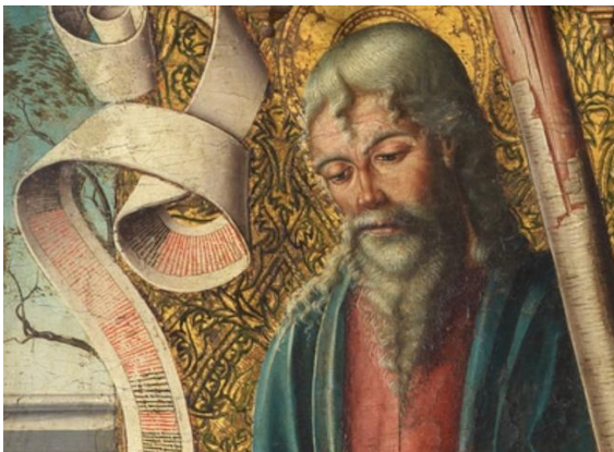
Fig. 14. San Andrés (detalle). Retablo de Nuestra Señora . Maestro de la Horta. Ca. 1520. Metropolitan Museum of Art. Nueva York. Foto: museo