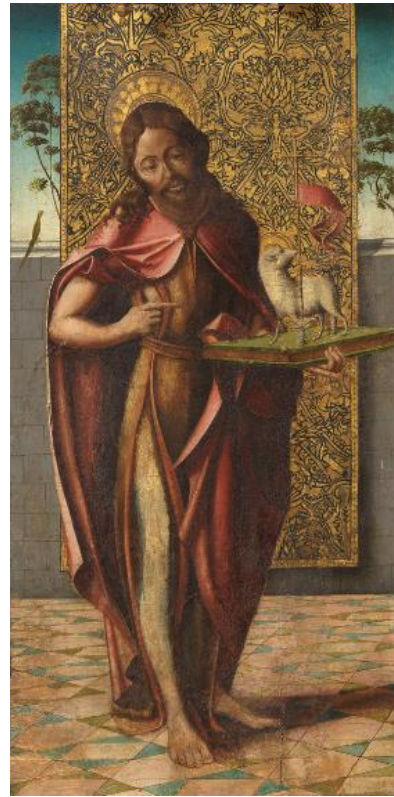
Fig. 12. San Juan Bautista. Retablo de Nuestra Señora. Maestro de la Horta. Ca. 1520. Metropolitan Museum of Art. Nueva York.

Y es que la comarca de Tierra de Campos, que se encuadra en el sur de la diócesis legionense, pero también partes de las diócesis de Zamora, Astorga y Palencia, se ha revelado como un territorio pleno de intercambios. En la primera