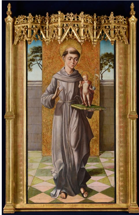
Fig. 2. San Antonio de Padua . Maestro de la Horta. Ca. 1520. Museo de León. León.

La historia del retablo desde su salida de su ubicación original es un buen ejemplo del periplo que seguía este tipo de piezas. La referencia más antigua lo sitúa en la galería del anticuario Juan Lafora, en Madrid. 10