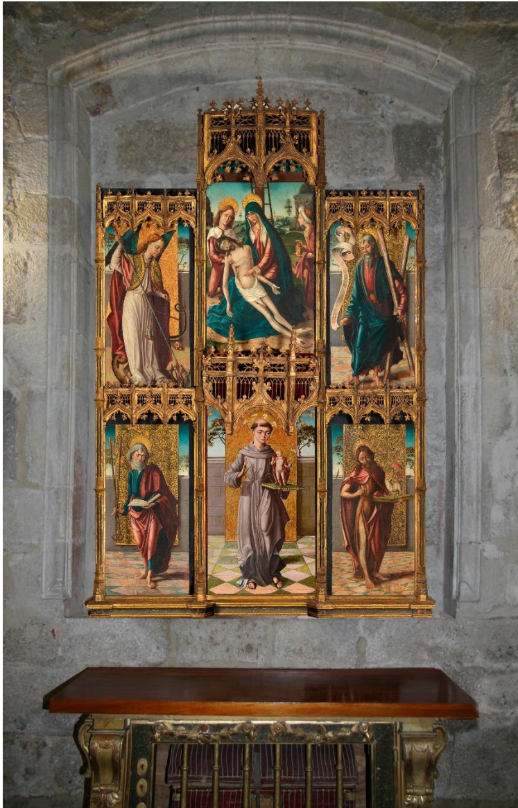
Fig. 3. Recreación del estado original del Retablo de San Antonio de Padua en su ubicación primigenia en la capilla de Juan Vega de la iglesia de Santa María de la Horta de Zamora. Recreación: Francisco M. Morillo

el santo principal y no San Juan, santo patrono del fundador, que queda desplazado a la izquierda del santo franciscano (fig. 3), también pudiera estar en consonancia con quien finalmente encargó la obra, aunque esta afirmación no deja de ser una hipótesis que por el momento no se puede comprobar.