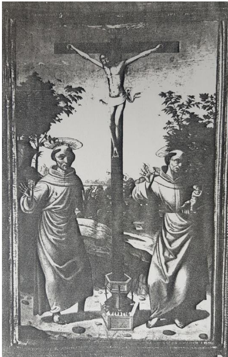
Fig. 6. Cristo en la cruz flanqueado por San Francisco de Asís y San Antonio de Padua. Maestro de la Horta. Ca. 1520. Paradero desconocido

En cuanto a las figuras que habitan ese espacio, se repiten su esbeltez y las manos alargadas y expresivas. Los rostros son muy similares, como se puede comprobar al comparar la Magdalena de la Lamentación del Metropolitan con la Santa Clara de la tabla Parmeggiani.