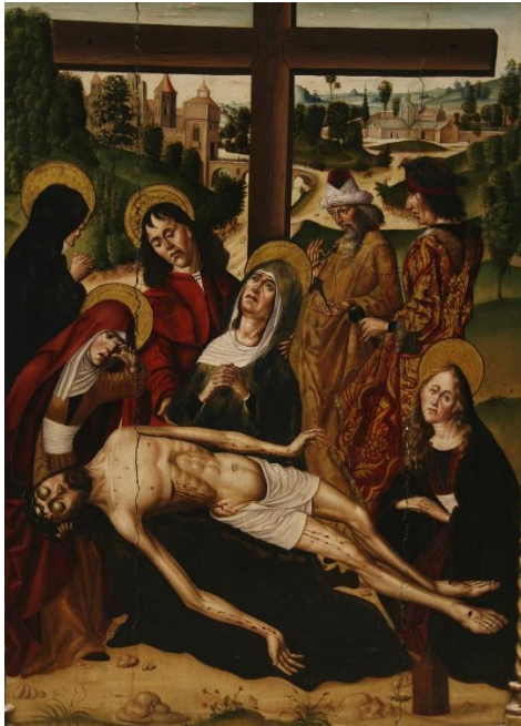
Fig. 9. Lamentación. Retablo mayor de la parroquia de Santa Marina de Mayorga (Valladolid). Maestro de la Horta. Ca.1500. Museo de Bellas Artes de Asturias. Oviedo.

Esta pintura abre el camino hacia una serie de obras hispanoflamencas con las que existe una relación tan evidente que cabe plantear la posibilidad de que nos hallemos ante la producción temprana de un mismo pintor, a caballo entre los últimos años del siglo XV y los inicios de la siguiente centuria.