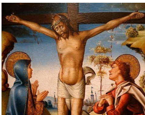
Fig. 7. Calvario (detalle). Entorno del Maestro de la Horta. Ca. 1515. Currier Museum of Art. Mánchester (New Hampshire)

sabemos, esta es una devoción muy franciscana que pone en paralelo el sufrimiento de Cristo en la cruz con la estigmatización de San Francisco, a la que aquí se alude en el modo en el que se representa al santo. Pero es menos común que además aparezca San Antonio de Padua. Es por ello que seguramente se trata de una tabla de tipo devocional, bien para un convento franciscano, bien para un particular, sin que seguramente formara parte de un retablo. Aquí las afinidades son muy patentes en las figuras tanto de los santos franciscanos, algo más amanerados que el San Antonio de Padua del Museo de León y con el rostro algo más expresivo y menos dulce, pero aun así pensamos que son obras que se deben a la misma mano.