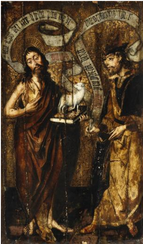
Fig. 11. San Juan Bautista y el profeta Balaam. Maestro de la Horta. Ca. 1500. Colección Laia Bosch

relacionada por Post con el retablo del Metropolitan, cualquiera que fuera el autor de ambas obras. 45 Ciertamente, las afinidades son muy estrechas, tal y como se puede constatar al comparar los dos santos con el San Andrés del retablo neoyorkino (fig. 14). Años más tarde Hodge la incorporó al catálogo del pintor que se encargó a medias con el Maestro de Palanquinos del retablo de Santa Marina de Mayorga. 46 Así pues, los vínculos entre las distintas pinturas de este maestro, que ahora queremos reunir en un único catálogo, ya estaban latentes, pero necesitaban de una mirada global que tuviese en cuenta el territorio.