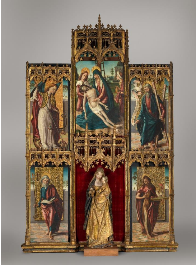
Fig. 1. Retablo de Nuestra Señora . Maestro de la Horta. Ca. 1520. Metropolitan Museum of Art. Nueva York.

Por otra parte, el Museo de León exhibe una tabla que concuerda con las medidas, estilo e iconografía de la tabla que falta en el retablo que se conserva en Nueva York. Se trata de un San Antonio de Padua (fig. 2) adquirido hace una década por la Junta de Castilla y León que se depositó en el citado museo, 8 seguramente ante la creencia de que pertenecía en origen al patrimonio de esa provincia, ya que salió a subasta como obra del Maestro de Astorga. 9 Mide 140 x 72 cm, dimensiones muy similares a las de la tabla de la Piedad que ocupa el centro del cuerpo superior del retablo del Metropolitan. Pero no solo las medidas encajan: los rasgos formales no dejan lugar a dudas acerca de que estamos ante la pieza que falta en el retablo neoyorkino.