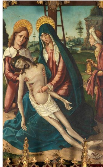
Fig. 10. Lamentación. Retablo de Nuestra Señora. Maestro de la Horta. Ca. 1520. Metropolitan Museum of Art. Nueva York.

La obra más importante de esta serie fue hecha para Mayorga, en plena Tierra de Campos vallisoletana, en una zona perteneciente entonces a la diócesis de León. Se trata del retablo de la parroquia de Santa Marina de esta localidad, que se encuentra hoy en Oviedo, en el Museo de Bellas Artes de Asturias. Fue realizado por dos pintores anónimos, el conocido como Maestro de Palanquinos y otro coetáneo, aún por definir, que se encargó de las dos calles del lado de la Epístola inmediatas a la calle central del retablo y de la calle del lado del Evangelio situada junto a la calle central. 41 El Maestro de la Horta comparte con este último pintor algunos rasgos, como un gran interés por el desarrollo espacial, el empleo de figuras muy alargadas y el tipo de rostros, que en ocasiones resultan