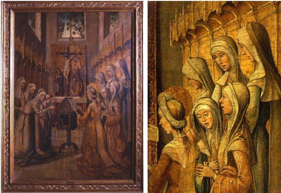
Figs. 4-5. Santa Clara y su hermana Inés acogidas en un convento (conjunto y detalle). Maestro de la Horta. Ca. 1520. Galleria Parmeggiani. Reggio Emilia.

En todo caso, sea cual fuere el tema, las medidas (144 x 100 cm) y la representación tan específica de un episodio de la vida monástica indican que la tabla procede de un retablo de un convento femenino. Si damos por buena la opción de las clarisas, ha de tenerse en cuenta el ámbito de trabajo de este pintor, y esto implica la exclusión de importantes cenobios de monjas franciscanas en la provincia, como el de Santa Clara de Benavente o el de Santa Clara de Toro. Por otra parte, ha de pensarse en un convento de cierta magnitud y dedicado a la fundadora de la orden, a tenor de la especificidad del tema representado, que solo parece susceptible de formar parte de un ambicioso conjunto narrativo dedicado a Santa Clara. En la Zamora de los inicios del siglo XVI había varios conventos femeninos vinculados a la orden franciscana, pero algunos de ellos, como el de Santa Marina o el de Santa Isabel, eran, más bien, beaterios, de carácter más humilde. Así que todo lleva a pensar en la casa principal de esta orden en la ciudad, establecida desde 1237. Ese primer convento duró poco al ser arrasado por una crecida del Duero y 1269 cambió de ubicación. La cronología de este