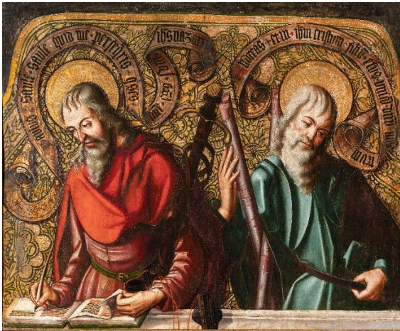
Fig. 13. San Pablo y San Andrés . Maestro de la Horta. Ca. 1500. Museo de Bellas Artes de Bilbao. Bilbao.

mitad del siglo XVI transitan por él artistas como el escultor Jacques Bernal, el pintor Lorenzo de Ávila o maestros anónimos como el denominado de los Santos Juanes o el más conocido y prolífico Maestro de Astorga, de manera que no debe extrañar el periplo seguido por el Maestro de la Horta. Más complejo es, sin embargo, explicar el lapso de tiempo transcurrido entre las obras leonesas y las zamoranas, pero, sobre todo, determinar dónde pudo aprender a manejar las claves del nuevo lenguaje renacentista. La contención emocional, la mayor idealización de las figuras o el cambio en la gama cromática, son fórmulas fácilmente asimilables. Pero el manejo del espacio en un periodo en el que aún se estaba desarrollando en la península este nuevo estilo es ciertamente notable y difícil de aprender en un ámbito local que a priori no parece estar conectado con las grandes novedades del momento. Pero a día de hoy no hay respuesta a esta importante cuestión, que es clave para desentrañar los inicios de la pintura del Renacimiento en esta zona, más allá de una primera irrupción a través de la figura de Pedro Berruguete, que, en este caso, no ayuda a despejar la incógnita.