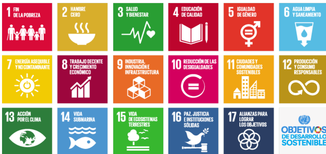
Imagen 2.1. Los 17 Objetivos de Desarrollo Sostenible de la ONU. Consultado el 20/10/2021