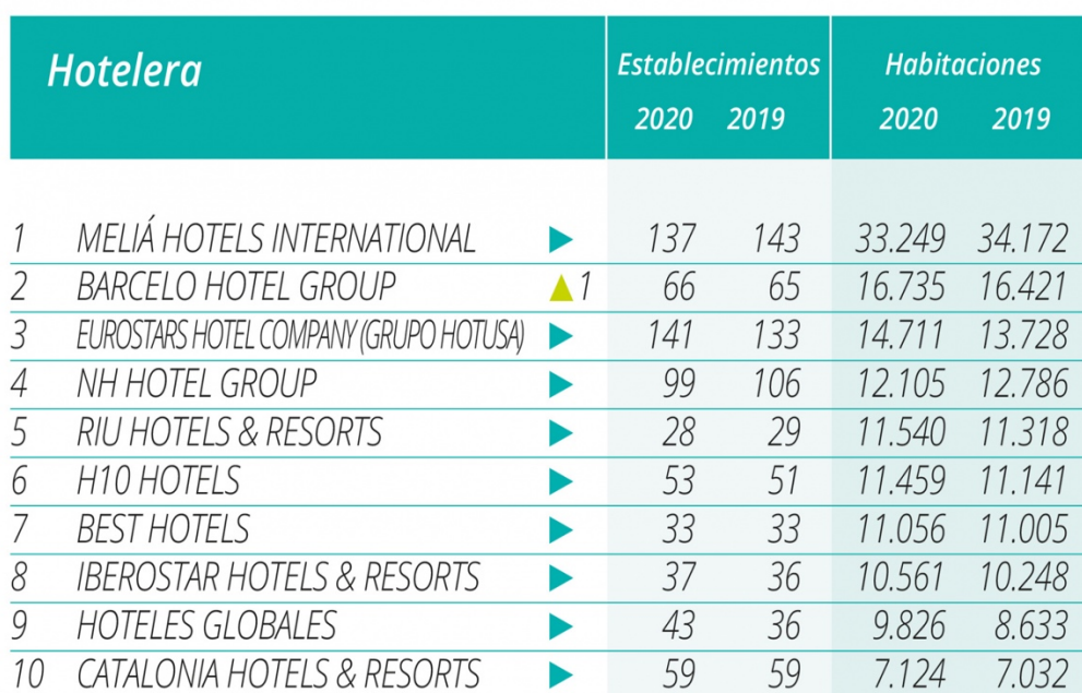
Tabla 3.2 Ranking de las 10 cadenas hoteleras españolas con mayor número de establecimientos y habitaciones en España. Fuente: Hosteltur. Consultada el 16/11/2021

https://www.hosteltur.com/139934_ranking-hosteltur-de-grandes-cadenas-hoteleras-2020.html