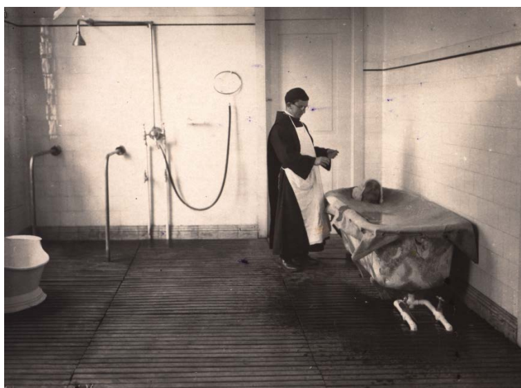
Figura 1. Exemplo de hidroterapia utilizada na Casa do Sagrado Coração de Jesus (década de Quarenta do século XX)

Fonte: p. 200 de GUEDES, Natália Correia (coord.), Museu São João de Deus Psiquiatria e História , Lisboa, Editorial Hospitalidade, 2009.