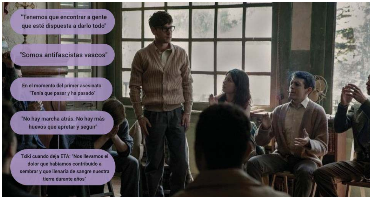
Figura 6: Cinco momentos clave en La línea invisible