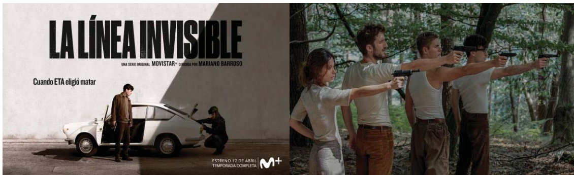
Figura 2: Cartel (izquierda) y protagonistas de La línea invisible (derecha)

Para la presente investigación se ha procedido a analizar el capítulo 5 por la relación que guarda la historia con otras de las series analizadas. En este episodio se observa el primer asesinato de la banda terrorista: el del guardia civil José Antonio Pardines. Se presenta el hecho y destaca que no es un crimen planificado, a diferencia del asesinato de Melitón Manzanas que sí se planea en este capítulo. Asimismo, se muestra el acuerdo de todos los jóvenes pertenecientes a ETA en llevarlo a cabo.