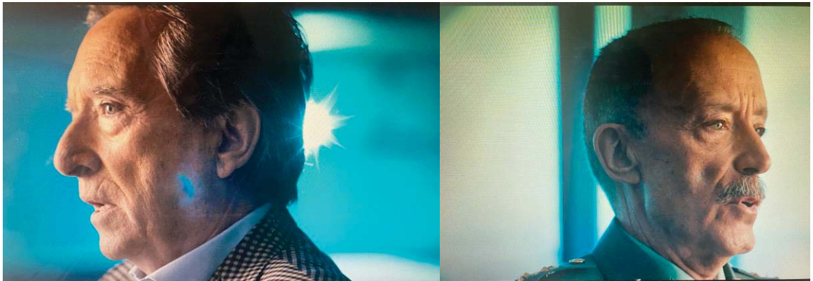
Figura 9: Primerísimo primer plano en El desafío: ETA

A diferencia de las series de ficción, el documental El desafío: ETA opta mayoritariamente por el primerísimo primer plano que permite mostrar un rostro emocional y expresivo ya que busca centrarse en los detalles faciales. Con este encuadre se puede ganar cierto grado de intimidad y dramatismo por la proximidad que existe con el retratado con la que se genera una gran cercanía. El centro de atención de este plano generalmente se ubica en los ojos (Martínez, 2021).