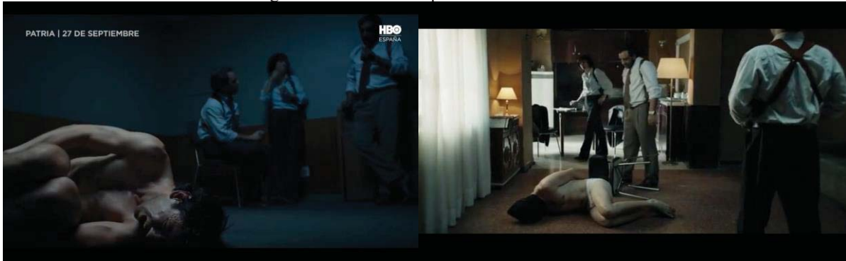
Figura 4: Escena del capítulo 7 en la serie Patria