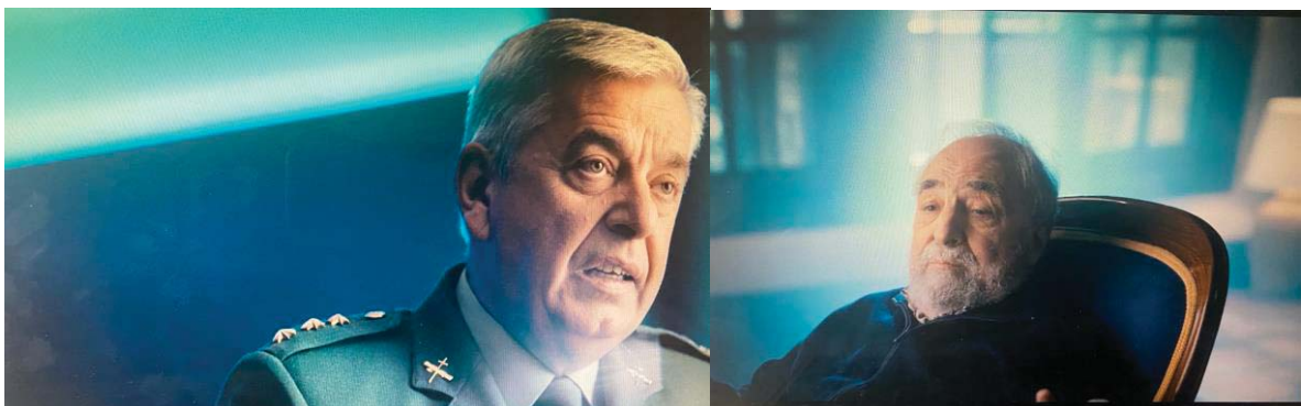
Figura 10: Primer plano en El desafío: ETA

El documental buscando la conexión del testimonio con el espectador utiliza los planos más cercanos. Por ello, también destaca el primer plano que permite al espectador conectar con el relato en momentos clave. El televidente es testigo de las escenas más emotivas (Santisteban, 2011) en las que hablan sobre las muertes a manos de la banda terrorista y cómo lo vivieron tanto los militantes de ETA como los familiares de las víctimas.