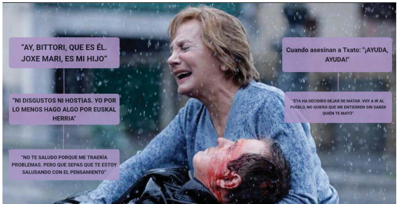
Figura 5: Cinco momentos representativos para Gabilondo en Patria

Dentro de este apartado en el que se trata la importancia del contenido emotivo cabe destacar cinco de los momentos clave de las dos series de ficción analizadas: