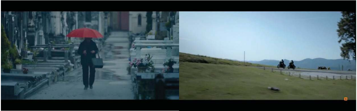
Figura 7: Plano general en Patria (izquierda) y La línea invisible (derecha)