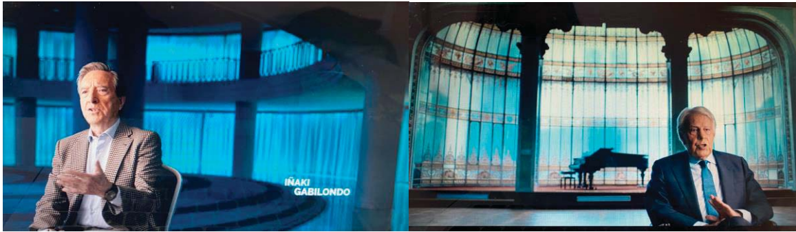
Figura 11: Plató El desafío: ETA