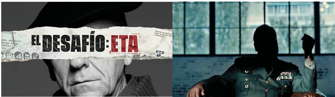
Figura 3: Cartel (izquierda) y testigo en El desafío: ETA (derecha)

En este episodio destacan los testimonios cercanos al crimen: el único testigo del asesinato (el camionero), el hermano del guardia civil, compañeros de trabajo, así como ex militantes de ETA e intelectuales del País Vasco. Todos ellos conforman el relato en el que se da voz a lo ocurrido en Euskadi y a lo que supuso el primer asesinato tanto para la banda terrorista como para la sociedad en general.