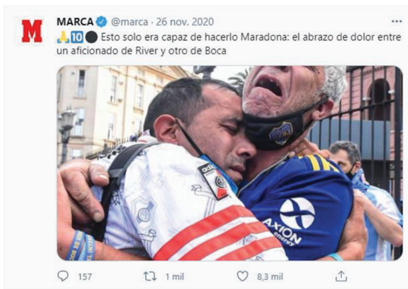
Imagen 5. Titular sensacionalista

Respecto al tipo de titular, se puede apreciar que el 25,23% de las unidades de análisis totales llevan consigo un titular sensacionalista, un titular que trata de dirigirse solo a las sensaciones de las personas para atraer así a los receptores de información y que, normalmente, están protagonizados por información chocante, polémica y que llama mucho la atención.