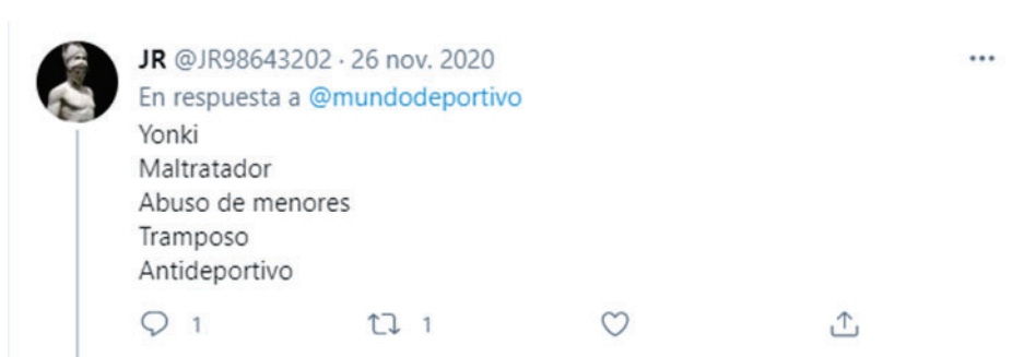
Imagen 6. Expresiones empleadas para generar odio de manera explícita

Como se ha detallado en la metodología, los comentarios han sido examinados en otra tabla de codificación. La primera variable trata el tipo de incitación al odio que se refleja en los comentarios de las publicaciones. Entre las posibles categorizaciones se encuentran: incitación sutil, incitación directa o ninguna. Se entienden por expresiones empleadas para generar odio de manera explícita todas aquellas que contienen un insulto o una ofensa hacia la personas sin ningún tipo de tapujos.