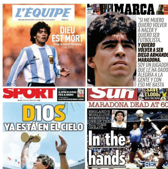
Imagen 1: Collage de portadas del día 26/11/2020