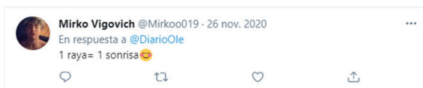
Imagen 7. Expresiones empleadas para generar odio de manera sutil

A su vez, se entienden por expresiones de odio sutiles aquellas en las que se hace uso de un lenguaje más ingenioso o perspicaz para ofender a una persona.