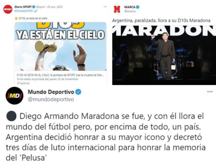
Imagen 4: Collage de categorización por titular, en función de si es informativo o interpretativo