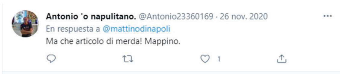
Imagen 8. Expresiones dirigidas a los medios de comunicación por malas prácticas periodísticas

un ataque hacia la figura de Maradona, sino contra los periódicos al publicar determinadas informaciones que la audiencia considera incorrectas o amarillistas. Opinan que la información publicada respecto a un tema tan delicado como es la muerte de una persona, no se ha llevado a cabo desde una perspectiva adecuada, por eso, en algunos comentarios denominan a la prensa como “kiosko”, en otros les piden que se callen, o en otros utilizan expresiones más directas.