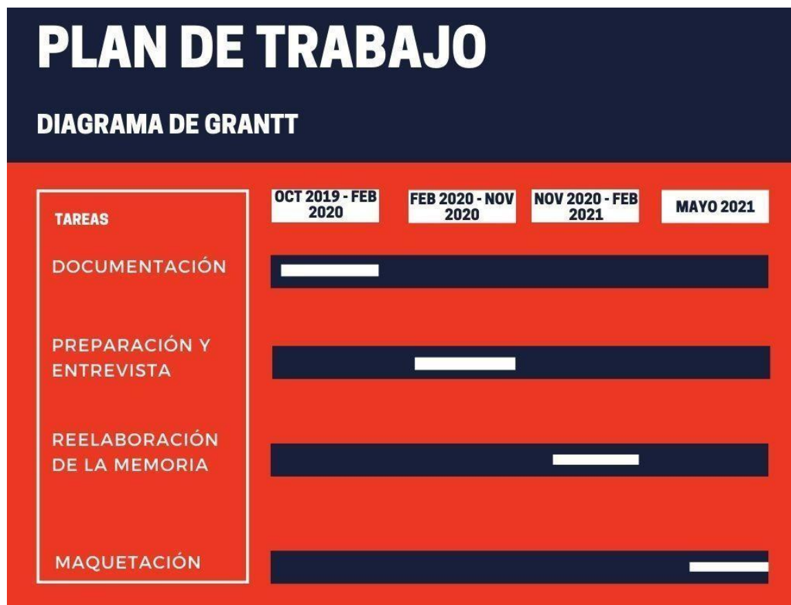
Diagrama de Grantt realizado con Canva (Elaboración propia)

A través del Diagrama de Grantt se recogen las diferentes fases de la elaboración del Trabajo de Fin de Grado. La elaboración del cronograma está realizada con el programa online Canva.