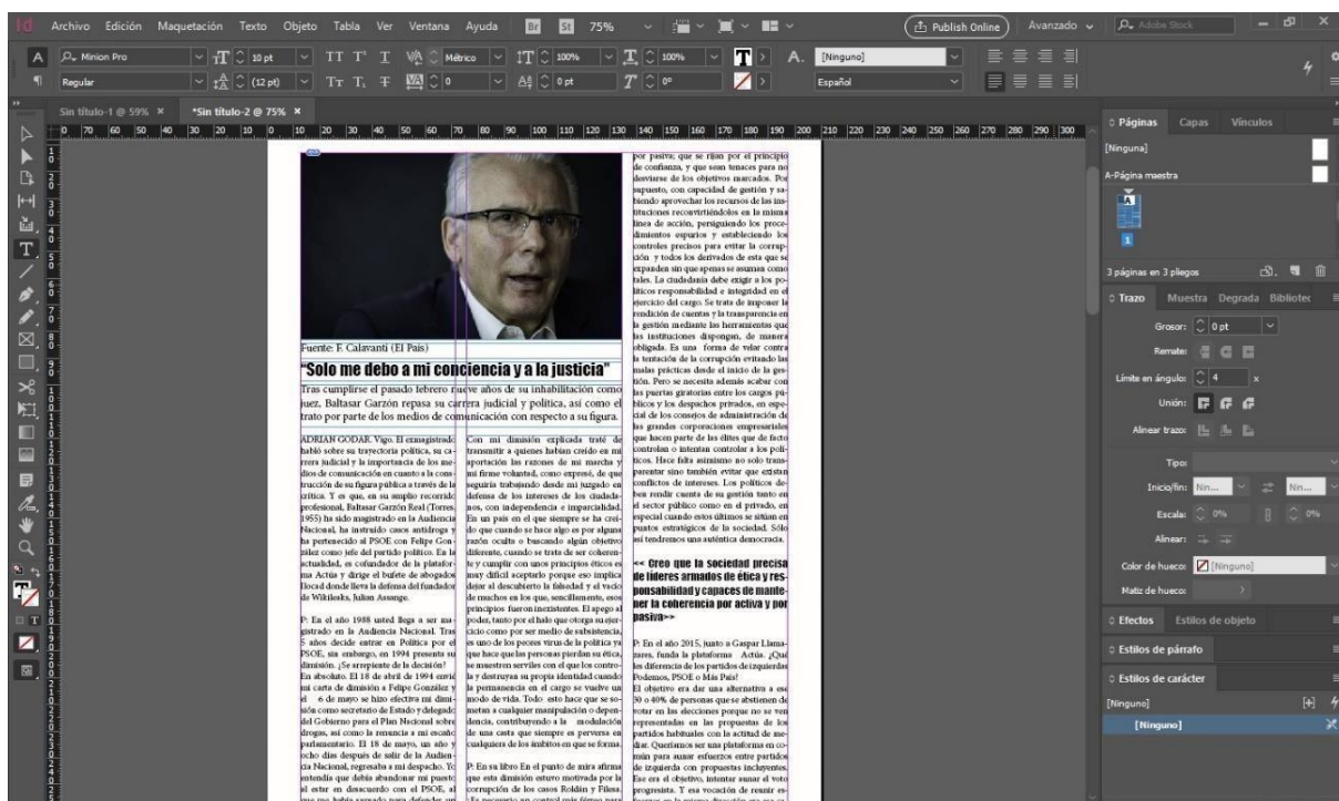
Captura de pantalla acerca del proceso de maquetación

Con respecto a la herramienta de maquetación y las dificultades en cuanto a plasmar la entrevista, se han dado diferentes complicaciones debido a los conocimientos básicos acerca del programa. Por ello, he tenido que recurrir a diferentes tutoriales en la plataforma Youtube y páginas especializadas en la materia para poder ampliar los conocimientos y realizar una maquetación lo más real posible.