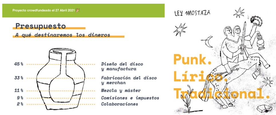
Ilustración 8. Imagen en la que aparece representados los diferentes porcentajes a los que el dinero de este proyecto ha sido destinado.

Es decir, Punk, Lírico, Tradicional se trata de un proyecto complejo para el que una vez más se ha contado con la colaboración de diferentes artistas afincados en Valladolid que han formado parte o siguen vinculados a colectivos ya mencionados como últimoCero o “Moscas de Compañía”. Precisamente, y con la razón de tratarse de un entramado complejo en el que han intervenido más artistas, el crowdfunding de Ley Mostaza fue lanzado el día 18 de marzo de 2021 planteando para sus mecenas un primero objetivo de 3000€ al que pusieron como fecha límite el 27 de abril de 2021. Este proyecto de financiación partió de la idea de crear trece recompensas diferentes para los mecenas en función de diferentes niveles de aportación. Estas recompensas 66 , con nombres significativamente humorísticos tales como “Coplillas de ciego”, “Cantares de cresta”, “Kartelón en tu buzón”, “Jota de la Olla Records”, “La Verbena de la Mostaza”, o “Asamblea de majaras” oscilaron entre los 7€ y los 300€ en función de las diferentes exigencias donde las más baratas eran las más sencillas y clásicas mientras que las más costosas fueron más trabajadas, llegando a ofrecer composiciones de nueva creación personalizadas, así como diferentes sorpresas. En las siguientes imágenes pueden observarse tanto su esquema presupuestario como el resultado de las ilustraciones reflejadas en la portada del disco: