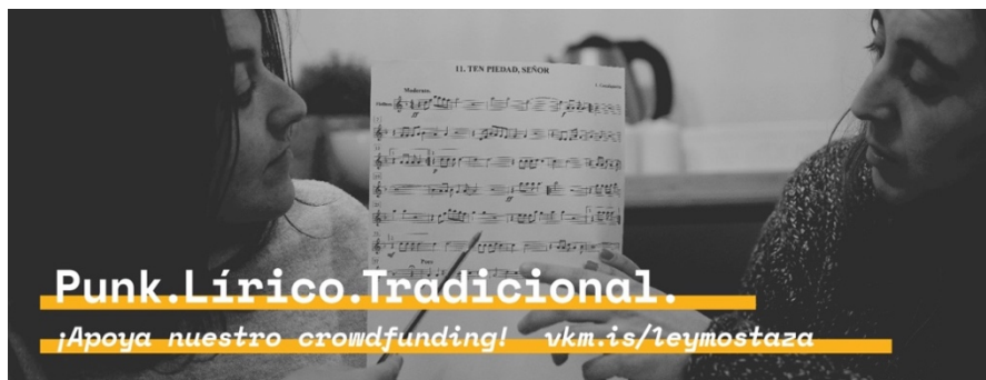
Ilustración 11. Ley Mostaza haciendo uso de la técnica de la ironía para publicitar su campaña de crowdfunding . Fuente: extraído de la página de Facebook de Ley Mostaza.