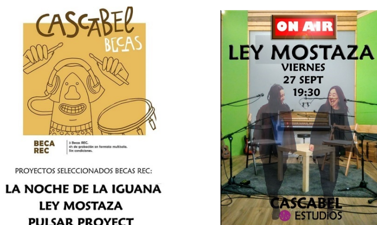
Ilustración 2. Ganadoras de la beca REC de Cascabel Producciones. Concierto grabación. 27 de septiembre de 2019.

Valladolid, algo que para ellas supuso un mayor alcance de audiencia. Por otro lado, y como puede apreciarse en las siguientes imágenes, tuvieron la oportunidad de optar a la beca Rec que el estudio vallisoletano de grabación Cascabel Producciones facilitaba, pudiendo así grabar en él un concierto con público reducido con el objetivo de publicar el que es ahora su primer disco.