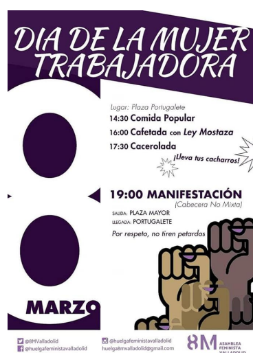
Ilustración 4. Cartel enunciativo actuación de Ley Mostaza organizada por la Asamblea Feminista de Valladolid por el Día Internacional de la Mujer Trabajadora, 8 de marzo de 2020.

Para comprender mejor este tipo de relaciones me gustaría tomar como referencia el cuestionario de seis preguntas que pude hacerle a quince personas que asistieron como espectadores a uno de los conciertos de Ley Mostaza que se encuentran vinculados con actos politizados de carácter reivindicativo, concretamente el que tuvo lugar el día 8 de marzo de 2020 en la Plaza de la Libertad de Valladolid. Este concierto, que se encontraba enmarcado en las actividades diseñadas para el Día Internacional de la Mujer y fue organizado por la Asamblea Feminista de Valladolid, pudo contar con la actuación musical del Ley Mostaza como puede verse en la siguiente ilustración: