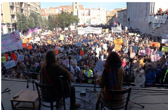
Ilustración 1: Concierto de Ley Mostaza en Valladolid organizado por la Plataforma en Defensa de la Sanidad Pública, 27 de enero de 2019.

A la hora de tratar de explicar la identidad musical de este grupo mediante una perspectiva de estudio que toma como una de sus bases el contexto personal, social y cultural, son varias las cuestiones que ilustran los que, considero, pueden llegar a ser los rasgos fundamentales que conforman la idiosincrasia de Ley Mostaza. Por ello, mediante los datos que he podido ir recabando y extrayendo a través de las sucesivas entrevistas realizadas en diferentes momentos de su trayectoria musical, a continuación, me gustaría desarrollar en este apartado algunas de esas cuestiones que esclarecen cuáles son sus visiones, tanto personales como profesionales, y qué tipo de vinculaciones presentan con la música.