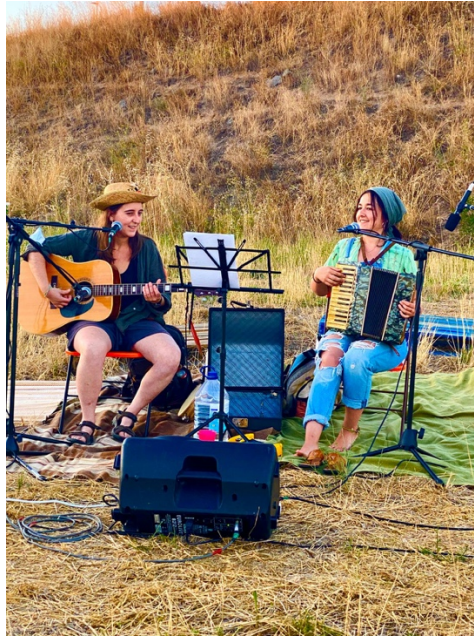
Ilustración 6: Actuación de Ley Mostaza en la Huerta del barrio vallisoletano Belén, viernes 17 de julio de 2020.

erigen como cantantes principales. No obstante, ambas componentes están de acuerdo en que su actual distribución en un futuro puede llegar a presentar cambios al no tratarse de algo inmóvil para ellas, de la misma manera que sus preferencias tampoco lo son. Tal es así que, para la creación de una de sus últimas canciones, “I.D.A”, y como puede verse en la siguiente imagen, han incorporado como novedad el acordeón: