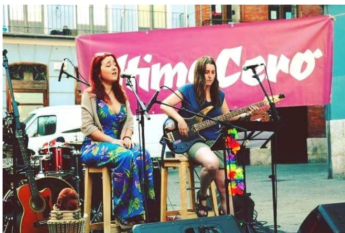
Ilustración 3: actuación en el escenario de últimoCero , 21 de junio de 2018.

para la creación de su audiencia. 46 Es importante tener en cuenta también cómo la plataforma informativa digital últimoCero 47 presentaba unas características ideológicas que pueden considerarse afines a las de Ley Mostaza, dado que la concepción de este proyecto digital partió de un interés de preservar su libertad informativa a través de la práctica de un modelo independiente basado en la autogestión y sin mordazas. 48 En este sentido, el hecho de que la plataforma apostase por alejarse de los modelos tradicionales, por los cuales se rigen hegemónicamente los medios de comunicación, ya denota un cierto carácter contestatario y subversivo en lo que respecta a su modo de concebir el periodismo y ello se corresponde, a mi entender, con el carácter reivindicativo y anticapitalista que se encuentra también patente en el grupo Ley Mostaza.