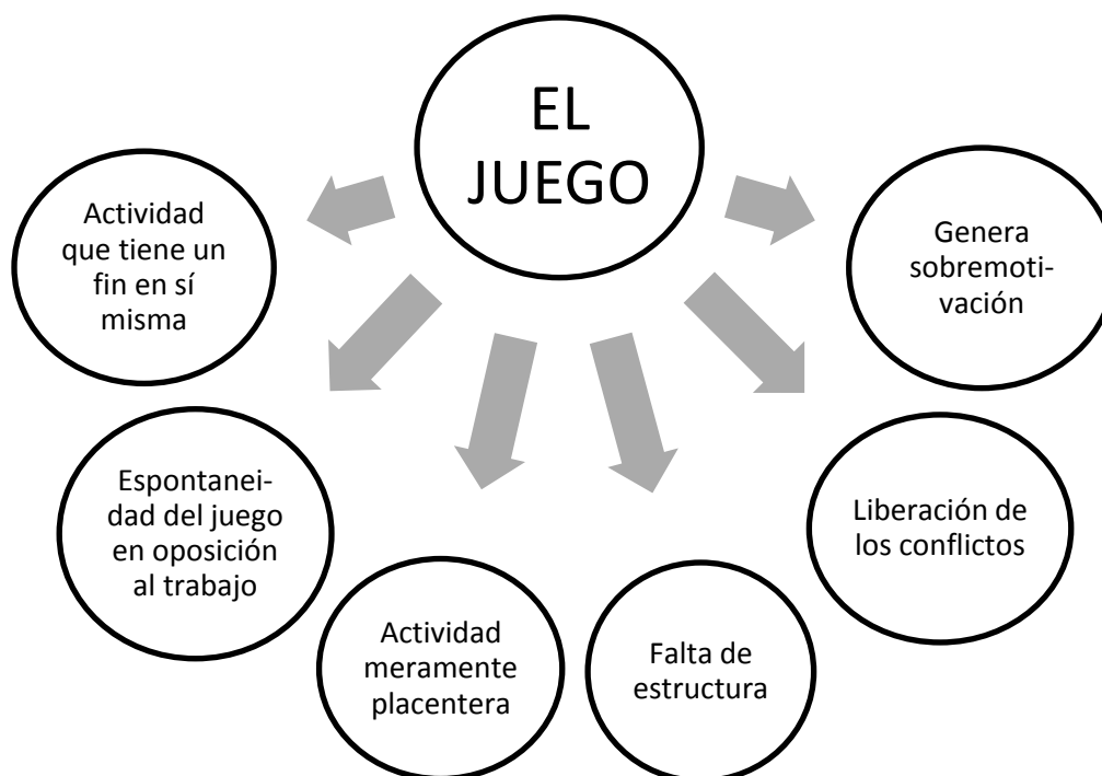
Figura 1. Características del juego según Jean Piaget.