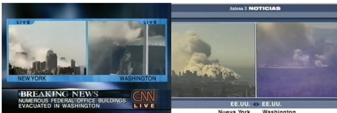
Imagen 5. Ejemplo de videowall

A la izquierda el utilizado por CNN y emitido por Antena 3 y a la derecha el creado por la televisión privada.