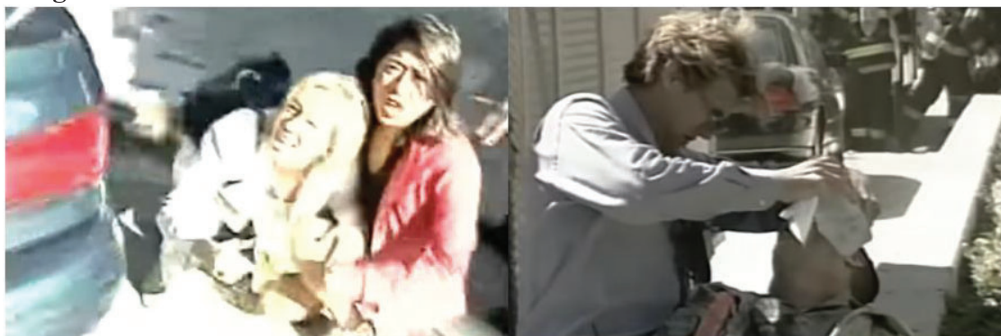
Imagen 3. Personas heridas durante el informativo de Antena 3

El informativo del 11 de septiembre de 2001 en Antena 3 no atiende con exactitud a las recomendaciones señaladas por el Colegio de Periodistas de Cataluña (2016) en las que se sostiene que los medios de comunicación no deben difundir imágenes de las víctimas de un acto terrorista. La cadena de televisión privada emite varias imágenes de personas heridas (Imagen 3) que no atienden a dicha recomendación.