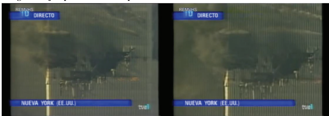
Imagen 1. Ejemplos visuales de planos detalle

La utilización de planos detalle (Imagen 1) se centra en la emisión de imágenes en las que se aprecia el humo en la parte superior de las Torres Gemelas o en las imágenes que muestran el hueco que ha provocado el impacto del primer avión con la primera de las torres. Este recurso audiovisual ha sido utilizado en 3 piezas de las 38 analizadas.