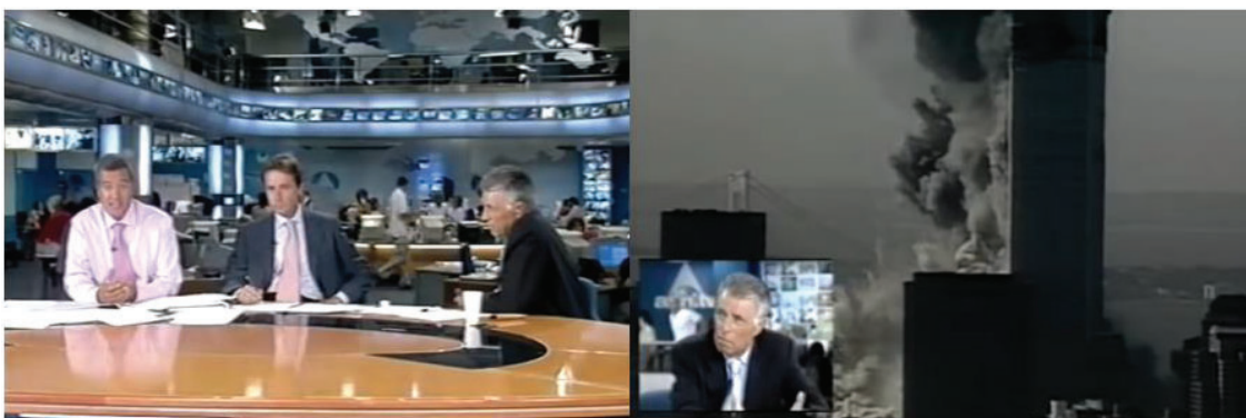
Imagen 6. Matías Prats, Ernesto Sáenz de Buruaga y Jesús Hermida en pantalla.