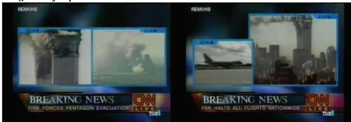
Imagen 2. Ejemplos de videowall

La técnica del videowall o video mosaico (Imagen 2), que consiste en la emisión de dos imágenes diferentes en una misma pantalla, se utiliza durante la cobertura informativa del 11-S en La 1 para mostrar las Torres Gemelas y el Pentágono ardiendo de manera simultánea. Este recurso es utilizado por la CNN y es RTVE quien lo retransmite a través de su emisión. También se utiliza la doble ventana para mostrar la llegada en avión del Presidente de los Estados Unidos, George Bush, a Nueva York y de manera simultánea el Pentágono ardiendo.